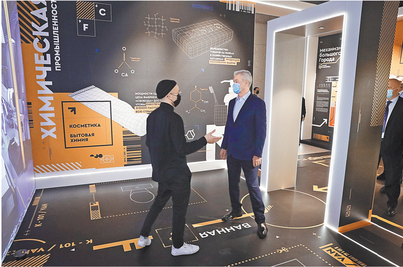
Сергей Собянин осмотрел экспозицию выставки «Открой Моспром. Механизмы Большого города».