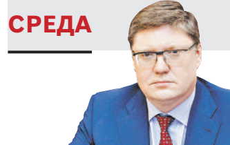
Андрей Исаев, заместитель руководителя фракции «Единая Россия» в Государственной Думе