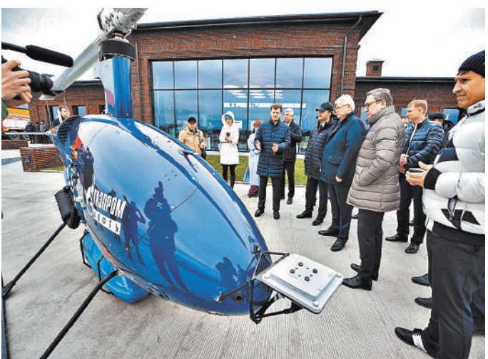
В Томской области предлагают применять беспилотники для доставки грузов до полутора тонн, аэрофотосъемки и сельскохозяйственных работ.