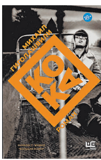
Пересказать весь сюжет последнего романа Михаила Гиголашвили «Кока» невозможно.

Алексее Михайловиче Тишайше после раскола церкви потекли реки крови старообрядцев. Это тоже заставляло людей вспоминать о временах Грозного, как о «тихих» временах. Если его дед, Иван Великий, собрал в кулак русские княжества, то Грозный присоединил Казань и Астрахань. Его люди под началом купцов Строгано-