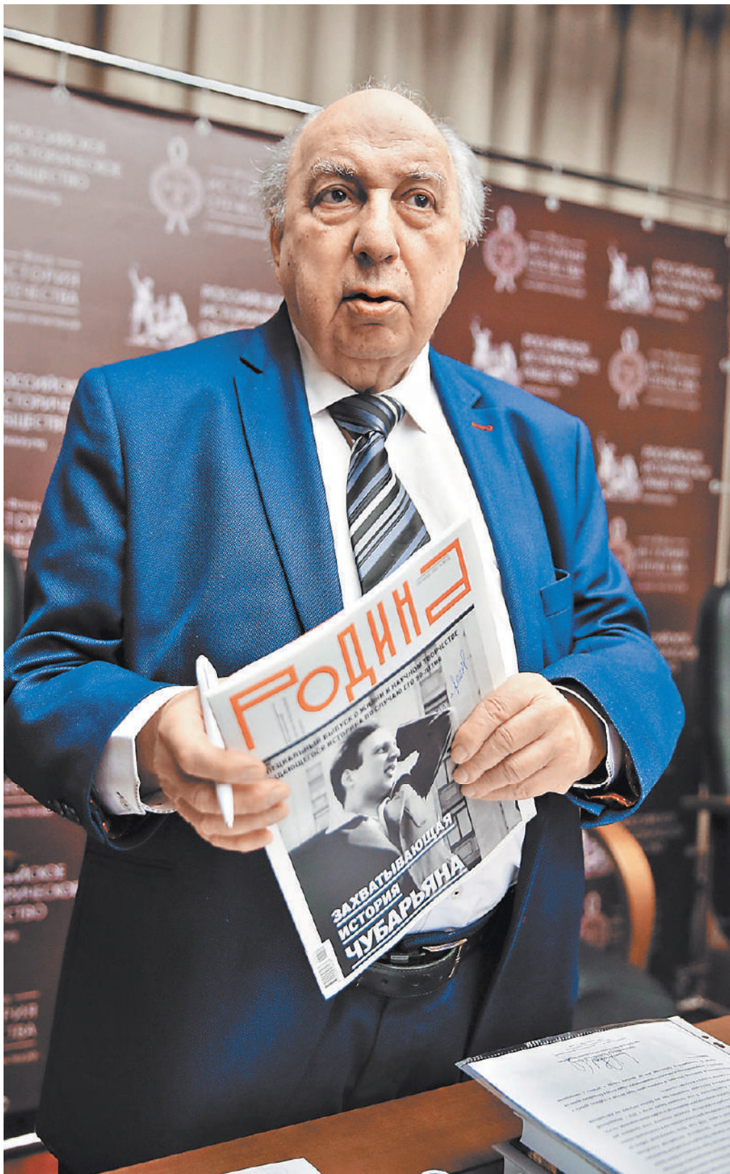
Усилиями академика прошли несколько масштабных международных мероприятий в Москве. Это Генеральная ассамблея международного комитета исторических наук (2017) и Всемирный конгресс школьных учителей истории (2021).

Кстати, на недавней коллегии тюремного ведомства эксперты