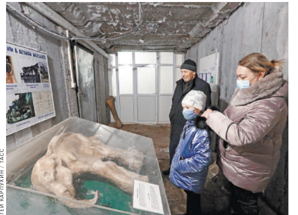
Ученые уверены, что нынешние экспонаты музеев будут бродить по тундре.

Джордж Черч планирует вырастить первый гибрид в течение пяти лет. Затем будет создана целая популяция таких особей, способных выжить в Арктике. Надо отметить, что скинувшиеся на проект бизнесмены далеко не меншаты. Они намерены на мамонте хорошо заработать. Даже если цель не будет достигнута, будут разработаны новые технологии по предотвращению вымирания видов, которые можно продать потенциальным клиентам.