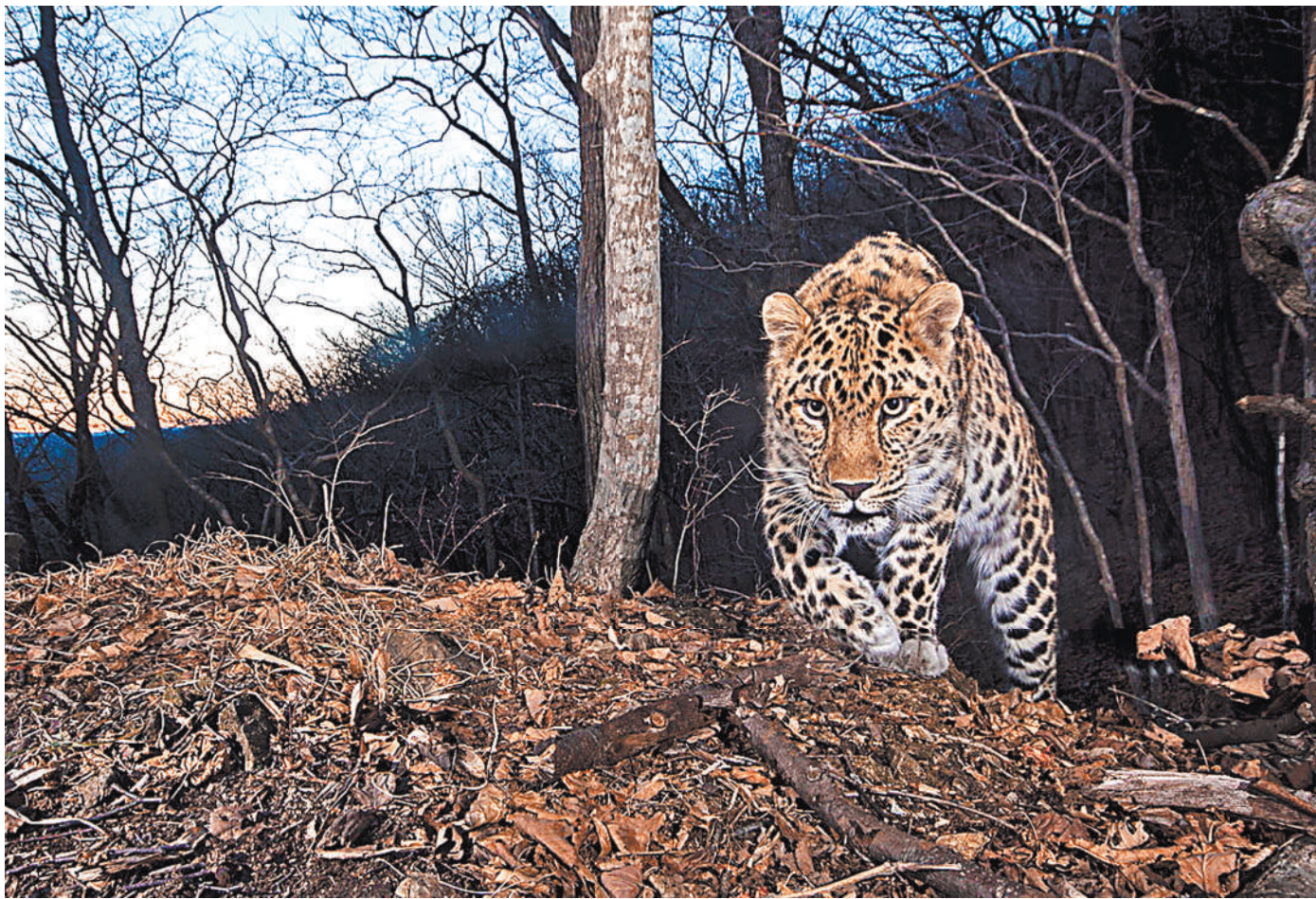
Дальневосточные леопарды — самая редкая в мире большая кошка. Они едва не вымерли. Благодаря парку «Земля леопарда» сегодня их уже более ста.

Программа модернизации первичного звена рассчитана на пять лет — до 2025 года. ●