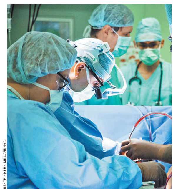
Специалисты центра имени Мешалкина проводят очередную уникальную операцию.

Одышка и боли у пациента прошли. Сердцебиение полностью нормализовалось. Мужчина вернулся в родной Владивосток и уже планирует в ближайшее время выйти на работу. А на следующее лето — отправиться с друзьями в поход.