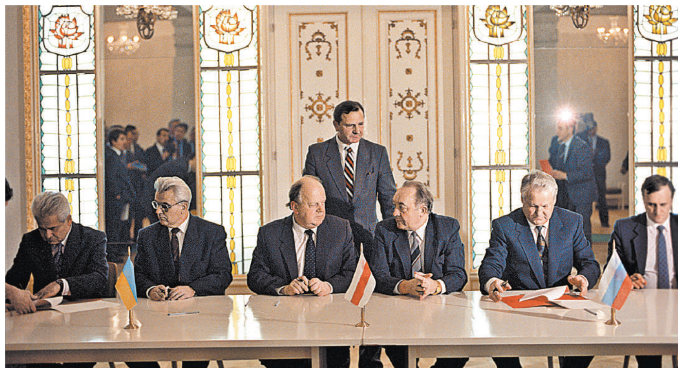
Беловежская пуща. Президент Украины Леонид Кравчук (второй слева), председатель Верховного совета Белоруссии Станислав Шушкевич (третий слева) и президент России Борис Ельцин (второй справа) после подписания Соглашения о создании Содружества Независимых Государств. 8 декабря 1991 года.

Нет ничего хуже. Это хорошо показали февраль — октябрь 1917 года, 1988–1991 годы. Как только двоевластие набирает силу — деструкция и распад неизбежны.