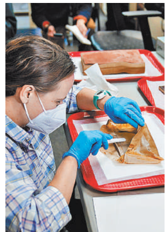
В капсулу времени попала вода, поэтому книги и конверт эксперты извлекали предельно осторожно.

Самую статую генерала, который руководил армией Конфедерации штатов Юга в годы гражданской войны в США (1861—1865), демонтировали еще в сентябре. Но хотя в архивах и говорилось о заложении капсулы, найти ее не удалось больше трех месяцев. Небольшую коробку из свинца обнаружили не там, где ожидалось. Ее перевезли в специальную мастерскую, где у специалистов долго не получалось ее вскрыть. Когда спустя пять часов крышка все же поддалась, выяснилось, что капсула не сохранила герметичности, поэтому бумажные артефакты изрядно промокли. Исследователи пока не стали их открывать, опасаясь повредить, а отправили на сушку. Наконец, и содержимое послания вызвало вопросы. Историки рассказали в архивах XIX выпуск газеты The New York Times того времени, в котором описывается закладка капсулы, и с удивлением обнаружили расхождение между статьей и реальностью. Во-первых, контейнер должен был быть больше по размерам и сделан из меди, а не свинца. Во-вторых, в содержимом ста-