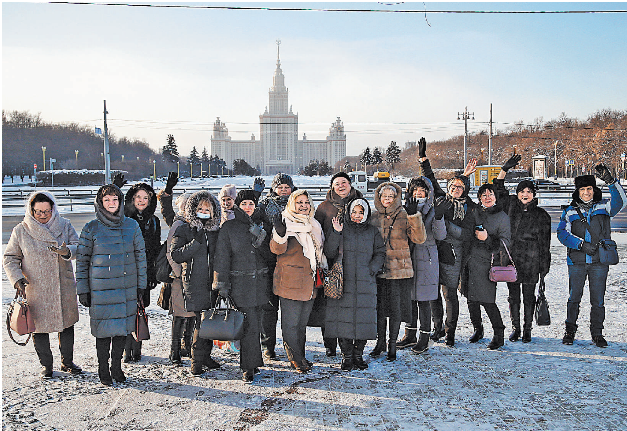
Москва встретила учителей — победителей Пушкинского конкурса крепким морозом и душевным теплом.

А кто дает команды этой команде? Одно сердце знает. ●