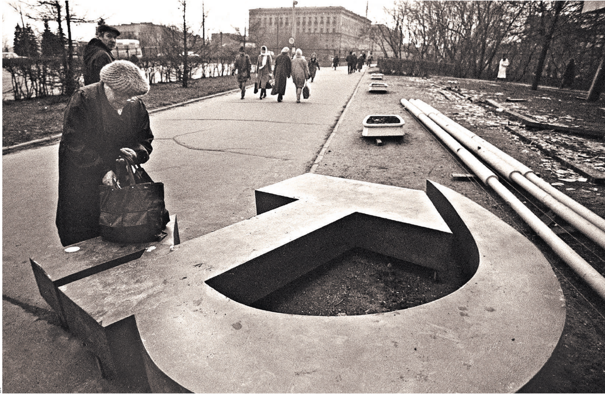
Москва. Март, 1991 год.

«Такое положение дел может привести к возникновению... опасной общественно-политической ситуации... Прошу Вас принять решение