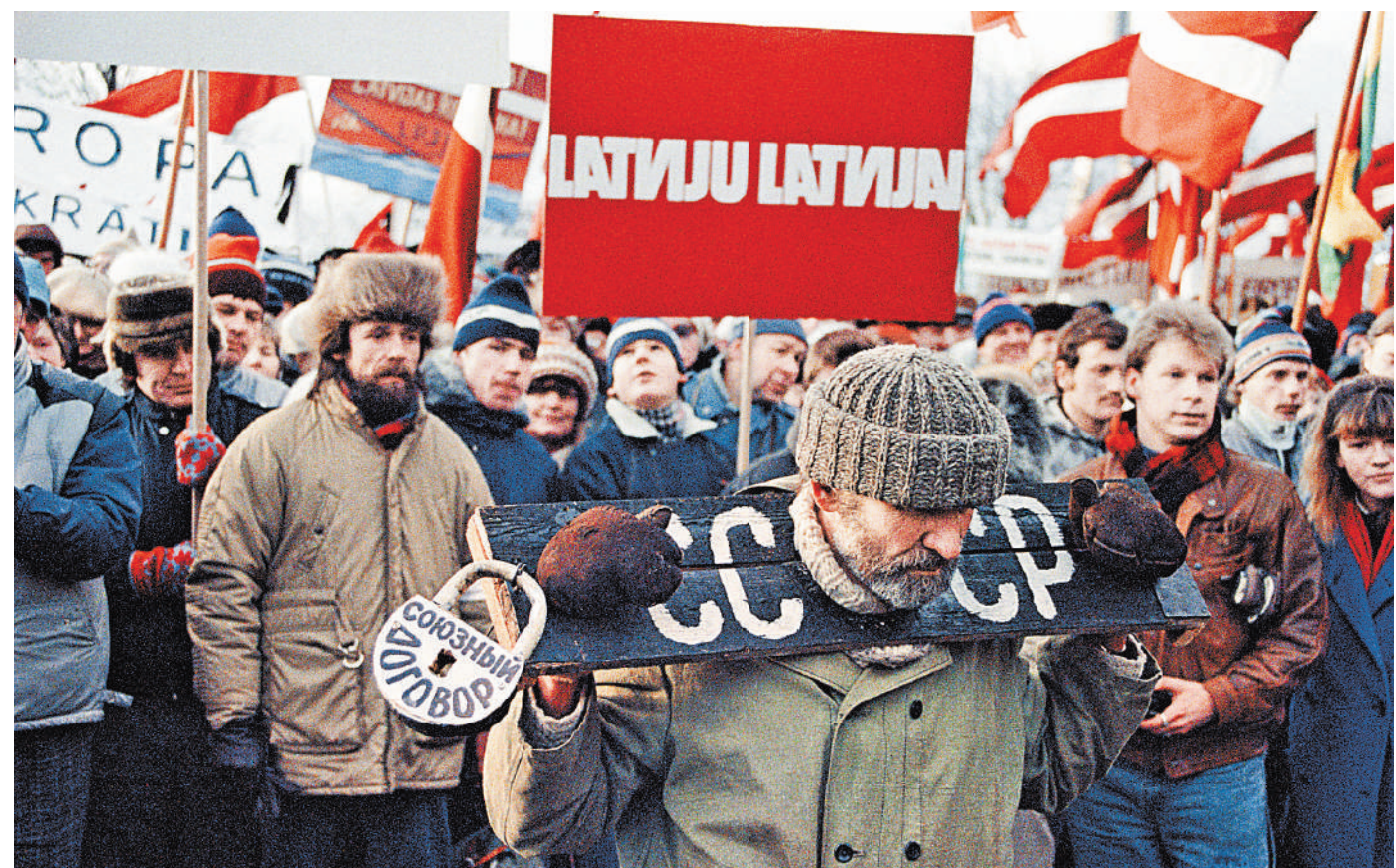
Манифестация в Риге. 1991 год.

— Еще больше фото смотрите на сайте rg.ru/art/2216669