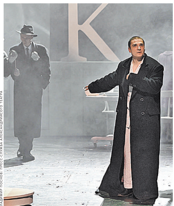
Режиссер уводит «Процесс» в традицию фантазмагии и ставит Кафку, как Булгакова или Гофмана.