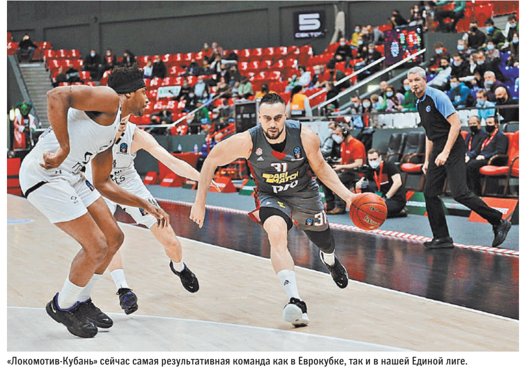
«Локомотив-Кубань» сейчас самая результативная команда как в Еврокубке, так и в нашей Единой лиге.

Под занавес первого круга Евролиги казанский УНИКС в жестком матче 17-го тура против испанской «Барселона» упустил верную победу. После трех четвертей гости лидировали с разницей в 17 очков, но позволили сопернику сравнять счет и перевести игру в овертайм. В дополнительной пятиминутке сильнее была «Барса» — 17:15. Итоговый результат — 111:109.