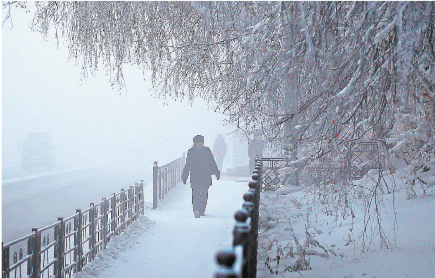
В Якутии практически во всех районах ночью фиксируется минус 54–59 градусов, днем — до 45 градусов мороза и ниже.

Вечером четверга без горячей воды в Улан-Удэ оставались 1328 многоквартирных жилых домов. В двух было отключено отопление, но затем тепло-