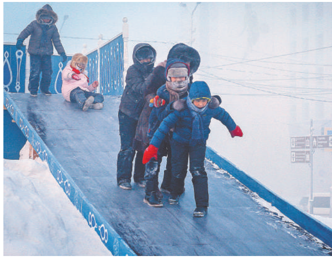
Школьные занятия отменены, но веселье отменить невозможно.

К вечеру четверга без горячей воды в Улан-Удэ оставались 1328 многоквартирных жилых домов. В двух было отключено отопление, но затем тепло-