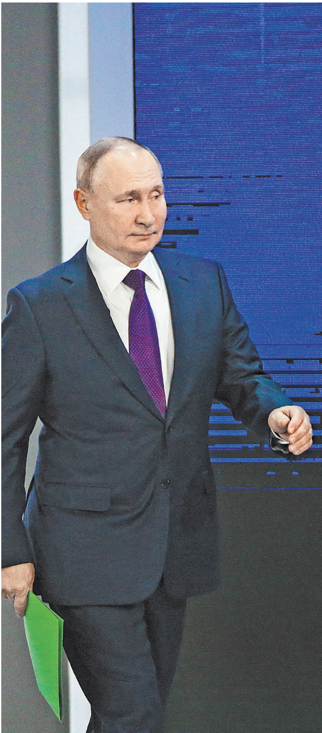
Владимир Путин: Задача государства в вопросах демографии — в ближайшее время выстроить окончательно всю цепочку, связанную с поддержкой материнства и детства: от рождения и до окончания школы.

Инфляция восемь процентов ожидается. Это гораздо больше, чем прогнозировали. Но все равно рост реальных доходов за вычетом этих инфляционных расходов все-таки 4,1 процента. По году будет — специалисты ожидают, эксперты наши, — 3,5 процента рост реальных доходов. Конечно, далеко не у всех категорий граждан. Конечно, это средние показатели, я хочу еще раз это подчеркнуть, когда граждане будут смотреть, слушать, скажут: ну вот, опять там