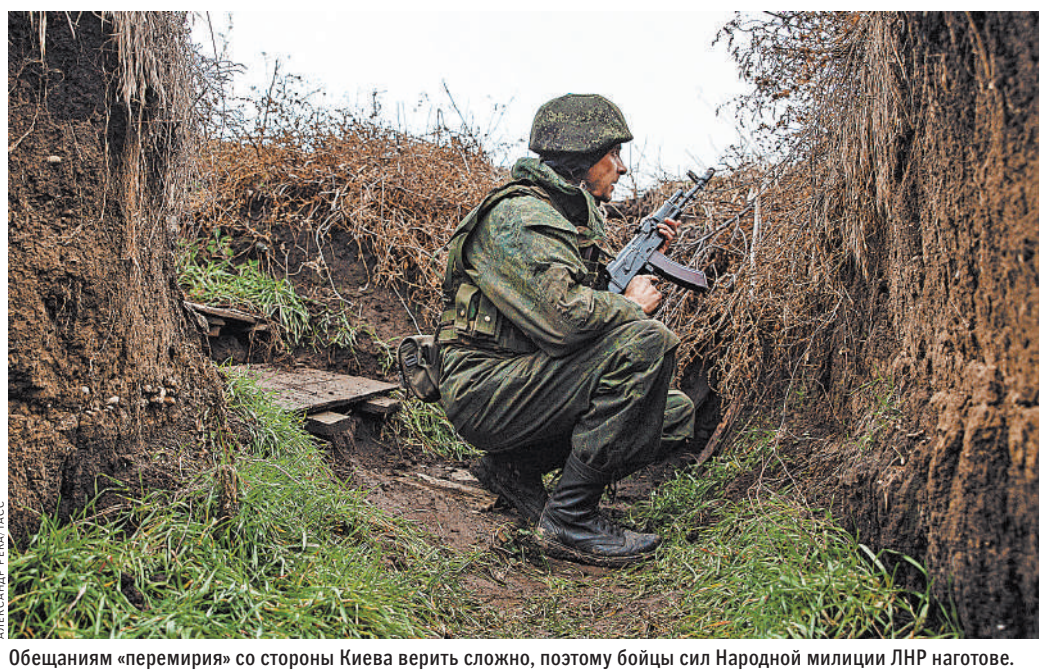
Обещаниям «перемирия» со стороны Киева верить сложно, поэтому бойцы сил Народной милиции ЛНР готовятся.