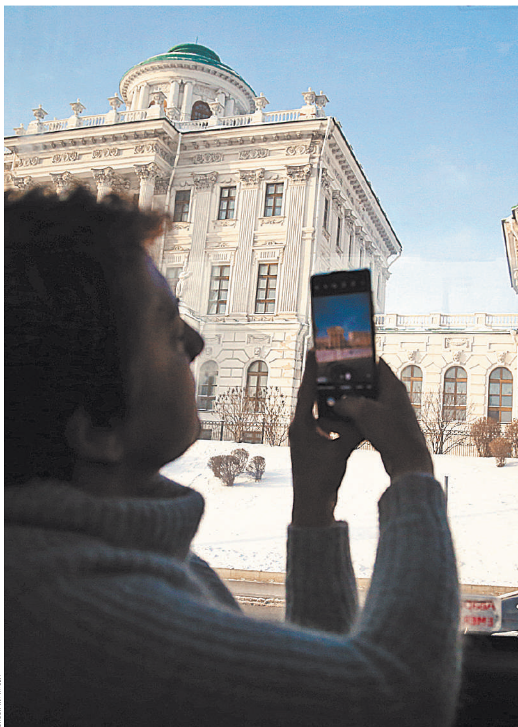
Первый раз в Москве. Хочется запечатлеть все на память.