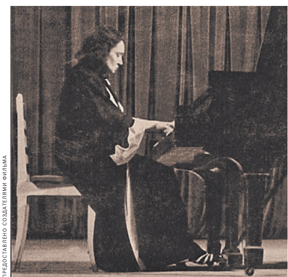
Мария Юдина в первые дни войны записалась на курсы санитарок, но поняла, что искусство принесет больше пользы.

Но в фильме мы рассказываем не только о Юдиной. Среди наших героев — Герой Советского Союза, казахская девушка 20 лет Маншук Маметова, и фронтовые операторы, благодаря которым мы смогли увидеть уникальную хронику, в том числе и тяжелых боев за Невель.