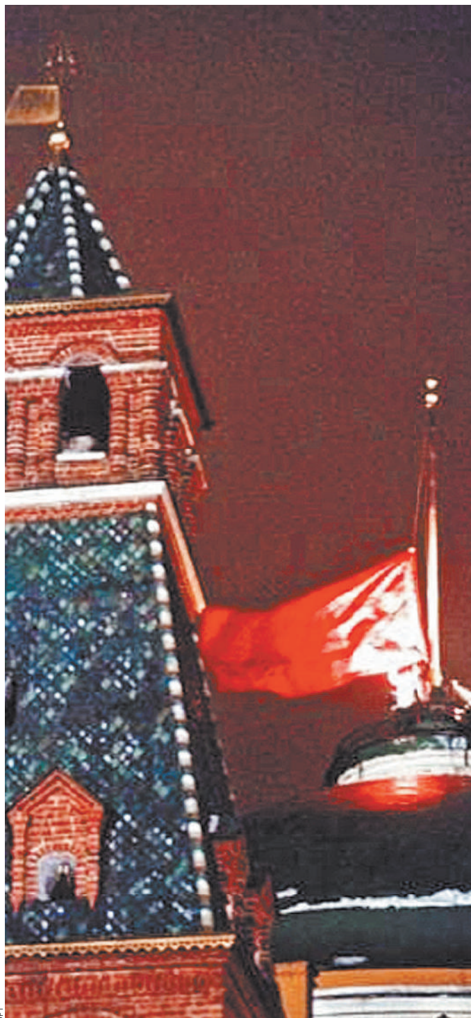
25 декабря 1991 года. Так спускали флаг Советского Союза и поднимали флаг новой России.