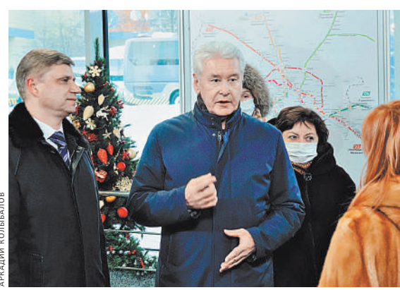
Сергей Собянин: В 2021 году построено и реконструировано восемь новых вокзалов.

В Еврейской автономной области морозы до минус 36–38, а местами минус 40 градусов будут стоять до 27 декабря. В регионе объявили штормовое предупреждение.