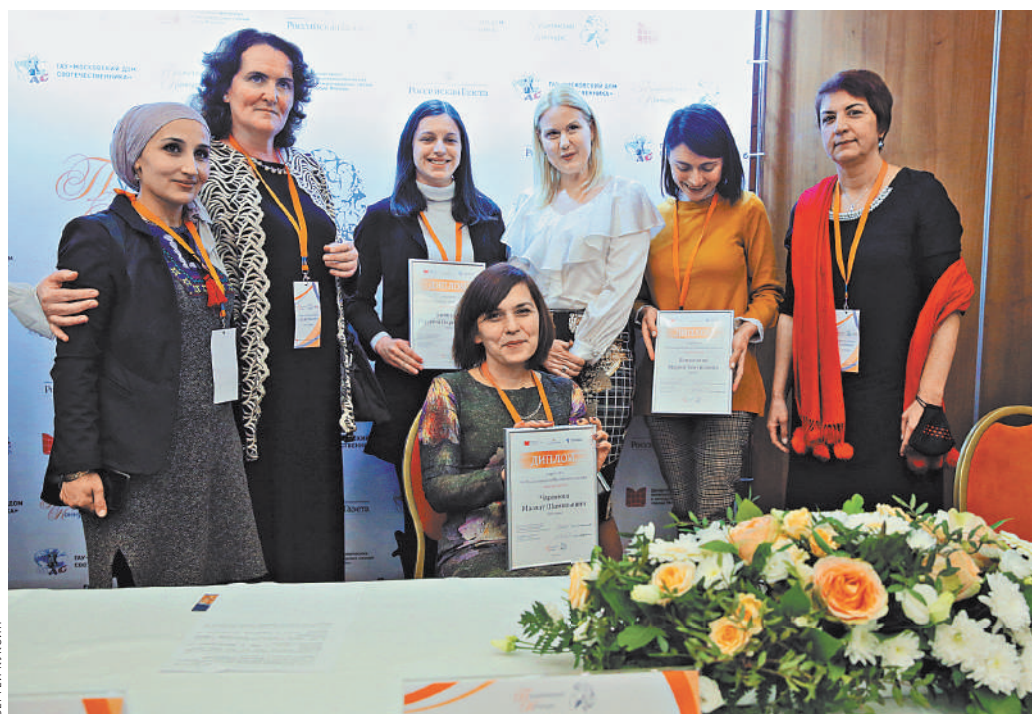
Сирия, Сербия, Таджикистан, Грузия, Венгрия... Послы русского языка.