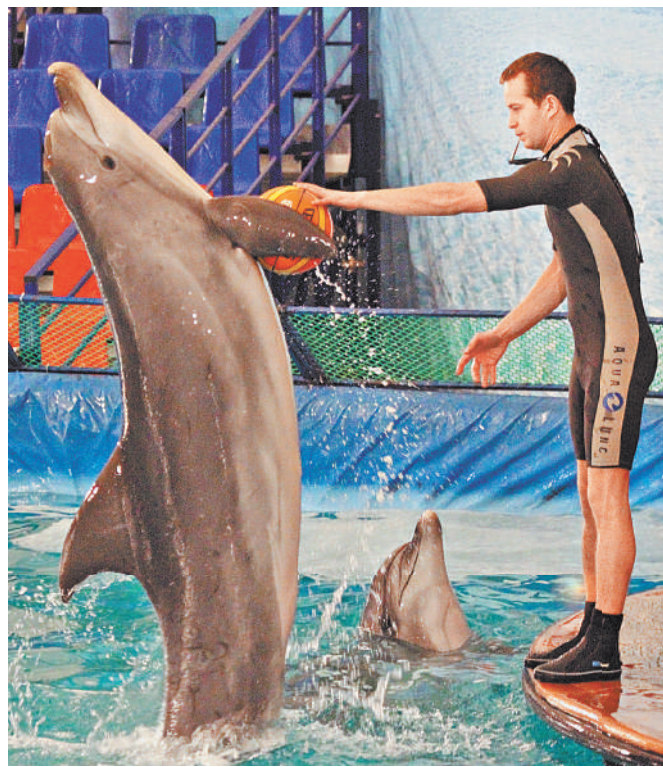
Дельфины, белухи, касатки рождены свободными, напоминают экозащитников. И по-настоящему красивы только в естественной среде обитания.

Ранее, в диалоге с правозащитниками, Владимир Путин