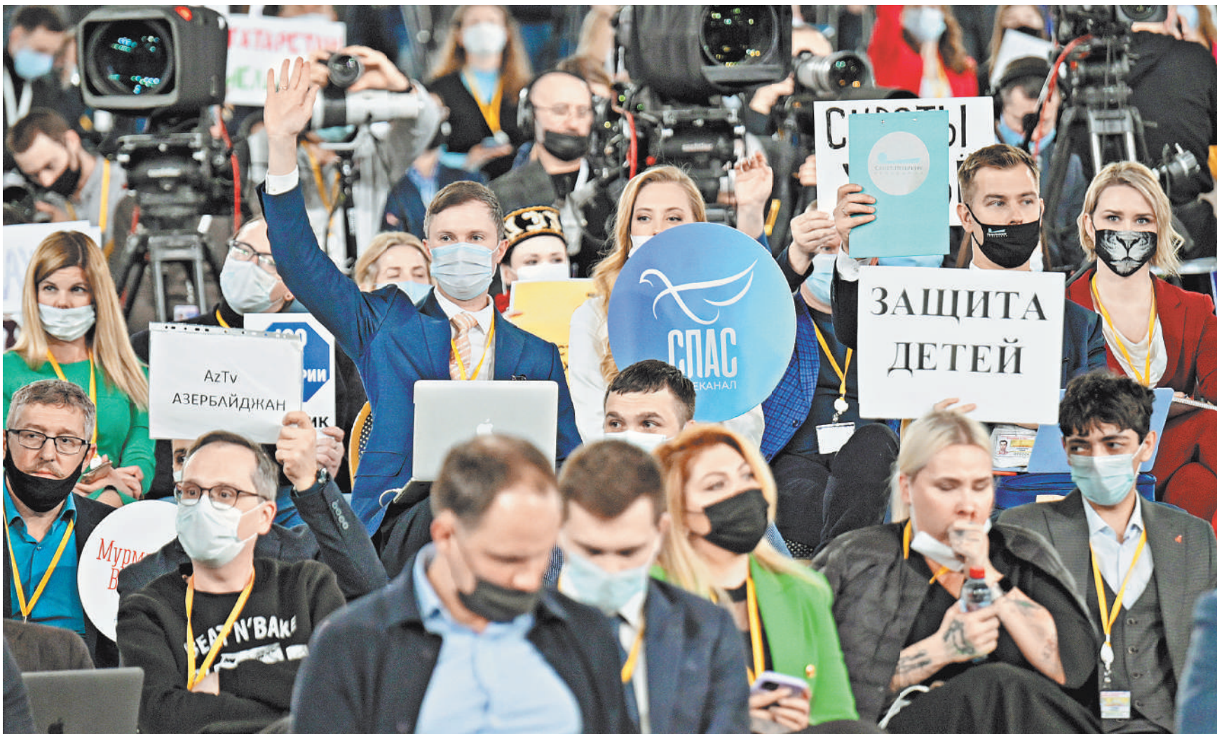
В мероприятии участвовали 507 представителей средств массовой информации.

тались воспринимать заявления, озвучивать высказывали. Нет — идите вы со своими озабоченностями, будем делать то, что считаем нужным.