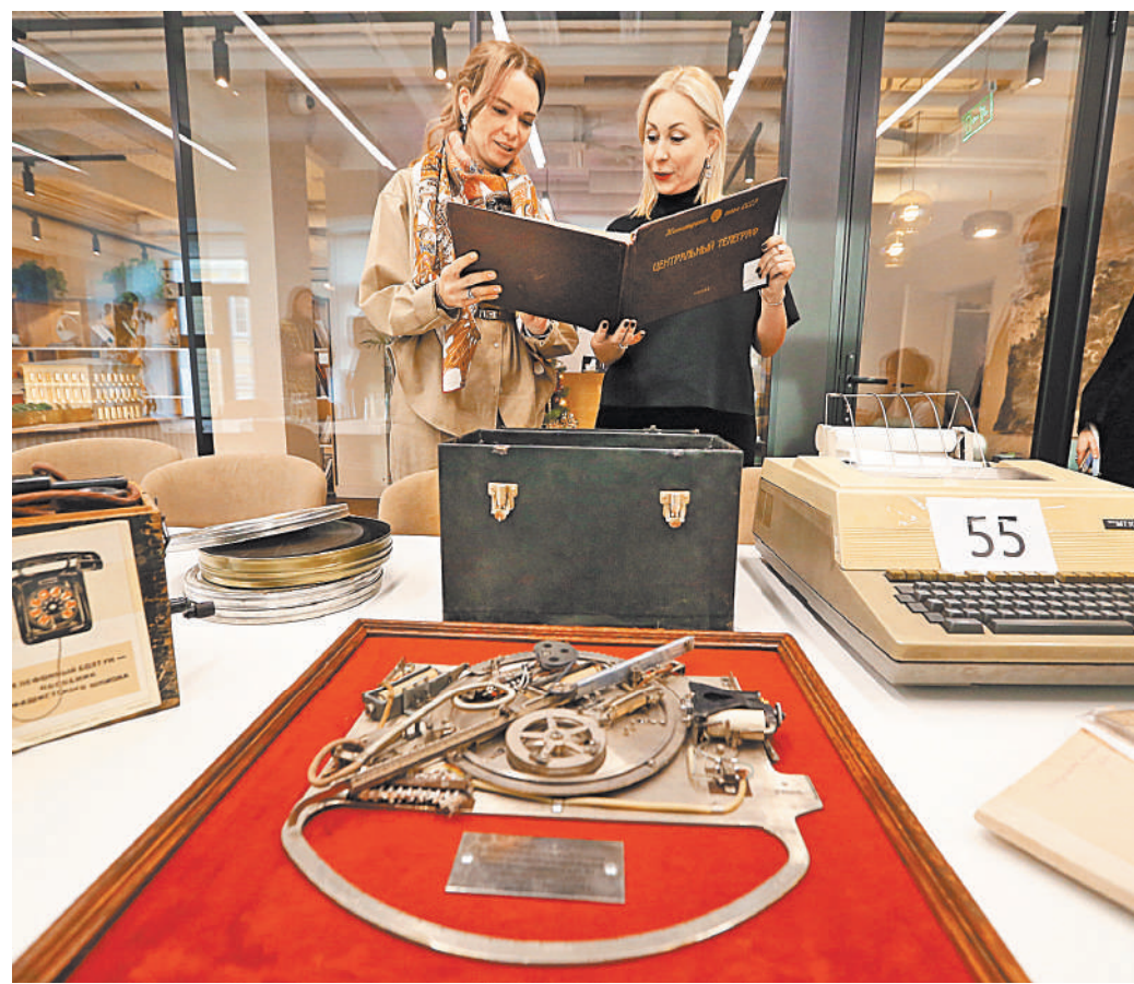
Коллекцию телеграфа сейчас изучают музейные сотрудники.