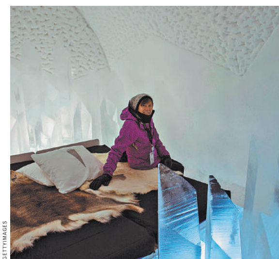
В отеле в деревне Юккасарви из льда сделаны не только кровати, но и вся посуда, декор и даже люстры.