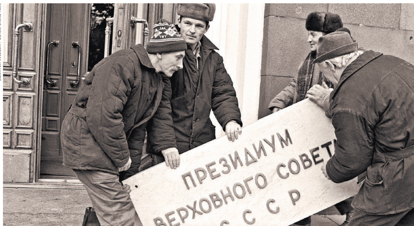
Вывеску сняли. Что дальше?