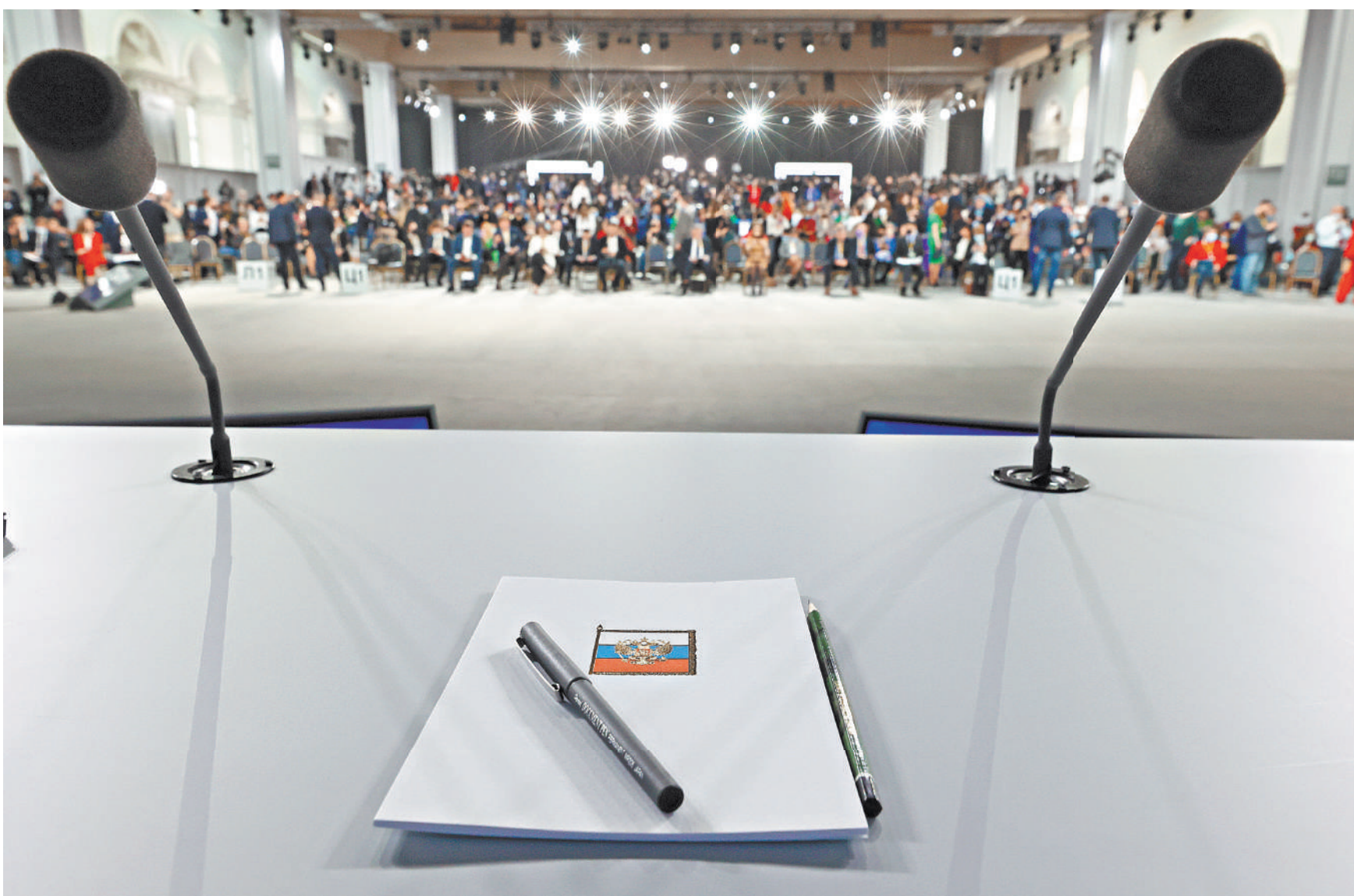
Пресс-конференция проходила в столичном Манеже. Взгляд из зала с места президента.

А потом начали расширять НАТО на восток. Естественно, мы же говорили: не надо этого делать, вы нам обещали не делать. А нам говорят: «А где это написано на бумажке? Нету? Ну и все, идите вы подальше, плевать мы хотели на ваши озабоченности». И так из года в год. Каждый раз мы огрызались, пы-