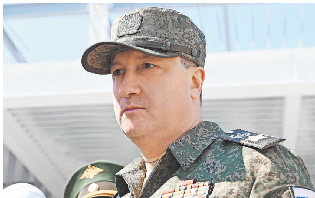
Заместитель министра обороны РФ Тимур Иванов: Задачи нам ставят президент и министр обороны, мы их выполняем — в срок или досрочно.

ВСК — сегодня это порядка 30 тыс. сотрудников, это одна из самых эффективных и мощных производственных структур, специалисты которой могут выполнять сложнейшие задачи в любой точке страны и даже за ее пределами. Задачи нам ставят президент и министр обороны. Мы их выполняем: в срок или как это зачастую происходит досрочно. К примеру, на реке Бельбек построен водозабор, обеспечивший в критический момент пресной водой Севастополь, грандиозный памятник Александру Невскому и его дружина на месте Ледового побоища. Ранее в Карелии специалисты ВСК возвели первый в истории республики полноценный пассажирский терминал аэропорта и современный командно-диспетчерский пункт. Все эти объекты — яркие «звездочки» на карте страны труда ВСК. Сегодня очень важно не останавливаться на достигнутом, идти вперед. Только «вир», как говорят строители. ●