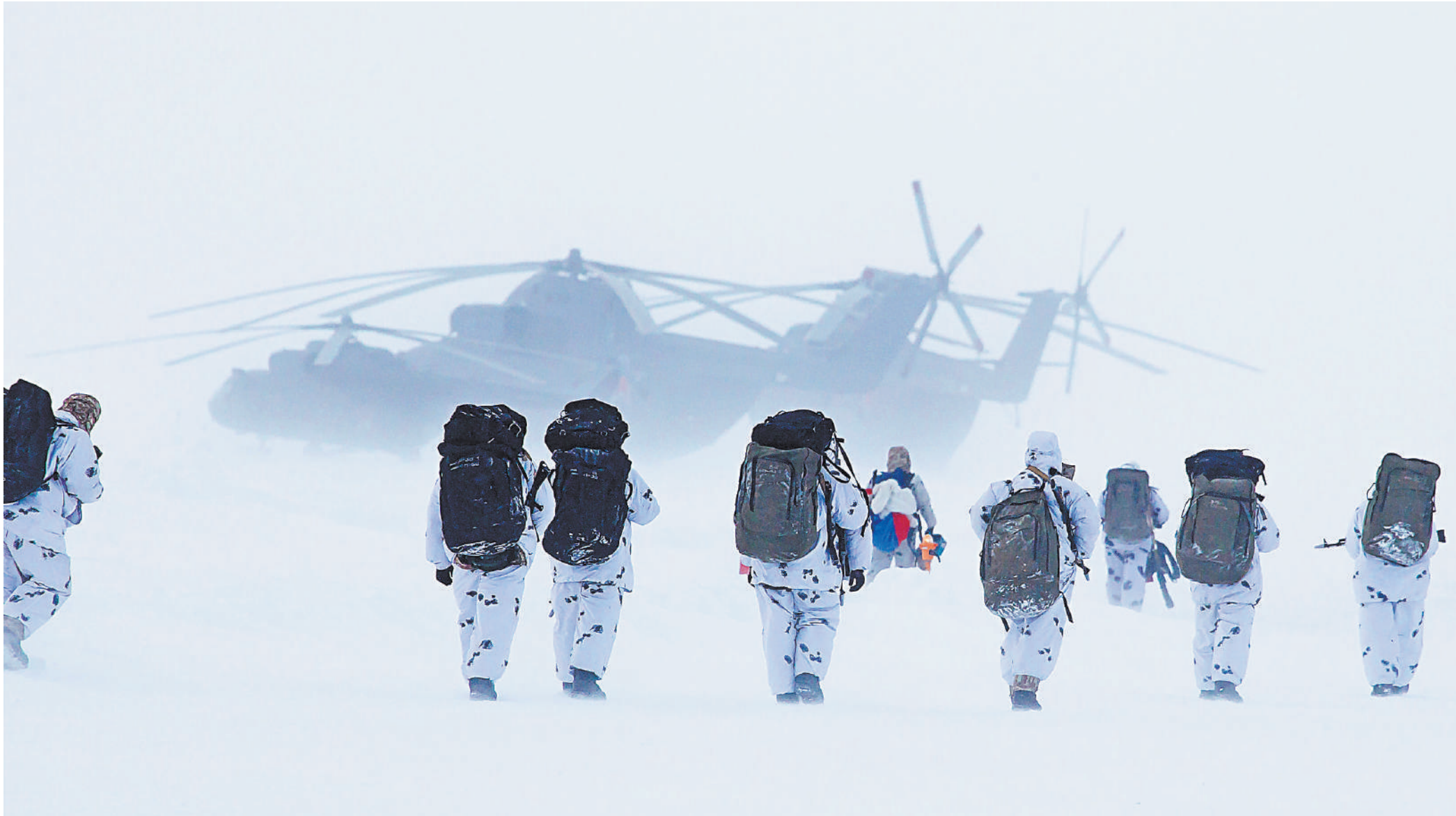
Там наш десант в 2014 году высаживался на Котельный (Новосибирские острова). А сейчас здесь база «Северный клевер». Романтикам на заметку: Землю Санникова ее открыватель купец Яков Санников видел именно с Котельного.

Тимур Иванов: Мы совместно с Черноморским флотом завершили масштабную реконструкцию единственного в мире музея — подземной базы подводных лодок в крымской Балаклаве. Как результат: атмосфера аутентичной противолодочной подземной базы дополнена современными мультимедийными технологиями. Увидите там субмарину С-49 проекта 633РВ. За