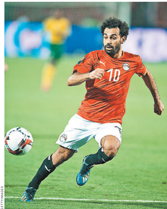
Звезда египтян Салах готов впервые выиграть Кубок Африки.

Главными фаворитами турнира считаются Сенегал и Египет с Мохаммедом Салахом в составе