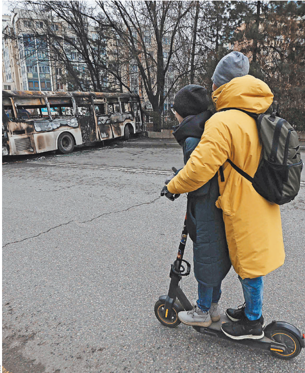
Мирная жизнь постепенно возвращается в казахские города, где прошли массовые беспорядки. Но работы коммунальным службам предстоит еще много. На улицах остаются сгоревшие автобусы и автомобили.