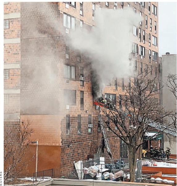
Причиной возгорания стал неисправный электрообогреватель в одной из квартир.

По заявлениям городских властей, пожар в жилом здании в нью-йоркском квартале Бронкс стал одним из самых разрушительных в истории Нью-Йорка. Погибло 19 человек, включая 9 детей, пострадали 63 человека. С огнем боролись более 200 пожарных. По предварительным данным, причиной возгорания стал неисправный электрообогреватель, оставленный в работающем состоянии в одной из квартир. Огонь и дым моментально распространились по всему зданию, заблокировав многим жителям путь к выходу. Дом был оборудован пожарной сигнализацией, которая сработала в штатном режиме. Однако многие погорельцы проигнорировали сирену, поскольку сигнализация в доме ранее неоднократно срабатывала ложно. В здании жили в основном представители мусульманских меньшинств, в частности выходцы из Гамбии. Сейчас городские власти озабочены тем, чтобы организовать похороны погибших в соответствии с исламскими традициями. ●