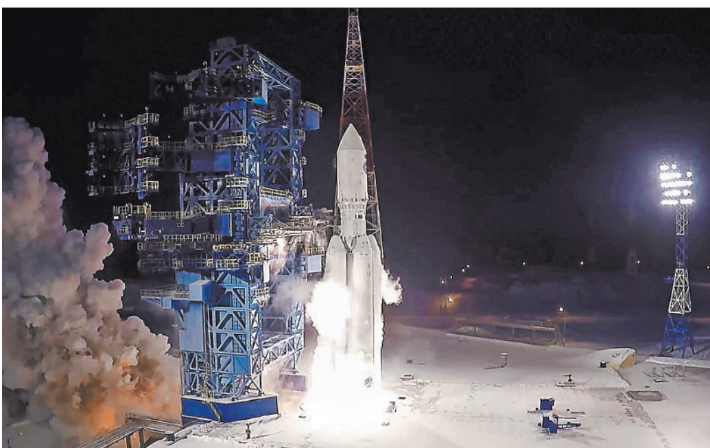
Испытательный пуск тяжелой ракеты-носителя «Ангара-А5» с габаритно-массовым макетом полезной нагрузки, космодром Плесецк, 27 декабря 2021 года. Испытания ракеты «Ангара» идут по плану.