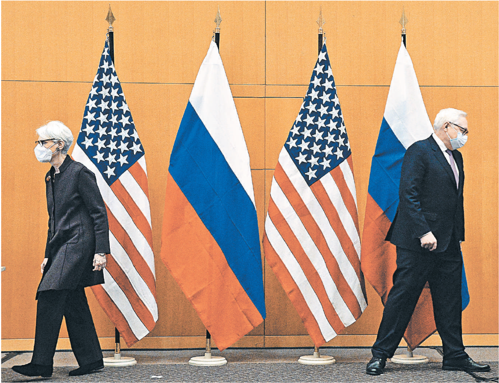
У Сергея Рябкова и Венди Шерман имеется успешный опыт переговоров — в 2015 году они возглавляли делегации своих стран на переговорах в Швейцарии по иранской ядерной программе.

На фоне заявленных МИД России максимальных требований по полной ликвидации военного присутствия и инфраструктуры НАТО «на восточном фланге», прогресс по вопросам контроля над вооружениями теоретически может «вытянуть» крайне сложные переговоры. Российским экспертам хорошо известно о вышедшей на финишную прямую форсированной разработке в США нового подвижного комплекса MRC (Mid-Range Capability) «Тайфун» с ракетами средней дальности Tomahawk и SM-6. Основное предназначение этой наступательной ракетной системы, в которой в недалеком будущем предусматривается использование нового гиперзвукового оружия, — развертывание в Европе. Реализация такого сценария чревата для России кардинальным ухудшением стратегического баланса сил на западном направлении с резким сокращением времени полета вражеских ракет до ключевых элементов наших оборонительных систем. И предупреждение Рябкова о вынужденном переходе России к военно-техническому «устрашению оппонентов» в случае неполучения гарантий