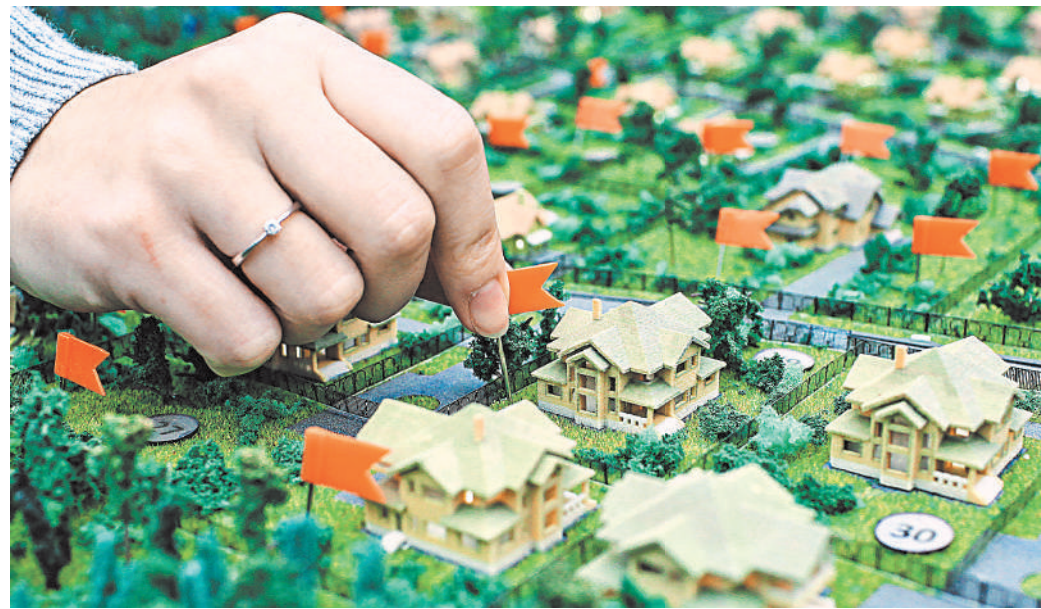
Закон регулирует и использование общего имущества в новых малоэтажных поселках.

— Рослесхоз разъяснил новые правила строительства домов в лесу rg.ru/art/2242846