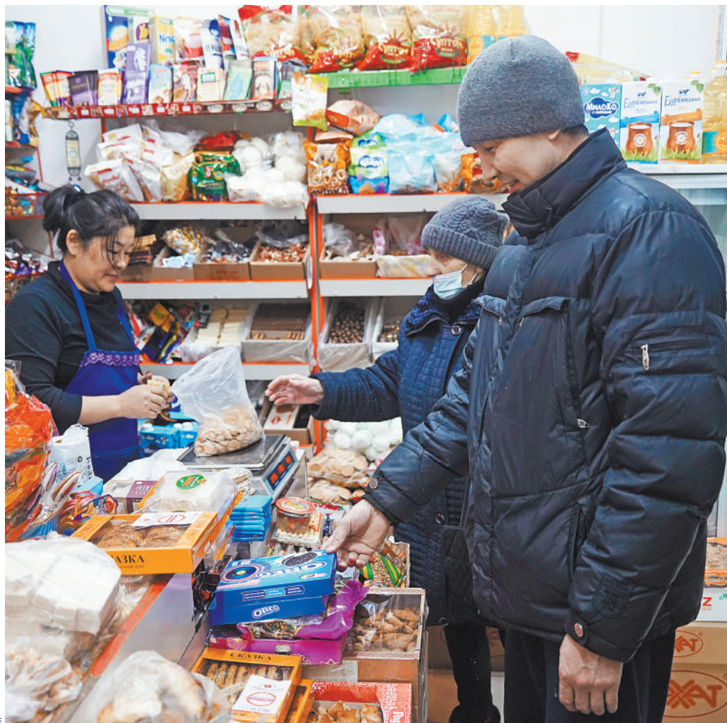
Магазины в Алма-Ате заработали, но карточкой расплатиться можно пока только в крупных супермаркетах. Небольшие торговые точки по-прежнему принимают только наличные.