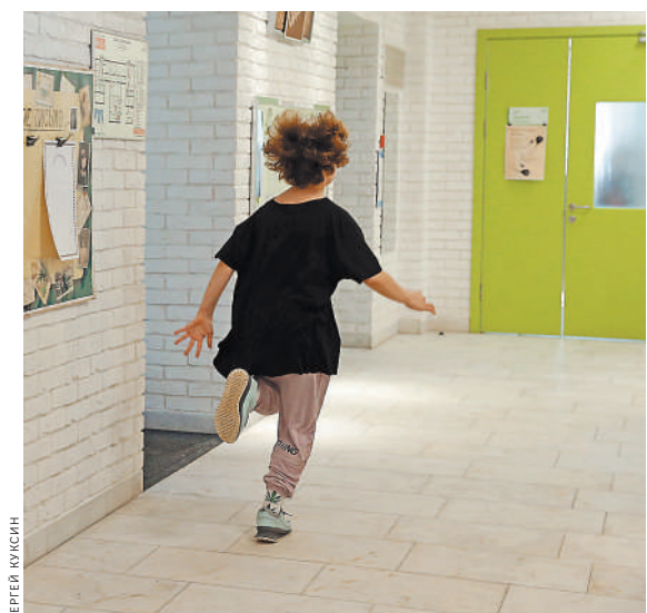
Трудный ребенок — не только тот, с которым сложно дружим. В первую очередь ему сложно с самим собой.