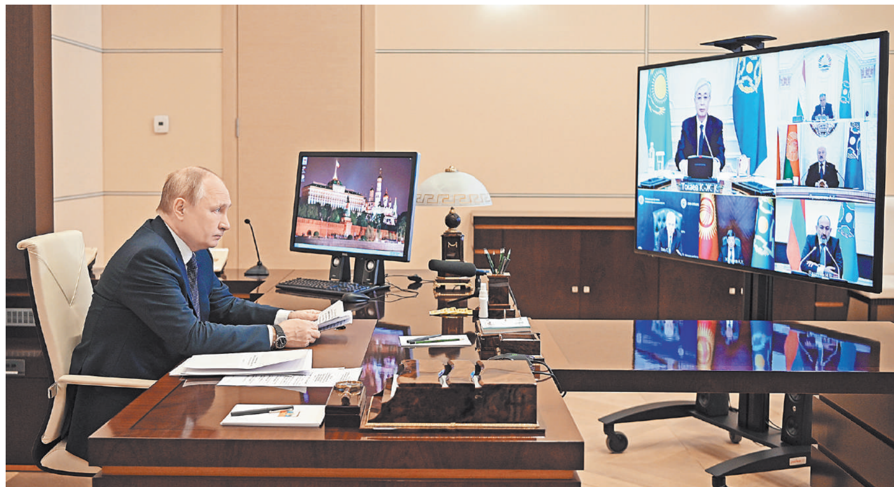
Владимир Путин: ОДКБ на деле показала свой потенциал, способность действовать быстро, решительно и эффективно.