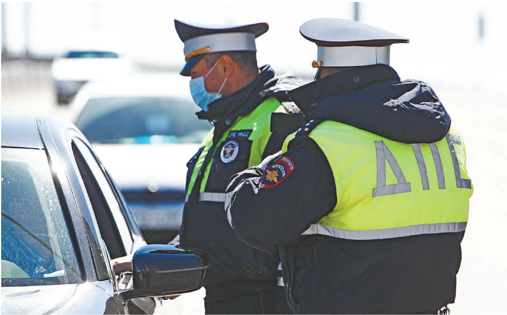
Сотрудники ГИБДД не смогут проверять техническое состояние автомобиля на дороге, если на него оформлена диагностическая карта, за исключением случаев, когда неисправность автомобиля налицо. Однако единственное, чем грозит это автомобилисту, — штраф 500 рублей за управление неисправным автомобилем. Но если неисправны тормоза или рулевое управление либо тягово-сцепное устройство, то автомобиль будет задержан и отправлен на штрафстоянку.