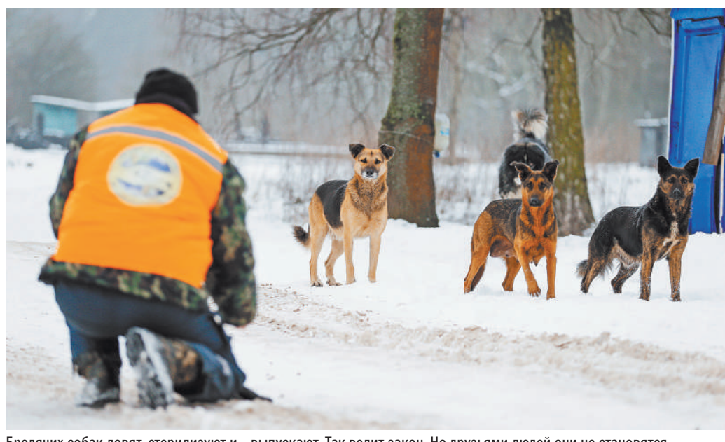
Бродячих собак ловят, стерилизуют и... выпускают. Так велит закон. Но друзьями людей они не становятся.

Все по тому же закону стерилизованные животные без владельцев или неснимаемые метки, повторно отлову не подлежат. Кстати, метка и стерилизация не делают всех собак «белыми и пушистыми». И не гарантируют отсутствие у них агрессии, особенно если псы голодные.