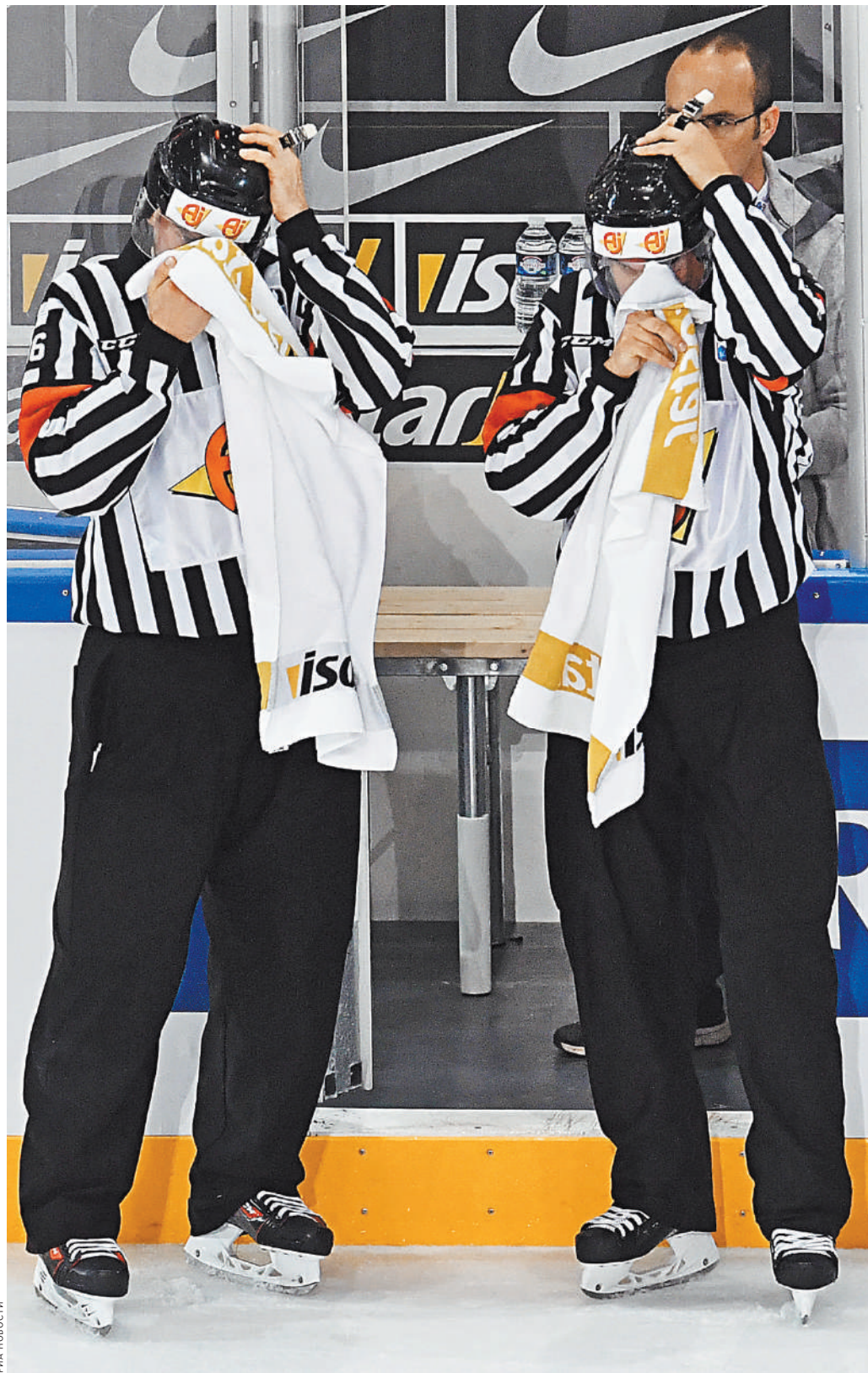
Зараженный ковидом все больше, но КХЛ решила продолжать регулярный чемпионат.

К сегодняшнему дню отменено или перенесено уже 13 матчей регулярного чемпионата КХЛ