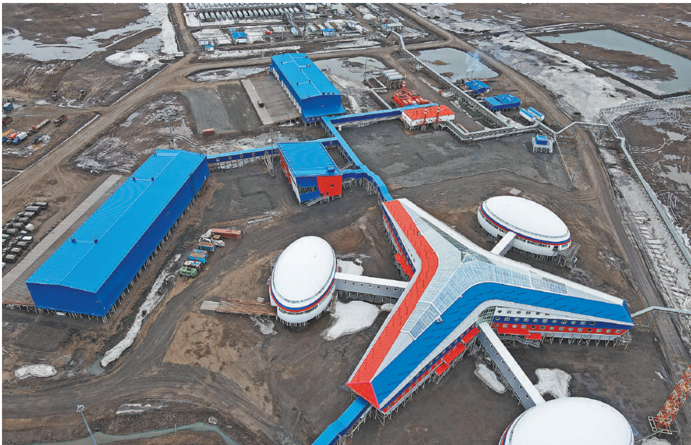
«Арктический трилистник»: комплекс замкнутого цикла. 700 км до Северного полюса. На такой широте еще никто и никогда не строил ничего подобного.