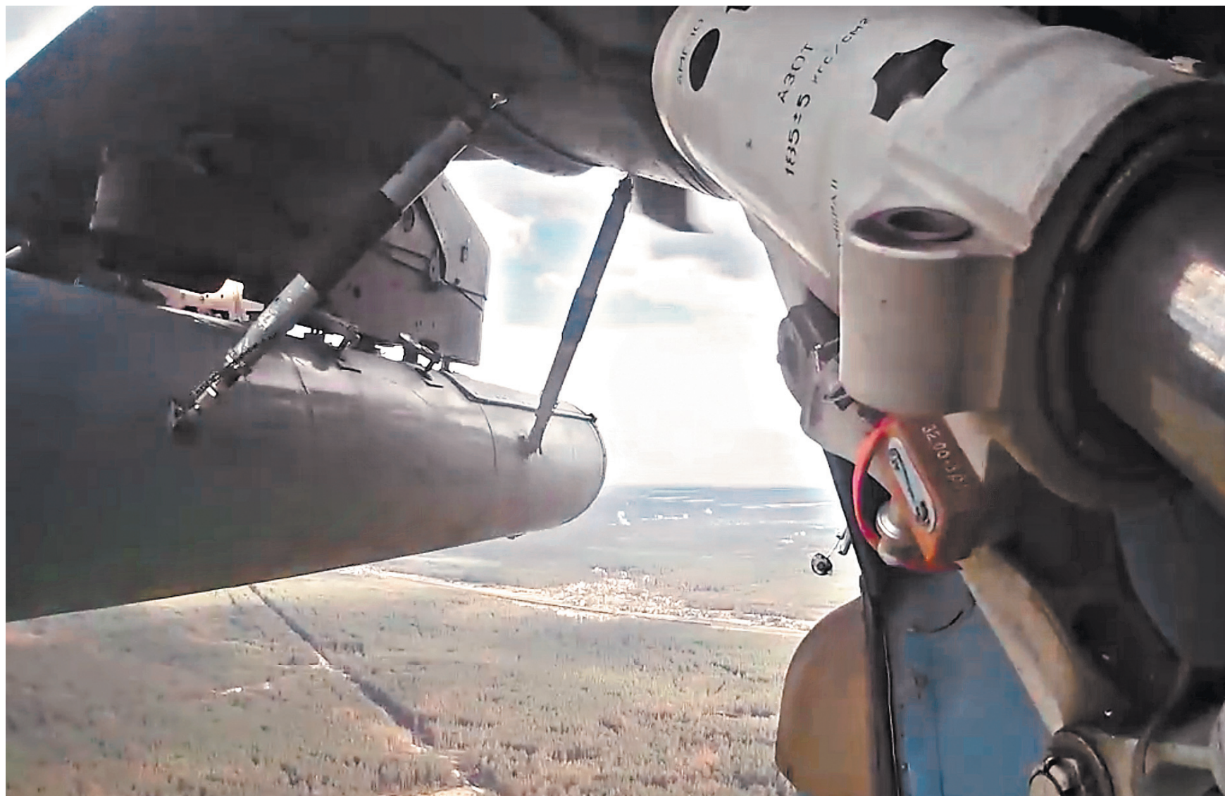
Российская авиация, наши ракетные войска и артиллерия нанесли удары по огненным позициям 64 артоподразделений ВСУ, а также живой силе и военной технике противника в 156 районах.