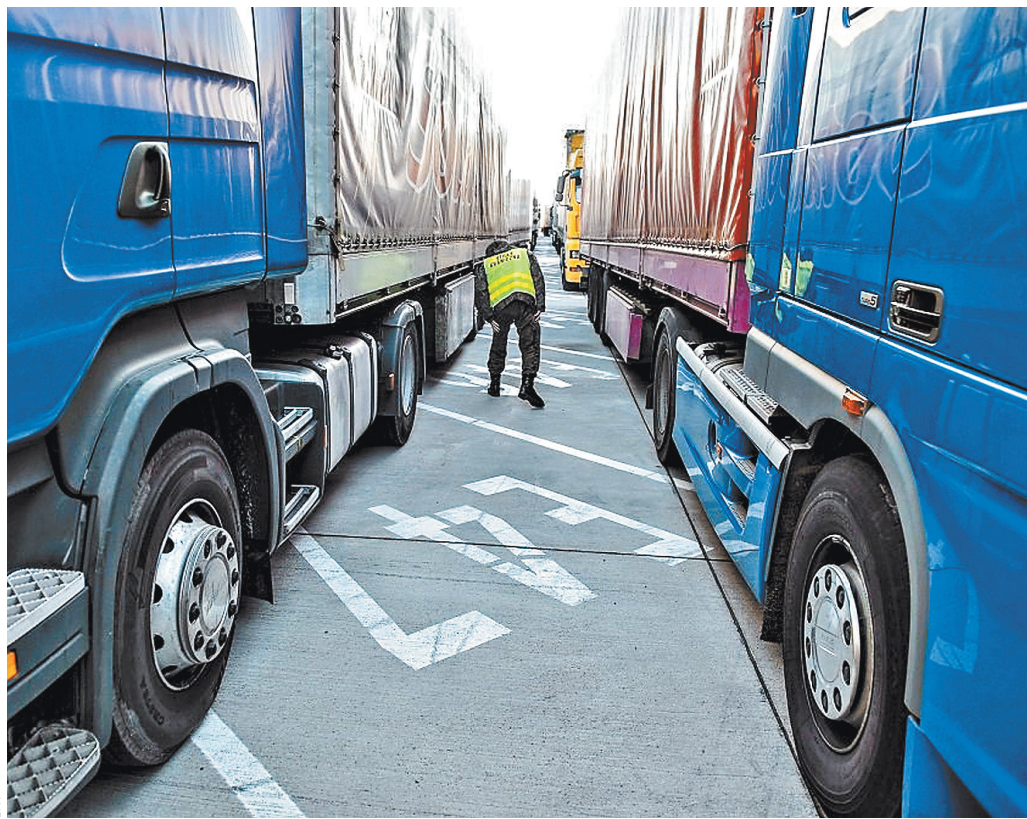
Перегружать товары можно на складах временного хранения и в зонах таможенного контроля.

С 10 октября грузовики из Евросоюза, Великобритании, Норвегии и Украины за рядом исключений не могут заезжать на территорию России. Чтобы доставить товар, им нужно перед границей передать грузы российским перевозчикам. При этом есть список из 58 категорий товаров, которые европейские фуры по-прежнему могут ввозить в Россию. Среди товаров — скоропортящиеся продукты, табак, бытовая химия, ядерные реакторы. Собеседники «РГ» отмечают, что им не до конца ясны критерии, по которым те или иные товары попадают в этот перечень.