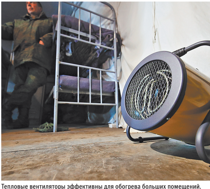
Тепловые вентиляторы эффективны для обогрева больших помещений.

В минпромторге признают, что повышению пошлин поспособствует увеличению доли отечественных производителей на рынке. Производители предполагают вынести инициативу на обсуждение в подкомиссию по таможенно-тарифному и нетарифному регулированию при минэкономразвития. ●