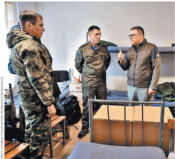
Время встреч губернатора с мобилизованными южноуральцами становится понятнее, какие потребности в амуниции и одежде они испытывают.

Сегодня в регионе расширяется производство бронезащиты. В ближайшее время, обещают хозяйственники, будет освоен пошив специальных жилетов-разгрузок, востребованных участниками СВО. Фирма в одном из небольших городов области, которая специализировалась на трикотаже, выполняет крупный заказ на изготовление спальных мешков, хотя ранее никогда подобными изделиями не занималась. Для этого, говорит на предприятии, будет задействован весь трудовой коллектив. Дополнительный набор сотрудников объявила швейная фабрика в городе автомобильностроителей Миассе, поставляющая армии рейдовые рюкзаки,