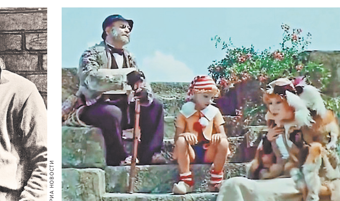
Кажется, нет такого человека, кто не смотрел «Приключения Буратино», где Ролан Быков сыграл кота Базилио.

— Читайте также: Съемки большого кино в маленьком городе: Частые или катастрофы? rg.ru/art/2416953