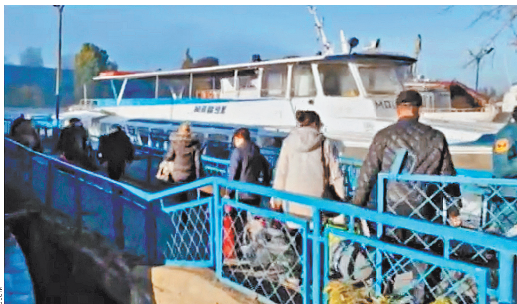
Власти Херсонской области решили вывезти граждан из-за опасности подтопления и усилившихся обстрелов ВСУ.

В свою очередь, в Запорожской области причина для эвакуации жителей на данный момент нет. Об этом сообщил в среду председатель движения «Мы вместе с Россией» Владимир Рогов. При этом он уточнил, что у властей Запорожской области есть план на случай обострения обстановки на линии боевого соприкосновения и власти готовы к любым сценариям. ●