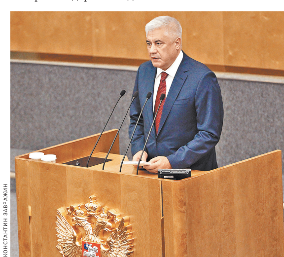
Глава МВД России Владимир Колокольцев сообщил, что для новых территорий страны нужны 52 тысячи полицейских.

По его словам, такое решение связано с востребованностью указанных специалистов в штате министерства. Полиция применяет дроны, в частности, для контроля за дорожным движением. ●