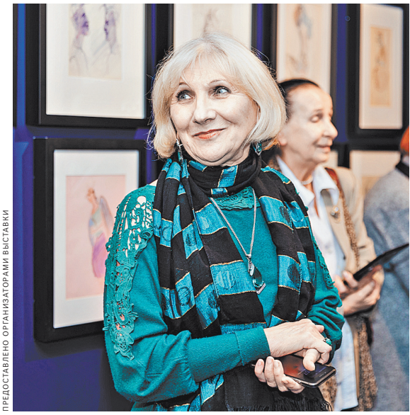
Графическое наследие Александра Лабаса 1960–1970-х годов впервые показывается в Петербурге.

Для Лабаса поиск художника тесно связан с размышлениями о природе вещей. «Я хочу разобраться, что снаружи и что внутри, в самом глубоком смысле: в природе и философии, в искусстве. Внутренние процессы, внутренняя динамика, внутренний ритм: все, о чем я говорю, — это невидимо, но оно существует», — напишет он однажды.