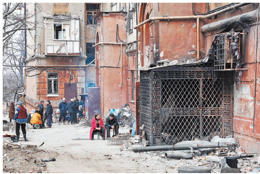
Приготовить еду жители разрушенных домов в Мариуполе могут на кострах, а вот зарядить телефон им негде.

Когда готовилась публикация, появилась информация о том, что «Молодая Гвардия Единой России» и «Волонтерская рота» создали сайт по поиску пропавших без вести людей в Мариуполе. За первые сутки работы ресурса поступило более 1500 заявок. В заявке нужно указать телефон родственника для обратной связи, фамилию, имя, отчество пропавшего, дату его рождения, место жительства и возможного места нахождения, дату последнего контакта с ним и его фотографию.