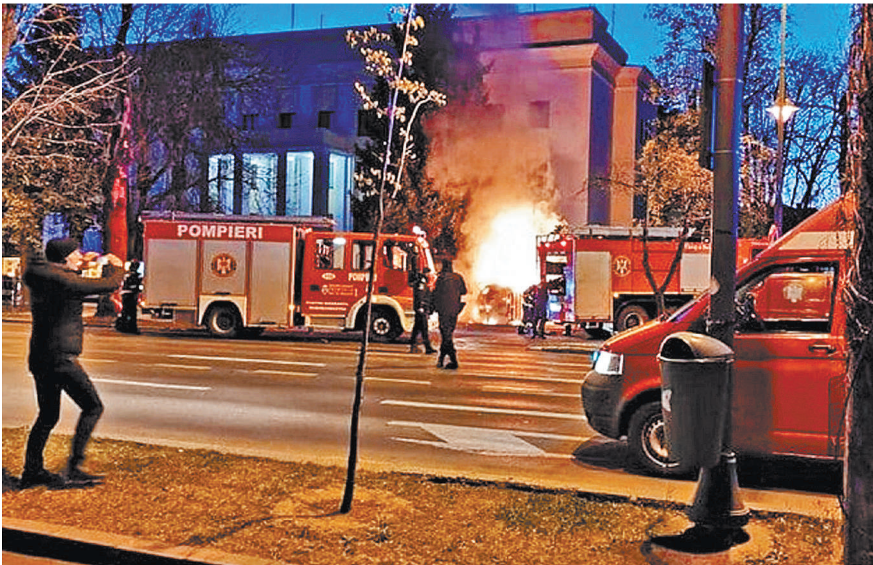
Посольство России в Румынии подверглось нападению: мужчина пытался протаранить ворота дипмиссии. Машина загорелась, водитель погиб. Как сообщает ТАСС, в посольстве охоран-терризовали инцидент как попытку теракта, осуществленную на фоне всплеска русофобии после украинской провокации в Буче. Посол РФ в Румынии Валерий Кузьмин пояснил, что полицейские хотели извлечь водителя из машины, но тот преднамеренно поджог бензин и погиб в огне. По словам Кузьмина, ранее в посольство уже поступали угрозы.

В Токио также не в восторге от таких громких акций западников и намерены всячески уклоняться от присоединения к ним. «Пока не слышал об этом. Возможно, обсуждение данной темы будет», — на условиях анонимности осторожно прокомментировал ситуацию в беседе с журналистом газеты «Санкэй симбун» высокопоставленный представитель МИД Японии. В Токио считают, что обмен взаимными высылками дипломатов негативно скажется на способности японского посольства в Москве качественно выполнять возложенные на диппредставительство функции, в частности, по оказанию консульской поддержки японских граждан на территории РФ, особенно в экстренных случаях. Объявление иностранных дипломатов персонами non grata и вовсе оказалось не в традициях Страны восходящего солнца. За всю историю дипотношений между Токио и Москвой японское правительство ни разу не объявляло кого-либо из российских дипломатов «нежелательной персоной».