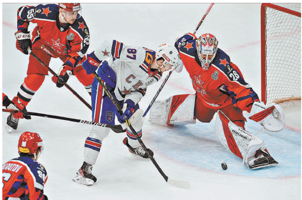
В третьем матче серии ЦСКА — СКА опасных моментов хватало у ворот обеих команд.

Напомним, противостояние началось с победы «Металлурга» — 3:2. Второй матч получился еще более результативным. Хотя стартовый безголевой период феерии не предвещал. Но соперники раззабивались, набрав в совокупности десять шайб. А победили «Трактор» — 6:4. Челябинцы наконец раскрыли свой атакующий потенциал, правда, и пропустили больше трех шайб впервые в текущем розыгрыше Кубка Гагарина. В третьем периоде гости вели 5:2, но из-за ненужных удалений позволили магнитогорцам приблизиться на минимальное расстояние — 5:4, но все же победу удержали. ●