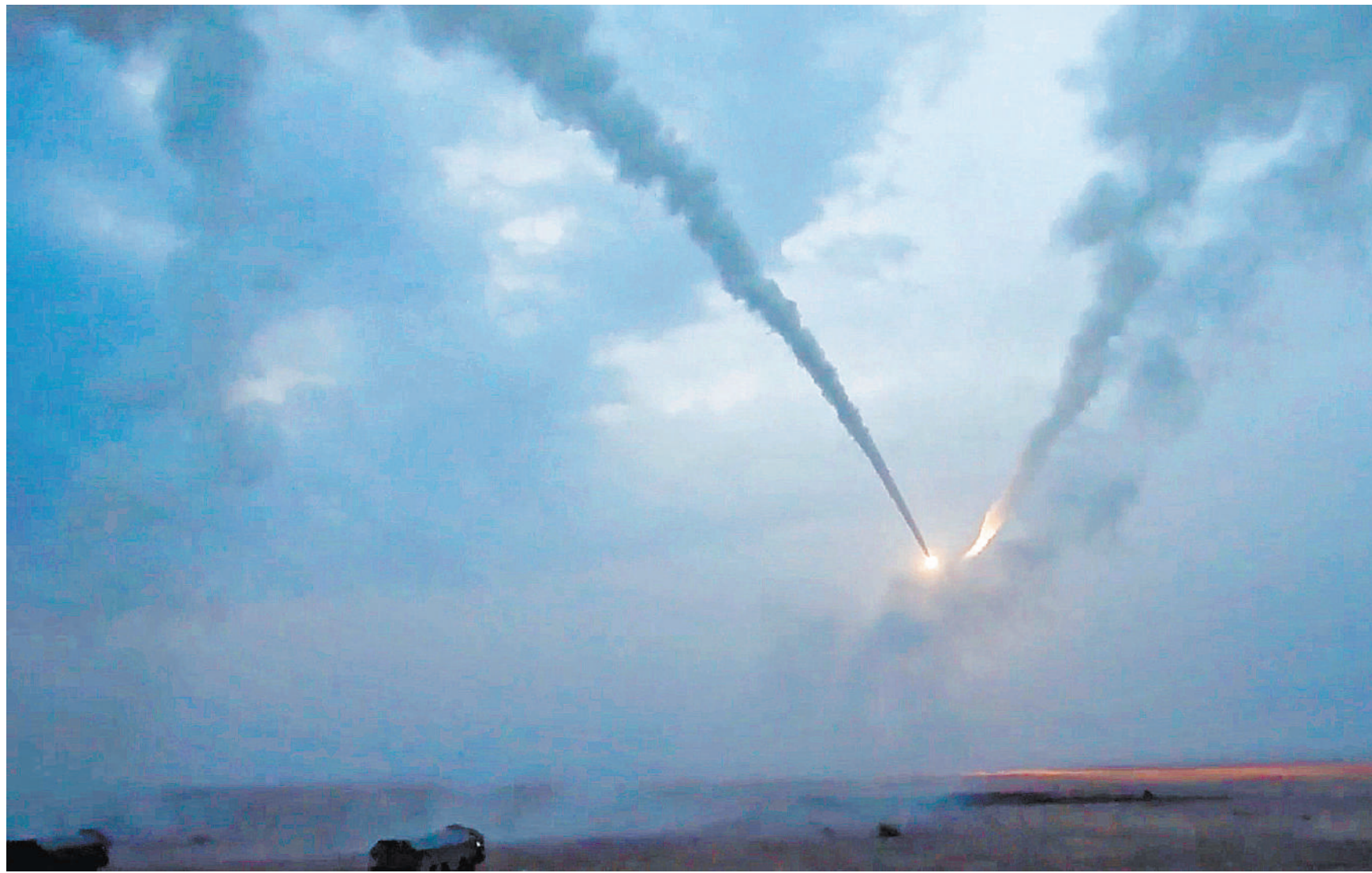
Практически каждый день Минобороны России сообщает о нанесении ударов высокоточными ракетами по военным объектам Украины. Для этого в том числе применяют комплексы «Бастيون».