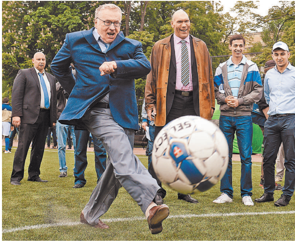
Май 2013 г. Лидер ЛДПР во время футбольного турнира между командами фракций Госдумы на стадионе «Лужники».