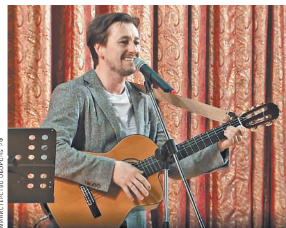
Сергей Безруков: Когда я выхожу и говорю: «Я люблю Родину», — зал взрывается аплодисментами.