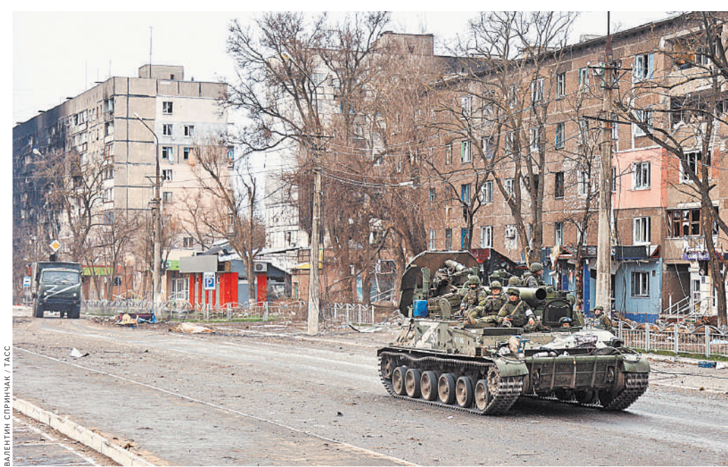
Минометы особой мощности 2С4 «Тюльпан» в Мариуполе.

Миномет установлен на высокопроходимом гусеничном шасси, имеет противопульную бронезащиту. Скорострельность — один выстрел в минуту. ●