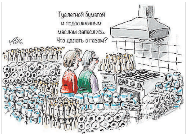
2022 год: Der Spiegel грустно шутит над привычкой немцев создавать запасы в трудные времена. А они, по мнению издания, уже наступают для жителей Германии, особенно если страна сократит поставки газа из России. И тогда даже создавшим запасы немцам придется не сладко — ведь их товарные накопления рано или поздно закончатся.