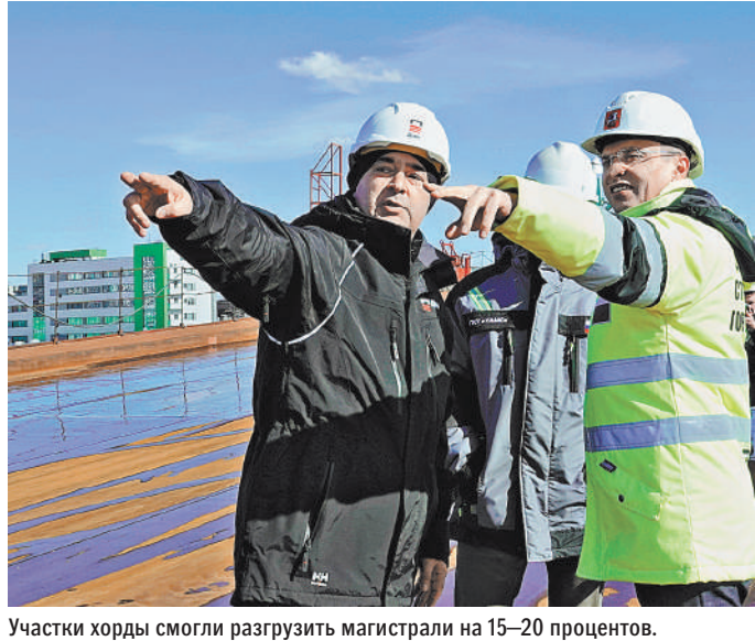
Участки хорды смогли разгрузить магистрали на 15–20 процентов.

Кстати, Северо-Восточную и Юго-Восточную хорды решено объединить в один проект и сделать первую сквозную магистраль — московский скоростной диаметр (МСД). Трасса пройдет от Симферопольского шоссе до магистрали на Санкт-Петербург, минуя центр. Проехать через город по бесветерфорной трассе можно будет всего за 40 минут. ●