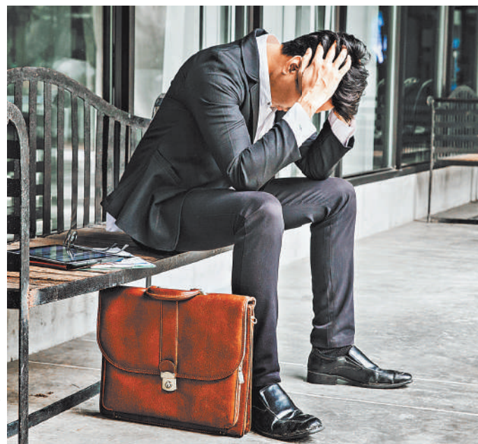
Теперь суды знают, как защитить человека, которого уволило начальство.

Тогда она по почте отправила письмо руководителю своей ор-