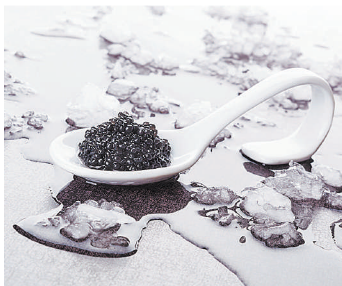
ЕС планирует запретить ввоз черной икры из России. Красная же икра в Европе непопулярна.

Сначала будут выпускать по 500 тысяч упаковок «Л-Тироксина» в месяц, а потом по одному миллиону