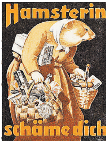
1942 год: «Хомьичка, позор тебе», — с помощью таких агиток в нацистской Германии ругали чрезмерно заправивших немцев, уже предчувствовавших приход Красной армии.