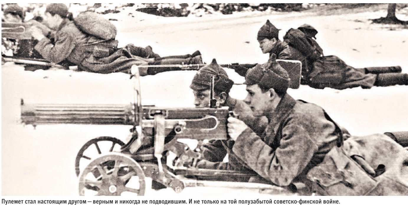
Пулемет стал настоящим другом — верным и никогда не подводившим. И не только на той полузабытой советско-финской войне.

то его усилие достаточно, чтобы одолеть врага. Сражались храбро. Уверенно продвигались вперед в Заполярье. Ринулись на Карельский перешеек. Нанесли там первый удар, продвинулись с боями немного вперед. И уткнулись в полосу укреплений. Известна она теперь как линия Маннергейма. Сам бывший царский генерал, ставший в годы Великой Отечественной гитлеровским холоумом и мечтательным превратиться в палача блокадного Ленинграда, в мемуарах утверждал, будто и линии особой не было. Вранье. Построили оборонные полосы. Часть из них — бетонные. Ощетинились колючей проволокой. Вгрызлись в землю огневые точки. Между ними переходы. Противотанковые рвы не давали возможности использовать нашу технику. Из дотов и дзотов наступавших поливали прицельным огнем. А наши на первых порах шли вперед крупными силами и, как правило, отбросив хитрости, атаковали прямо в лоб. Финны сражались крепко, рук почти никогда не поднимали, за всю войну взяли наши всего около тысячи пленных.