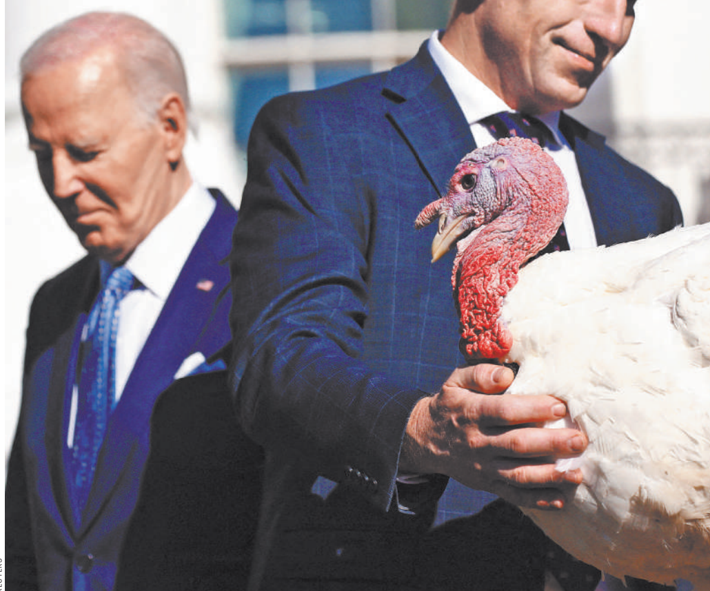
Байдено под праздники так хотелось выглядеть «спасителем», что помилования двух индюшек ему было мало...

смогут, а записанное — обязательные «мантры», чтобы временно успокоить израильское общество. Но в принятом соглашении о прекращении огня есть как минимум два пункта, развязывающих Нетаньяху руки в будущем. Возможно, их появление стало причиной, почему документ все же был принят Тель-Авивом. Первый пункт фиксирует «переходный период» для реализации мирных договоренностей — два месяца. То есть Нетаньяху получает отсрочку до момента смены власти в Белом доме и прихода туда Дональда Трампа. А тот, как известно, заявлял о готовности пойти значительно дальше своего предшественника в военной поддержке Израиля. Второй пункт сохранил возможность сторон — Израиля и Ливана — на самозащиту в соответствии с международным правом. Иными словами, после возвращения Трампа в Белый дом Нетаньяху сможет возобновить боевые действия против Ливана, если посчитает, что тот не выполняет эти обязательства. А то, что эти обязательства в полной мере