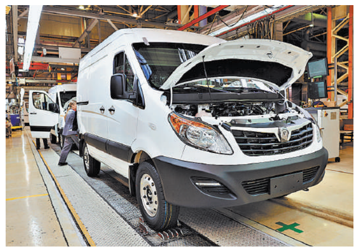
Гарантия на новые грузовые автомобили составляет четыре года.

Грузовые автомобили семейства Sollers TR предназначены для различных видов транспортной работы. Базовая комплектация их кабин включает кресло водителя с электроподогревом и пневмоподвеской, регулировку рулевого колеса в двух направлениях, кондиционер, подогрев боковых зеркал, предпусковой подогреватель. А еще — круиз-контроль и мультимедиа-систему с цветным сенсорным дисплеем, управлением на руле и выводом изображения с камеры заднего вида. Гарантия на грузовые автомобили Sollers составляет четыре года, или 250 тысяч километров, включая два года заводской гарантии и два года сервисной поддержки от дилера. ●