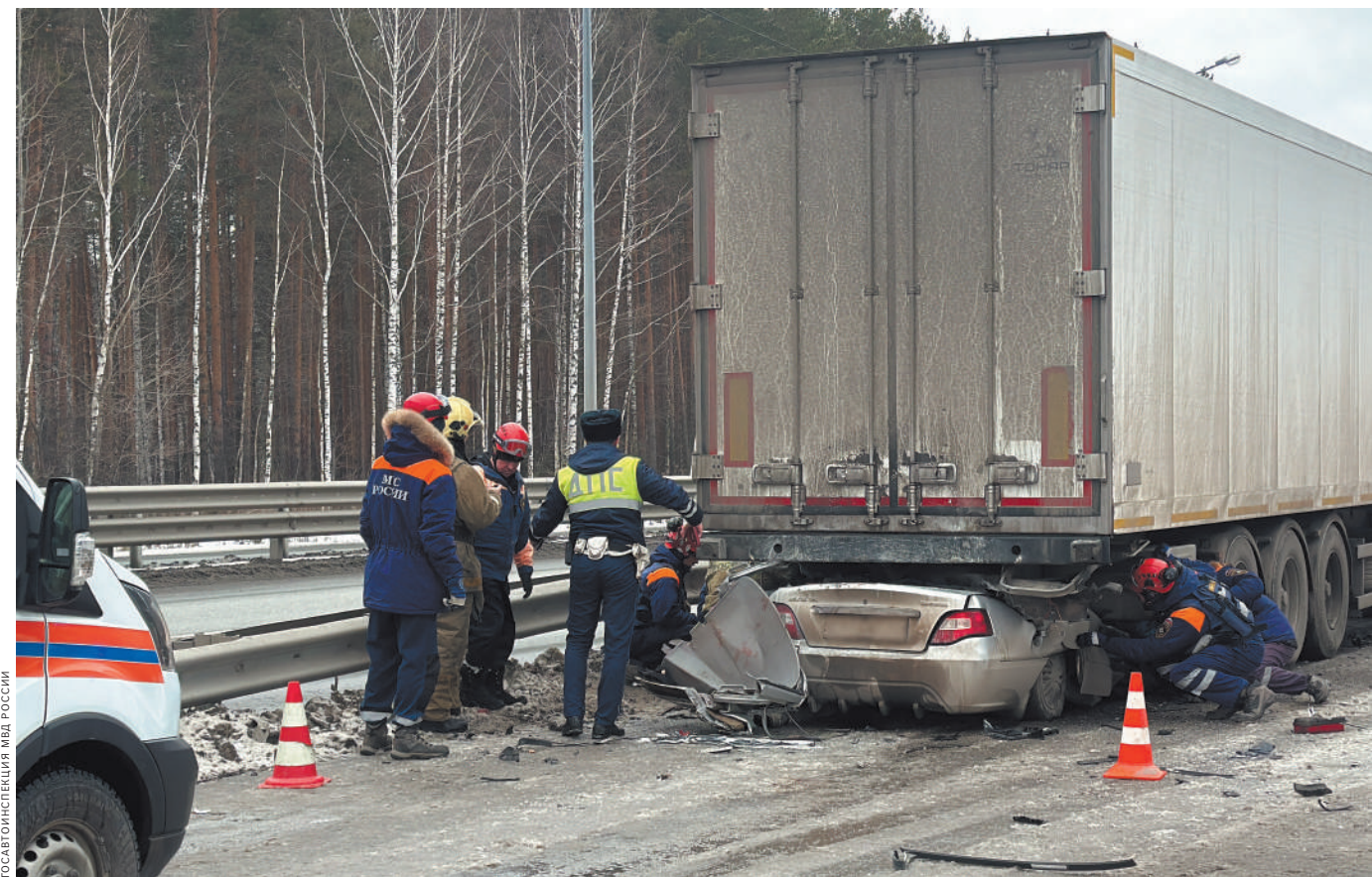
Неправильный выбор дистанции, а также превышение скорости приводят к таким последствиям.

Материал подготовлен в рамках реализации федерального проекта «Безопасность дорожного движения» национальной программы «Безопасные качественные дороги».