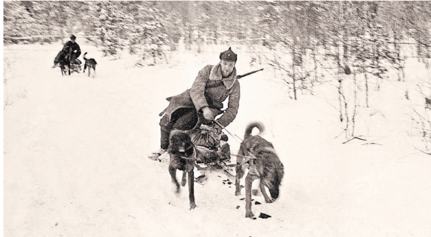
Кто мог предположить, что в этой войне красноармейцам в легоньких буденовках придется использовать на Карельском перешейке собачьи упряжки.

Вся тяжесть битвы пала на плечи бойцов Ленинградского военного округа. Считали, буд-