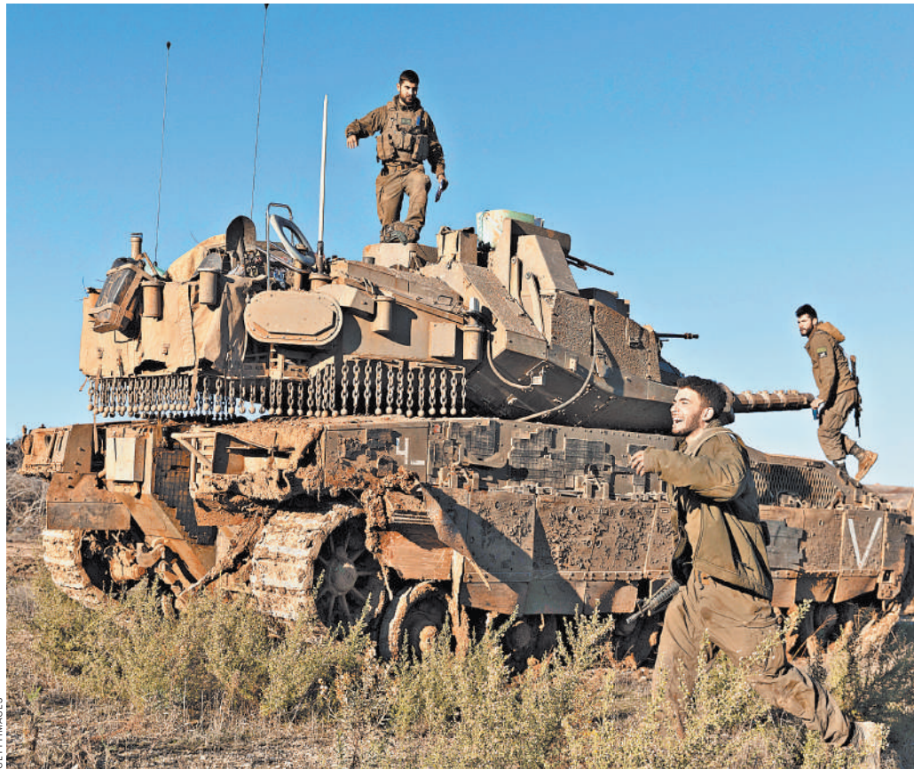
...ради этого глава Белого дома потребовал от Израиля вывести войска с ливанской территории. Надолго ли?

Нынешний израильско-ливанский «мир» был необходим американской администрации, чтобы увеличить помощь Украине, скрывая под благовидным предлогом аналогичную поддержку оружием и деньгами Тель-Авива. Реальные причины противостояния на Ближнем Востоке, связанные с нерешенным палестинским вопросом, о чем неоднократно говорили официальные лица в России, нынешнее перемирие не устранило. А потому «заморозка» боевых действий израильской армии в Ливане и, возможно, на короткий период в секторе Газа — лишь попытка Нетаньяху переждать смену команды в Белом доме. В Вашингтоне же смазат как называемый внешнеполитический успех Байдена на Ближнем Востоке последние представители команды