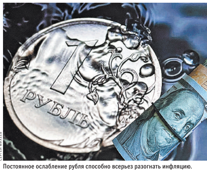
Постоянное ослабление рубля способно всерьез разогнать инфляцию.