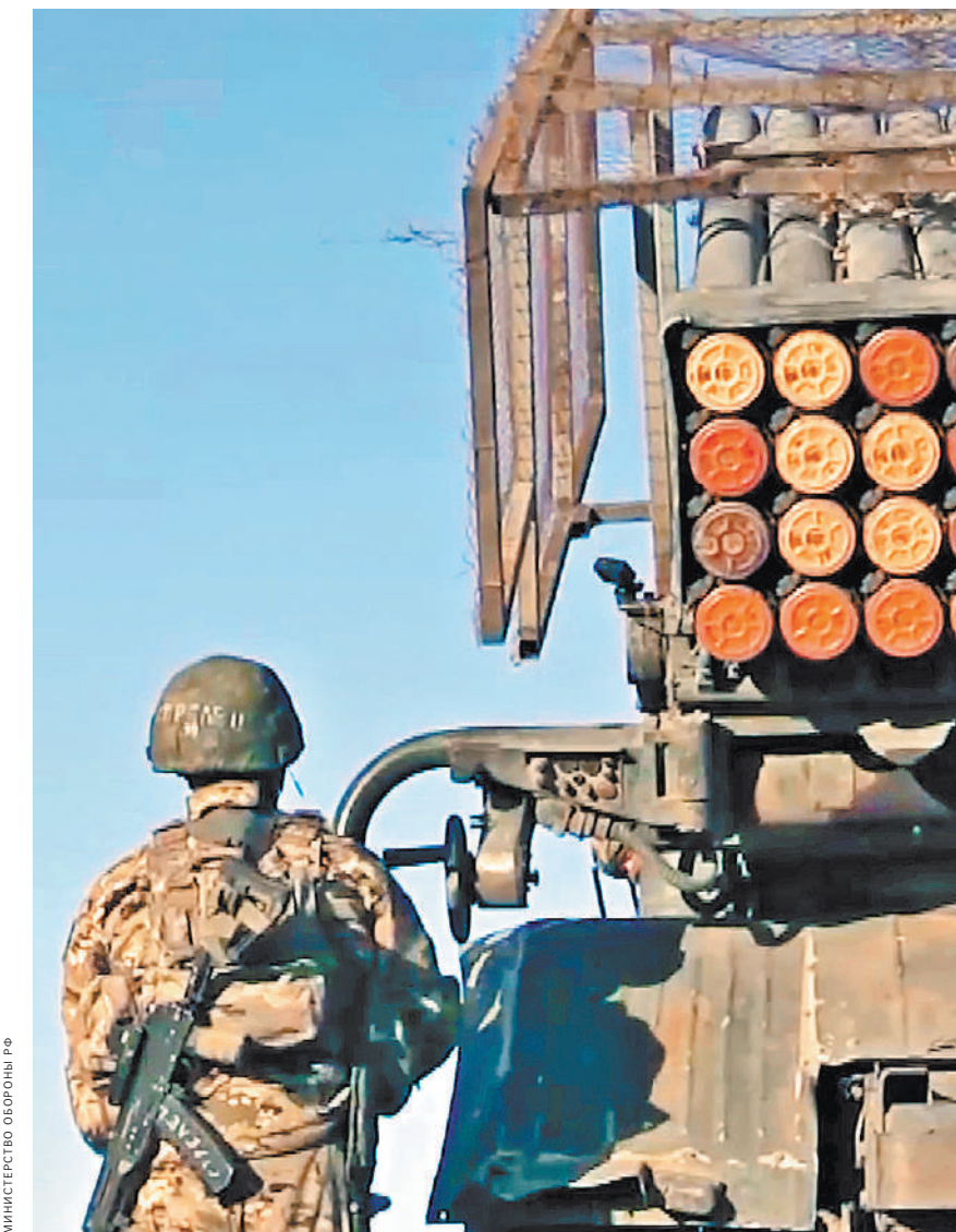
Артиллеристы морской пехоты Тихоокеанского флота и днем, и ночью наносят удары реактивными ракетами «Град» по позициям украинской армии.