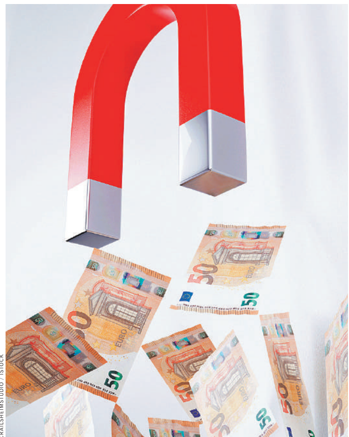
«Магнетизм» полученных от киевских коррупционеров обещаний притянул очередные миллиарды евро из Брюсселя. Там еще надеются, что Украина будет бороться с коррупцией.