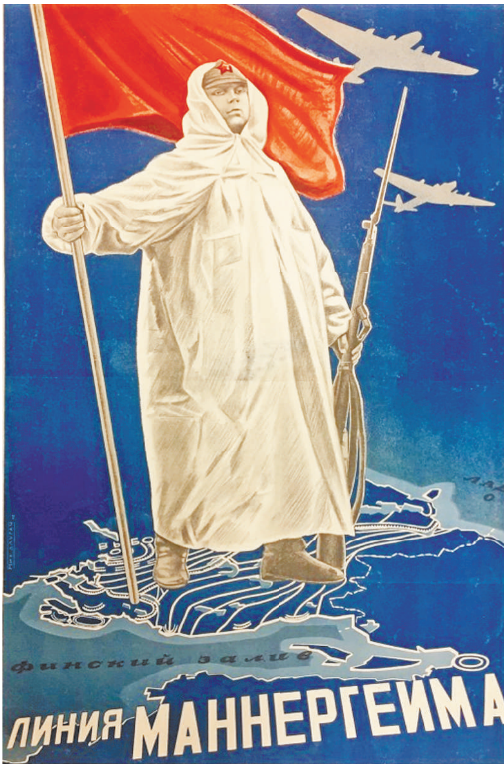
Первый вал наших атак захлебнулся на линии Маннергейма. Потом мы стали умнее, хитрее: ударов артиллерии, танкового штурма и русской лихости финны не выдержали.