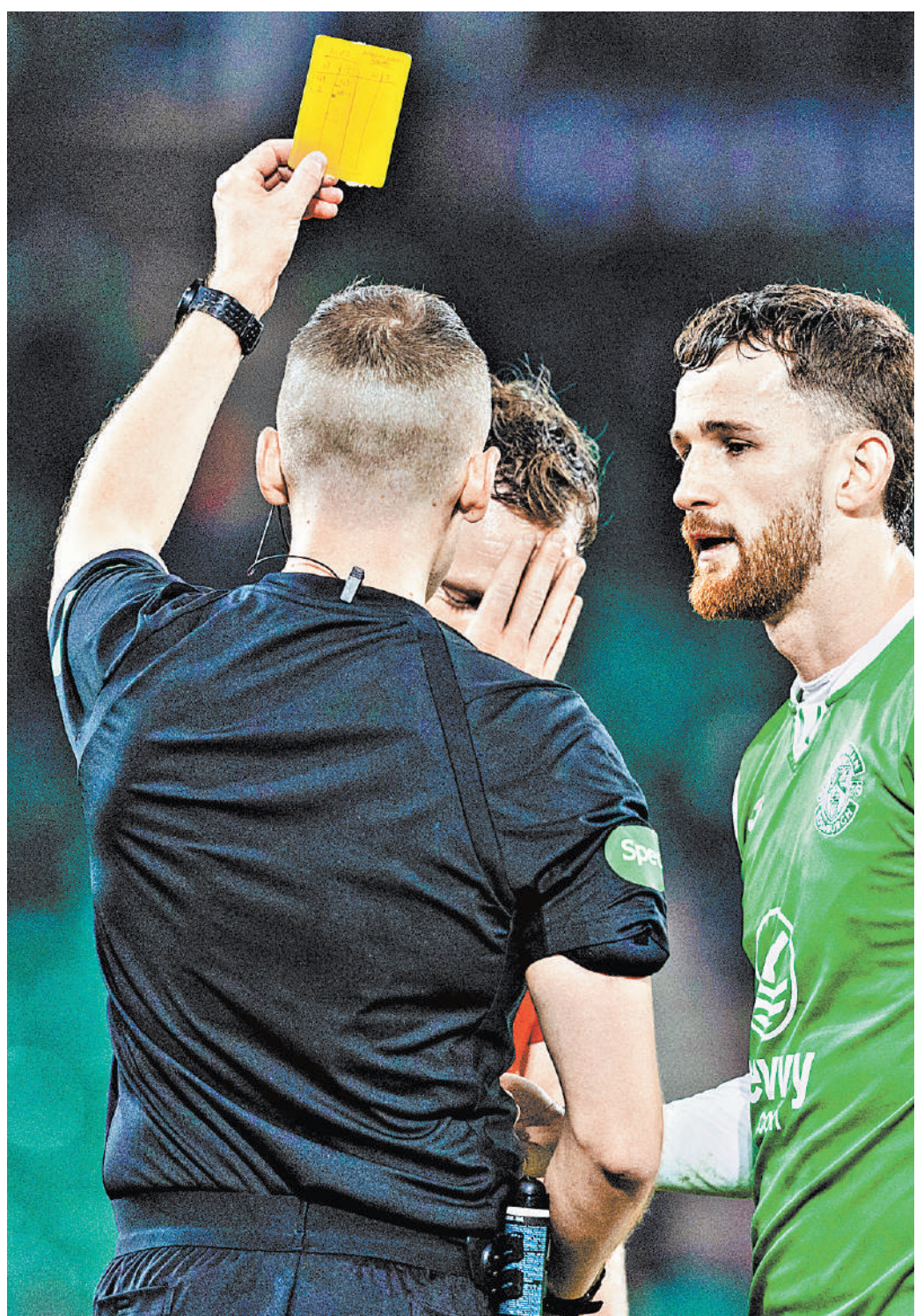
По словам самарского губернатора, в судебном корпусе есть преступники, замешанные в коррупции.

просьбой выделить 36 миллионов рублей на покрытие долга «неназванным преступникам, которые занимаются коррупцией в судебном корпусе российского футбола». Об этом Федорищев рассказал на заседании комиссии Госсовета по направлению «Физическая культура и спорт», в ко-