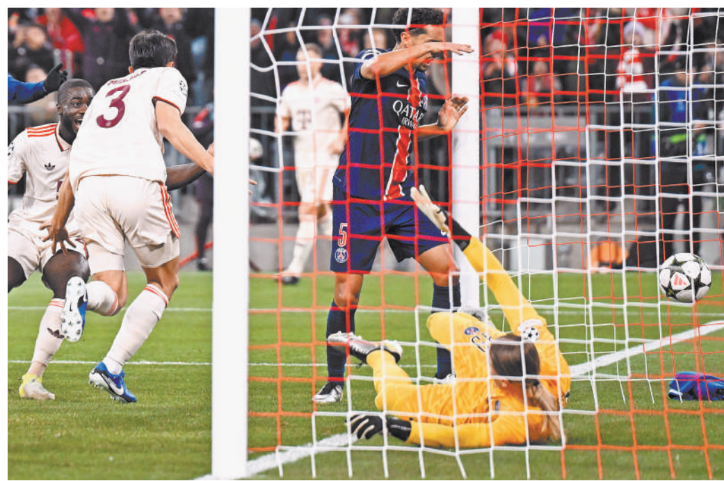
Матвей Сафонов упустил мяч из рук и позволил «Баварии» забить единственный гол в матче.

— Лига чемпионов-2024/2025: все новости на сайте rg.ru/sujet/6916