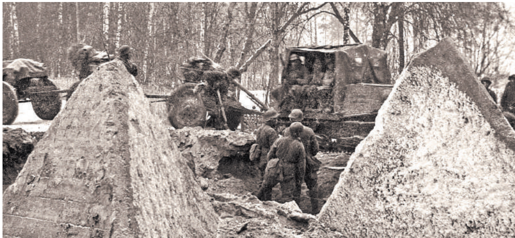
Сложно было взять город Терийоки, весь опутанный противотанковыми инженерными заграждениями. Но взяли, и с тех пор он именуется Зеленогорском.