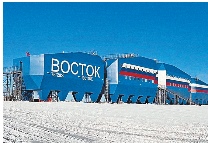
В летнее время в новом комплексе смогут жить и работать 35 полярников. Во время зимовки — до 15.

Внутри все стильно, ярко, оформлено в синем и горчичном цветах. Жилые комнаты небольшие, но очень уютные, со всем необходимым. Мягкие кожаные диваны в уют-компа-