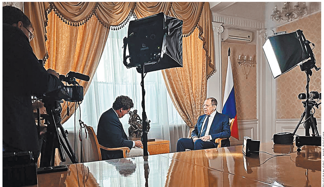
Такер Карлсон прибыл в Москву, чтобы взять интервью, как он подчеркнул, у «самого опытного министра иностранных дел в мире».

Журналист также обратил внимание на свои попытки осветить украинский конфликт с разных сторон, после интервью с президентом РФ Владимиром Путиным в феврале 2024 года он пытался побеседовать и с Владимиром Зеленским. «Мы постоянно обсуждали это, но этим усилиям мешало правительство США. Американское посольство в Киеве, на которое уходит деньги наших налогоплательщиков, заявило правительству Зеленского: «Вы не можете давать интервью», — указал Карлсон. По его словам, из-за того, как преподносят информацию американские СМИ, жители США не обладают полным видением ситуации, сложившейся на международной арене. ●