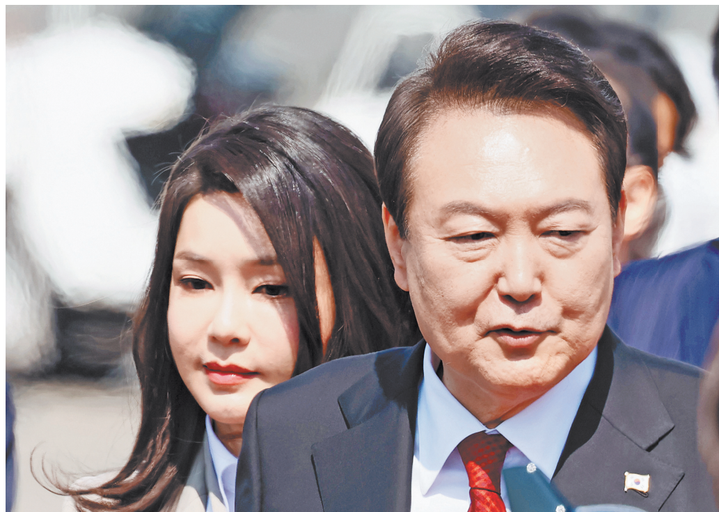
Президент Юн Сок Ёль и его жена Ким Кон Хи, которая, как считают эксперты, стала слишком сильно влиять на мужа и вмешиваться в политическую жизнь.

Однозначно можно сказать, что будет подробно расследование всех обстоятельств и действий участников ночных событий. Тут уже стали высказывать опасения, что в итоге попытаются наказать «стрелочников» — офицеров армии и полиции. Есть вопросы и к действиям ряда депутатов от правящей партии. Ее лидер Хан Дон Хун и его соратники — всего 18 депутатов — осудили военное положение и поддержали резолюцию о прекращении военного положения, а вот где были остальные — большой вопрос.