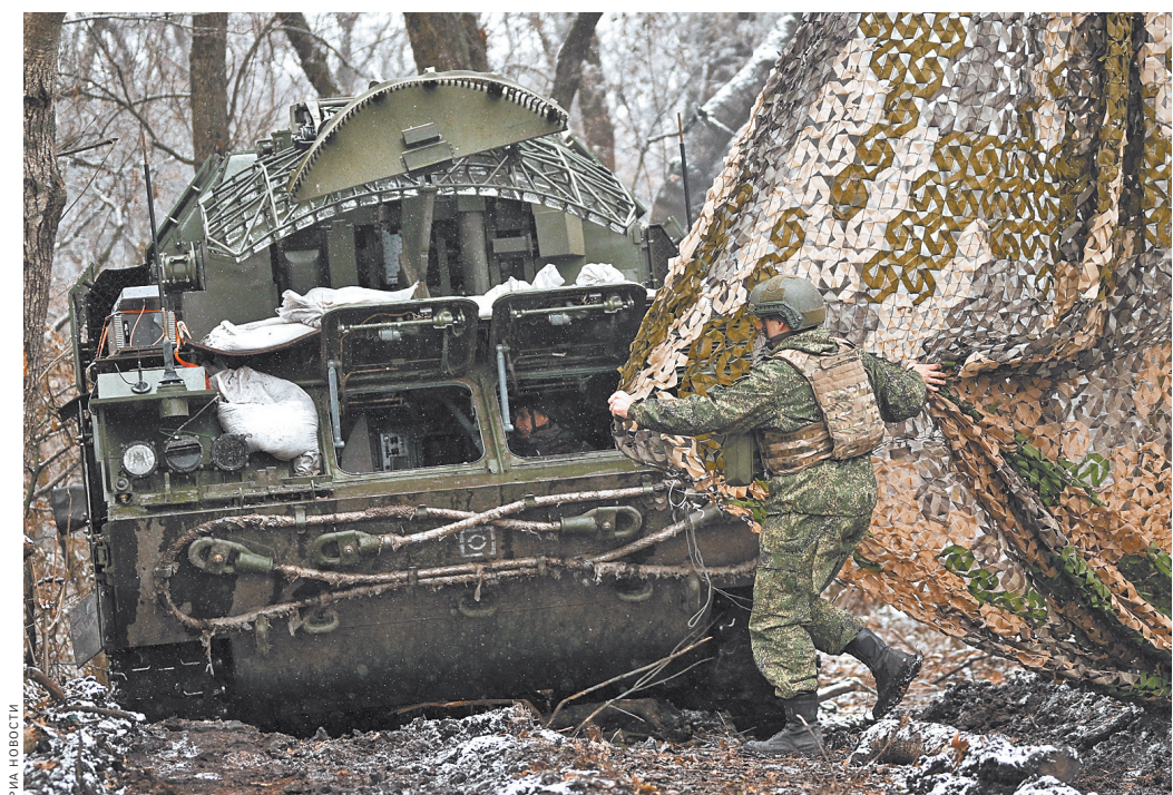
Комплекс «Тор-М» уничтожает беспилотники и ракеты ВСУ в зоне СВО. Благодаря своей скорости и маневренности он может осуществлять пуски ракет в движении, с ходу и с коротких остановок.

За ходом спецоперации следите на сайте rg.ru/sujet/donbass