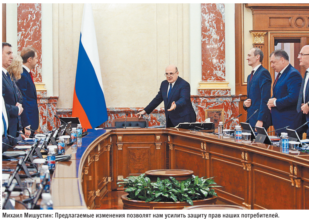
Михаил Мишустин: Предлагаемые изменения позволят нам усилить защиту прав наших потребителей.

Еще свыше 500 млн рублей правительство направит в программу льготных инвестиционных займов, которые получают организации агропромышленного комплекса в 12 регионах страны. «Рассчитываем, что принятое решение позволит своевременно завершить начатые работы, а новые объекты агропромышленного комплекса предоставят еще более широкий выбор качественных продуктов отечественного производства», — сказал Мишустин. ●