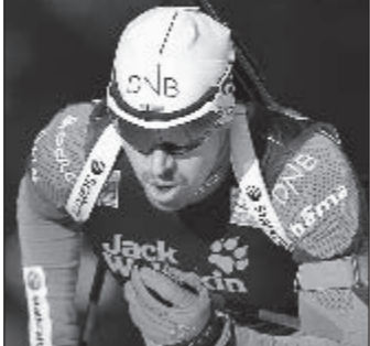
В гонке отдавать все, что у меня есть. Да, начало сезона для мужской сборной Норвегии получилось не самым простым. Но я надеюсь, что мы идем в правильном направлении. И сможем радовать болельщиков и дальше.