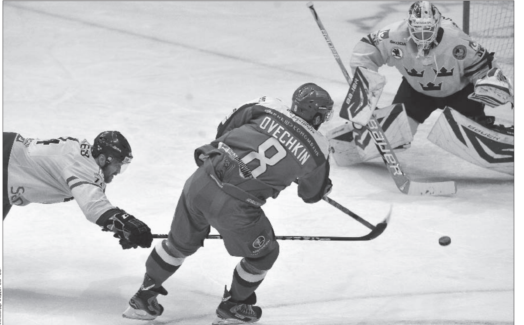
Вчера. Москва. Дворец спорта «Мегаспорт». Швеция - Россия - 1:5. Александр ОВЕЧКИН забивает очередной гол россиянам в ворота Андерса ЛИНДБАКА.

Но это не значит, что мы не вправе набивать мозоли, аплодируя нашим ребятам, так ведь?