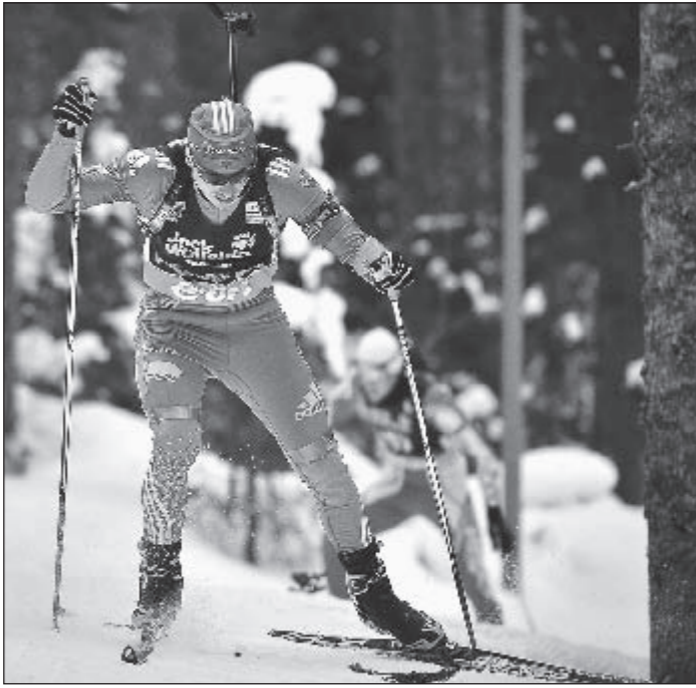
Вчера, Поклюка. Евгений УСТЮГОВ занял 7-е место, но стал лучшим из россиян - и вышел на лихую позицию в общем зачете Кубка мира.

Жить в одной гостинице со спортсменами журналисту достаточно непривычно. С одной стороны, это облегчает жизнь - можно договориться об интервью прямо в холле после ужина, а не мучить биатлонистов сразу по окончании гонки на холодном стадионе. К тому же благодаря такому соседству начинаешь подробнее изучать повадки героев своих материалов. Взять, например, великого Оле Эйна-