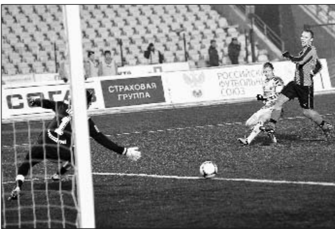
26 ноября. Пермь. «Амкар» - «Анжи» - 1:2. Глава комиссии по выявлению договорных матчей Анзор КАВАЗАШВИЛИ (на фото слева) считает, что в победном голе...

Но вот для комиссии по договорным матчам вышеизложенное сигналом не стало. Ну, ходят по котормам бывшие футболисты, с жиру бесятся. Хорошо им, значит, живется в Перми, - что тут «сигнального»?