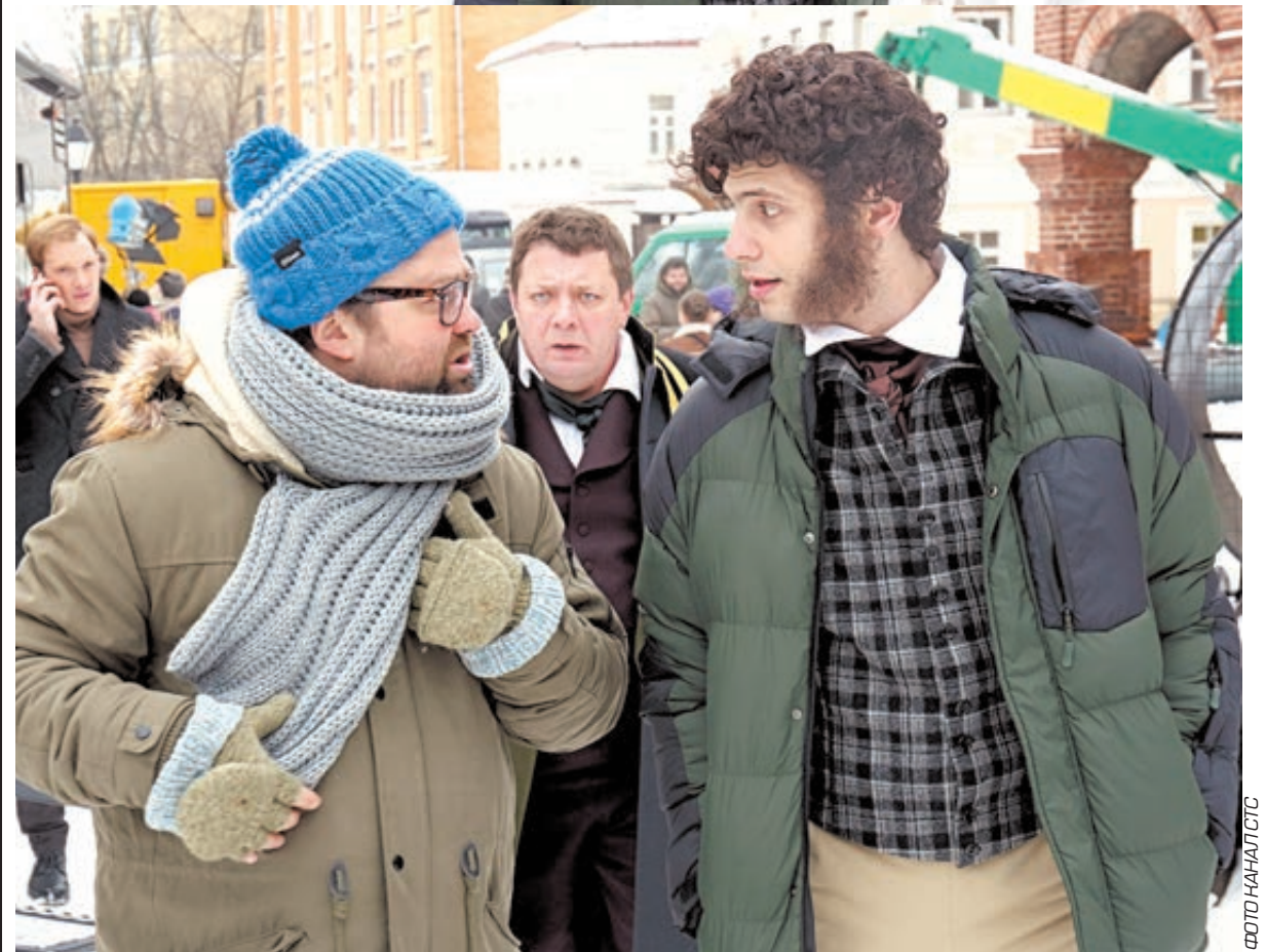
Эпизоды фильма «Пушкин».

— Пушкина в образе нарушителя установленного порядка можно увидеть в ваших «Бунтарях»... Как вообще у вас хватало смелости предложить постановку спектакля на сцене МХТ? Это от молодого нахальства?