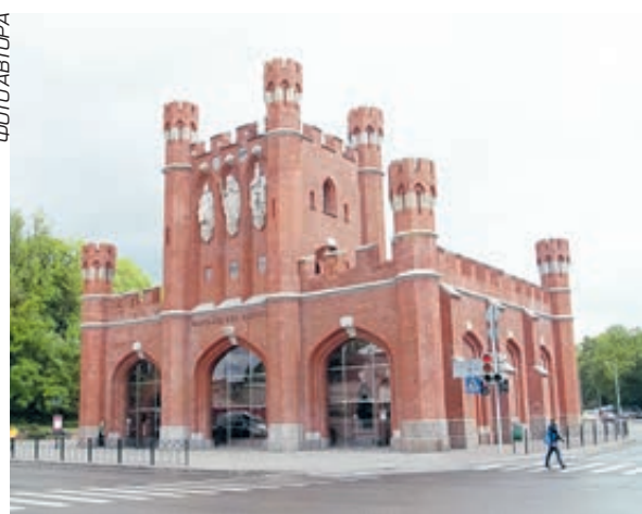
2004 год. Королевские ворота накануне реставрации. А так они выглядят сегодня.

Эти знаменитые не только в России ворота, и в котором не зарастает туристическая тропа, несколько раз меняли свое название. Первоначально они назывались Гумбиненскими, в 1811 году были переименованы в Королевские (именно через них прусские короли выезжали на воинские учения и смотря). А в 1843-м прошла их полная реконструкция: первый камень был заложен в присутствии Фридриха Вильгельма IV. Поучаствовал король и в церемонии освящения одноименных ворот семь лет спустя... В советское послевоенное время ворота оказались заброшены, хоть и получили статус памятника. А в 1978-м над ними вообще нависла угроза демонтажа.