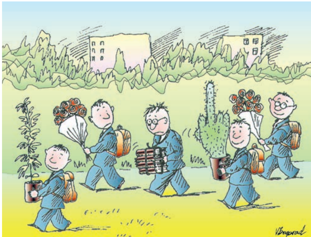
ИЛЛЮСТРАЦИЯ ВЯЧESЛАВА БОСОВА/СЕРГЕЙКОМАНЕНКО

В документе подчеркивается, что поводом для повышенного внимания к подростку может быть не только его прямая агрессия, но и низкая успеваемость, жизнь в неполной или неблагополучной семье, чувство глубокой социальной несправед-