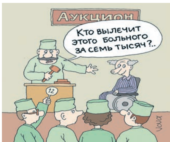
ИЛЛЮСТРАЦИЯ ВЛАДИМИРА НИВАНОВА / CARTOONBANK.RU

Как известно, взносы из нашей зарплаты идут в Фонд обязательного медицинского страхования, из которого и финансируется лечение в стационарах. Но эти медицинские услуги оказываются отнюдь не бесплатно. Как показал опрос ФОМСа, треть россиян во время посещения больницы доплачивали за лечение и препараты. А каждый шестой респондент признался, что ничего не знает о существовании перечня бес-