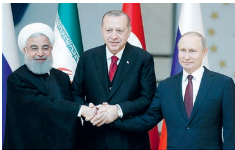
Символическое рукопожатие трех президентов.

Владимир Путин очень вовремя разыграл турецкий гамбит. Западные эксперты признают, что первый после выборов зарубежный вояж российского президента стал эффективным и результативным. Такие межгосударственные глобальные проекты, как «Турецкий поток» и АЭС в Мерсине, обрекают партнеров на сотрудничество как минимум в ближайшие полвека. Это не фруры с помидорами, которые можно в любой момент развернуть на границе.