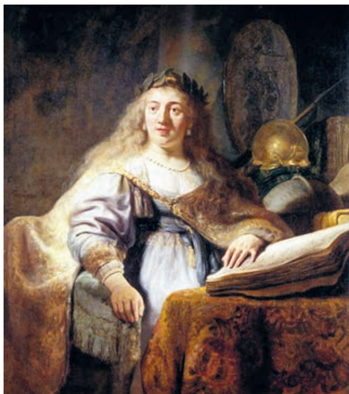
Картина Рембрандта «Минерва». 1635 год.

Москва случайно стала важной остановкой в мировом турне коллекции Томаса Каплана и его супруги, которые только в 2003 году купили первый портрет, а ныне владеют 250 произведениями голландских мастеров. В честь родного города Рембрандта, откуда родом и ряд других