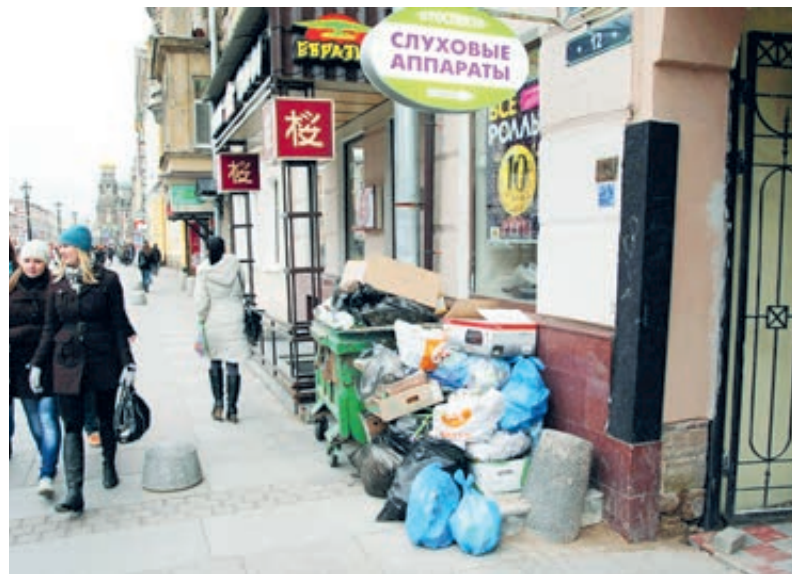
Такую картину все чаще можно видеть в центре Северной столицы,

Рутинное объявление на сайте администрации Выборгского района о публичных слушаниях «Внесение изменений в проект планировки с проектом межевания территории производственной зоны «Каменка» никого не обмануло. Народу в актовом зале набилось столько, что люди стояли в проходах, а представители Смольного в президиуме выглядели растерянно, на вопросы отвечали сбивчиво или вообще отмалчивались.