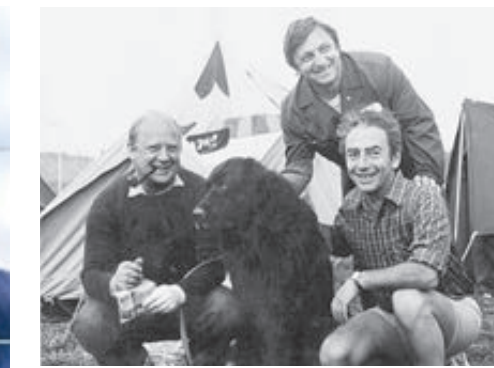
Александр Городницкий, Виктор Берковский и Юрий Визбор на Грушинском фестивале, 1977 год

Что было — то было. Увы, сейчас в нашем жанре кризис. Вроде площадок много, исполнителей хоть отбавляй. Но уже 40 лет председатель жюри самого крупного в мире фестиваля авторской песни имени Валерия Грушина и вижу, как постоянно уменьшалось число авторов. Ушла вся когорта первопроходцев: Окуджава, Галич, Высоцкий, мой друг Юрий Визбор, Новелла Матвеева. Пришедшие на смену вряд ли могут с ними сравниться. Пишут о всякой ерунде, не трогают ни ум, ни сердце.