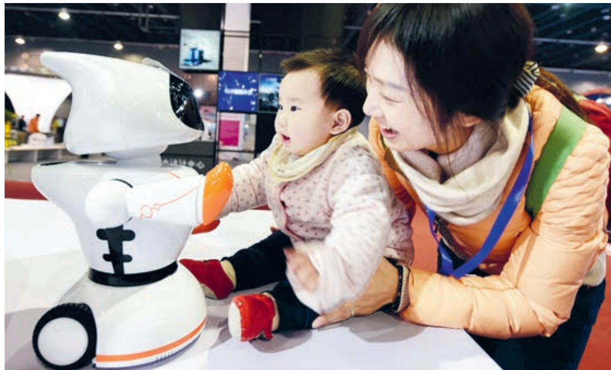
Роботы вошли в повседневную жизнь китайцев. Мать с сыном общаются с андроидом раннего обучения.

Китай открывает двери для инвестиций, развивает межгосудар-