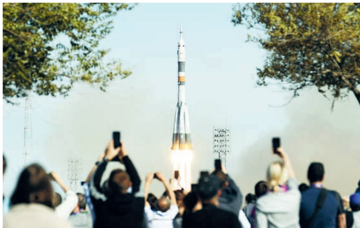
Запуск на Байконуре 11 октября: никто еще не знает, что случится через две минуты...

Вспоминаются две аварии 1996 года. 14 мая стартовала ракета «Союз-У» с военным спутником. В конце первой минуты полета произошел преждевременный сброс головного обтекателя, а чуть позже две ступени и спутник рухнули в море. Аварийная комиссия не сумела тогда выявить причины и представила начальству отписку. А через месяц – второй запуск с Плесецка опять – таки носителя «Союз-У». И снова на первой минуте сброшен головной обтекатель. Тут уж взялись за расследование всерьез и выявили – таки виновных в изготовлении некачественных замков крепления на самарском «ЦСКБ-Прогресс». Не хотелось бы повторения. Конечно, трех беспилотных пусков, если не случится сбоев, достаточно, чтобы затем отправить в полет экипаж. Но это