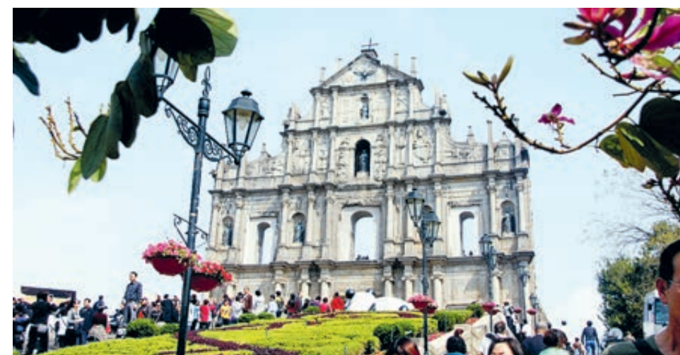
Руины собора Святого Павла в центральной части САР Аомэнь.

Продолжительное развитие экономики на протяжении многих лет способствовало снижению безработицы и улучшению уровня благосостояния жителей. Уровень безработицы с 6,4% в 1999 году упал до 1,8% в 2018 году, в последние несколько лет постоянно наблюдалось падение этого показателя. Ежемесячная заработная плата жителей района выросла с 4890 юаней до 16 тысяч юаней в 2018 году, рост составил 2,27 раза.