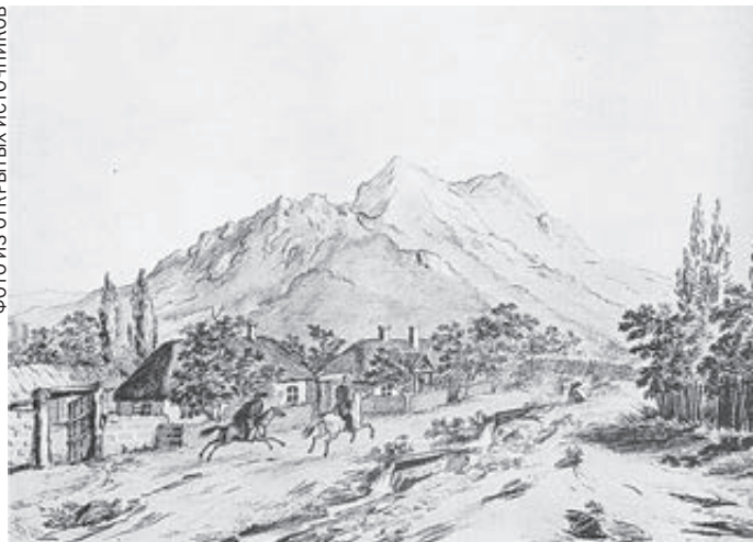
Кавказ в изображении Лермонтова.