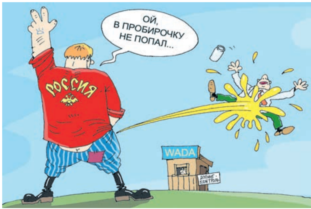
ИЛЛЮСТРАЦИЯ СЕРГЕЯ КОМАРОВА