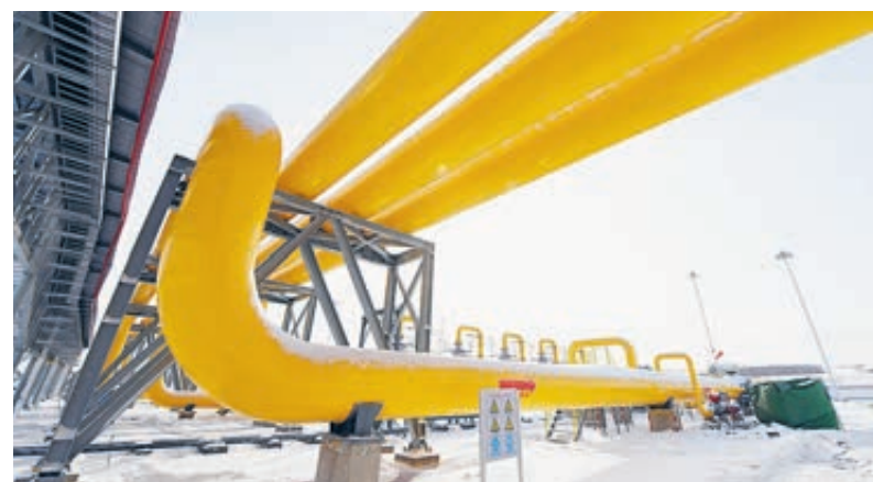
Российский природный газ начал поступать в Китай по восточному маршруту газопровода Россия – Китай.