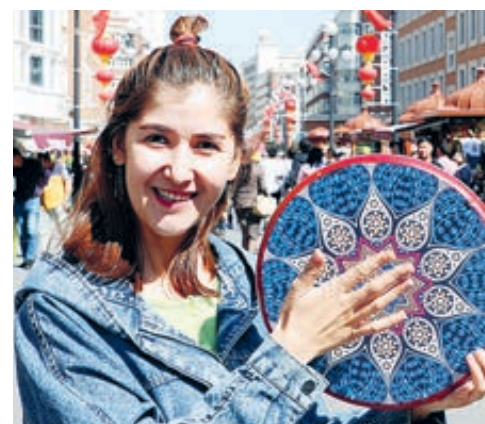
Уйгурская девушка играет на бубне для туристов.

По его словам, учебные программы будут разработаны для удовлетворения потребностей учащихся, сроки программ будут варьироваться в зависимости от курсов.