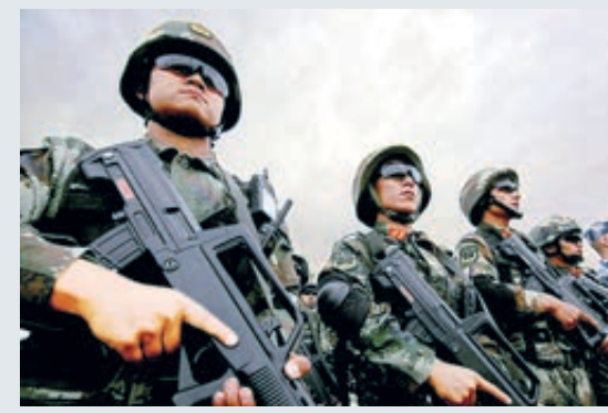
В Синьцзяне провели антитеррористические учения.

Основание образовательных центров в Синьцзяне нацелено на искоренение условий и почвы для зарождения и распространения терроризма и религиозного экстремизма, эффективно предотвращает террористические акты. Многочисленные международные деятели, совершая визиты в Синьцзян, поняли необходимость, легитимность и целесо-