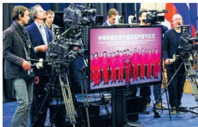
В ходе церемонии ввода в эксплуатацию газопровода «Сила Сибири».