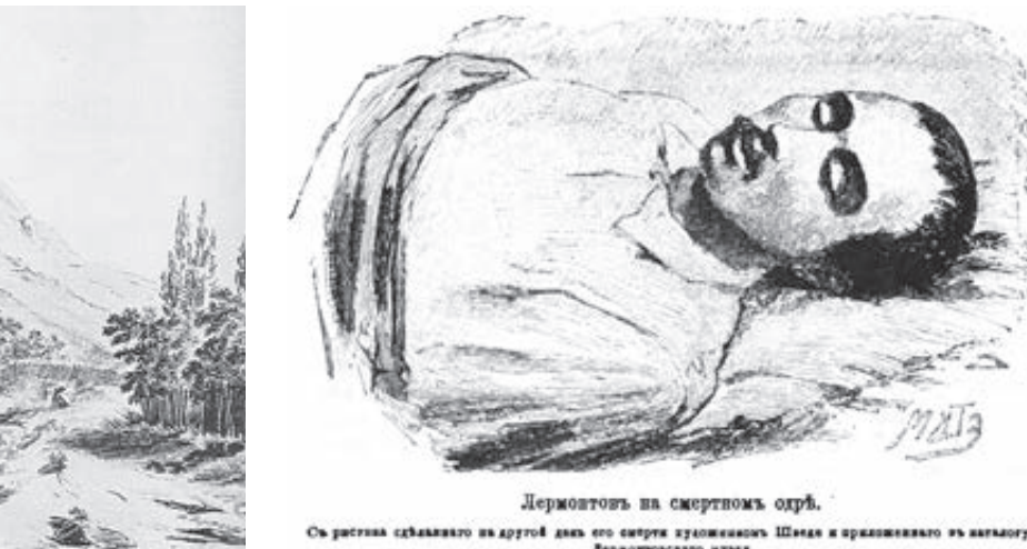
Лермонтов на смертном одре. Ся рисунок сделанно на другой день его смерти художником Шведом и привезено в столицу Лермонтовского музея.

В Шотландку любили приезжать представители «водяного общества», отдыхавшие на кавказских курортах, – колония находилась на полпути между Пятигорском и Железноводском. Дорога в Шотландку прекрасно описана Лермонтовым в «Княжне Мери»: «Лошадь моя была изменена; я выехал на дорогу, ведущую из Пятигорска в немецкую колонию, куда часто водяное общество ездит en riqneque. Дорога идет, свиваясь между кустарниками, опускаясь в небольшие овраги, где протекают шумные ручьи под сенью высоких трав; кругом амфитеатром