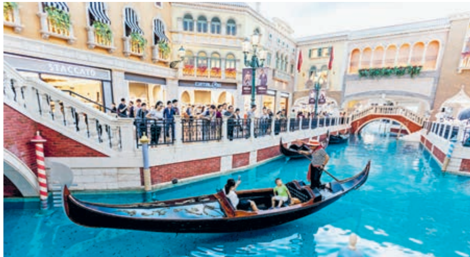
Торговый центр «Великий канал» внутри крупнейшего в мире казино «Венецианец» в Аомэне.

По данным, опубликованным Статистическим бюро Аомэня, ВВП с 51,87 млрд на начальном этапе после возвращения под юрисдикцию Китая вырос до 424,9 млрд юаней в 2018 году, 83 тысячи американских долларов на человека. Фискальные и валютные резервы администрации района постоянно в профиците. В конце 2018 года объем фискальных резервов достиг 508,8 млрд юаней, а валютных резервов – 163,6 млрд юаней, рост по сравнению с 1999 годом – 193 и 6,2 раза соответственно. Это значительно укрепило способности района противостоять внешним рискам.