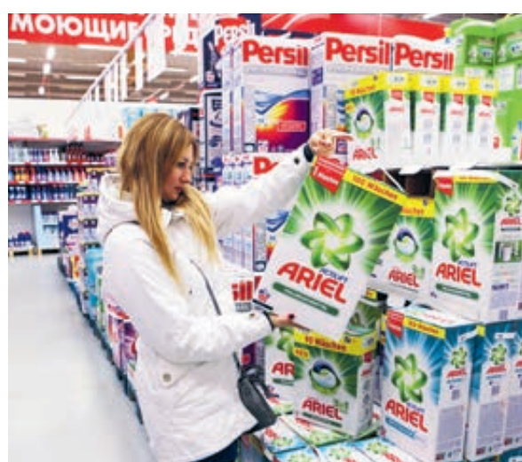
Русская покупательница в финском супермаркете.

В пяти видах очень популярного в нашей стране шоколада (между прочим, претендующего на звание