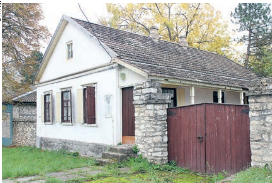
Памятник в Железноводске и тот самый дом Рощке, где поручик Лермонтов обедал перед дуэлью.

мер журнала «Библиотека для чтения» с первой опубликованной поэмой Лермонтова «Хаджи Абрек». Ему, Пушкину, принадлежат провидческие слова о Лермонтове: «Далеко мальчик пойдет».