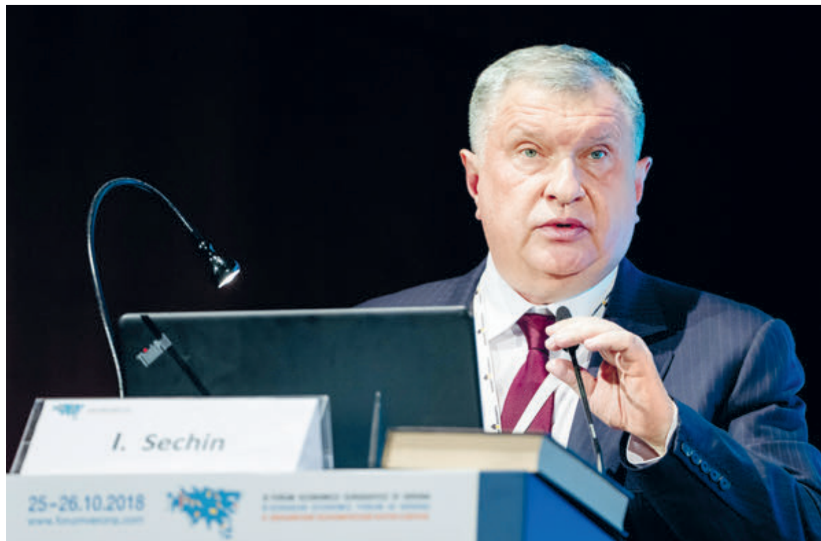
Глава «Роснефти» Игорь Сечин ежегодно на форуме в Вероне выступает с ключевым докладом. В этот раз доклад был сделан из российской столицы в режиме онлайн.

«По имеющимся оценкам, восстановление мировой экономики и спроса на нефть может начаться уже в следующем году. Но человечеству нужно приложить скоординированные уси-