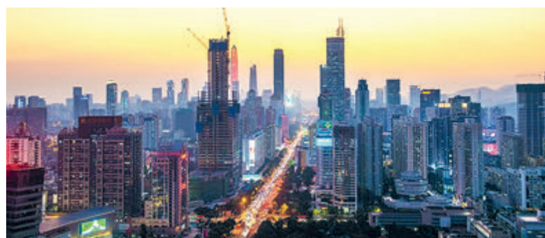
Центр города Шэньчжэнь провинции Гуандун (Южный Китай).