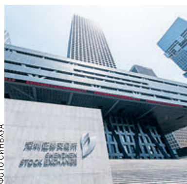
Шэньчжэньская фондовая биржа.