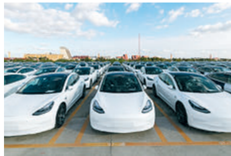
19 октября 2020 года. Партия автомобилей Tesla Model 3 китайского производства ожидает отправки в Европу в порту Вайгаоцяо в Шанхае на востоке Китая.

вырос объем прямых иностранных инвестиций в Китай в сентябре 2020 года