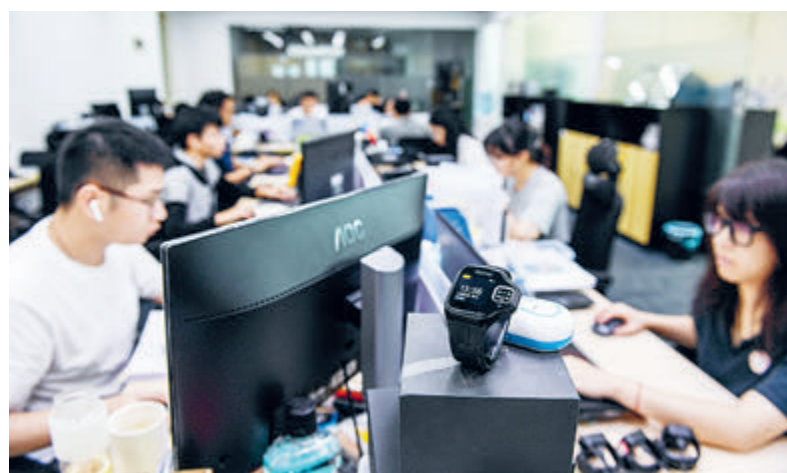
Сотрудники одного из стартапов в районе Футянь, 12 августа 2020 года.

«Время – деньги, эффективность – жизнь», – гласит огромный плакат, написанный на китайском и русском языках возле главного входа в Китайско-Белорусский