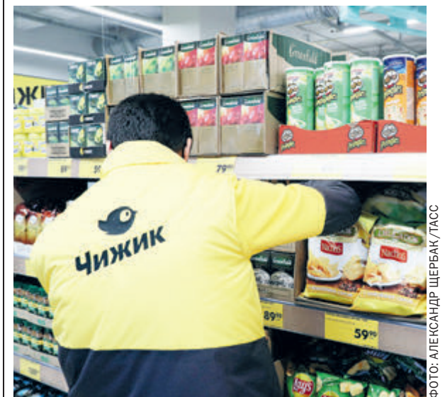
«Чижик»: дешево и сердито.