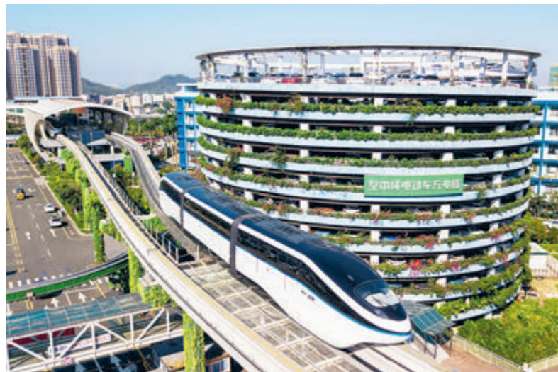
Поезд монорельсовой системы «Юньгуй» («Облачный рельс») проходит мимо штаб-квартиры китайского производителя автомобилей на новых источниках энергии BYD в городе Шэньчжэнь.

индустриальный парк в Минске, столице Белоруссии. Этот лозунг был впервые выдвинут около 40 лет назад в Шэньчжэне, чтобы напомнить строителям промышленной зоны о том, что нужно воспользоваться моментом и стремиться к экономическим чудесам.