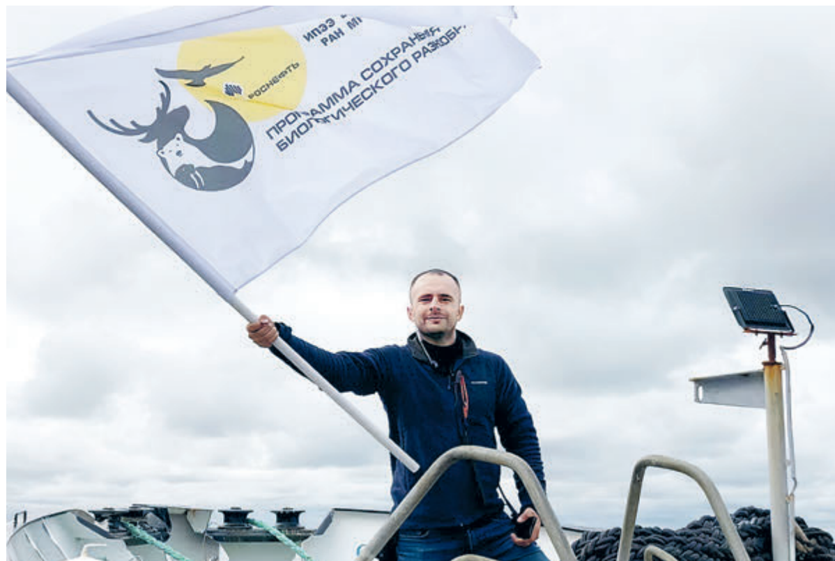
При разработке своих месторождений «Роснефть» уделяет первоочередное внимание вопросам экологии и охраны окружающей среды.