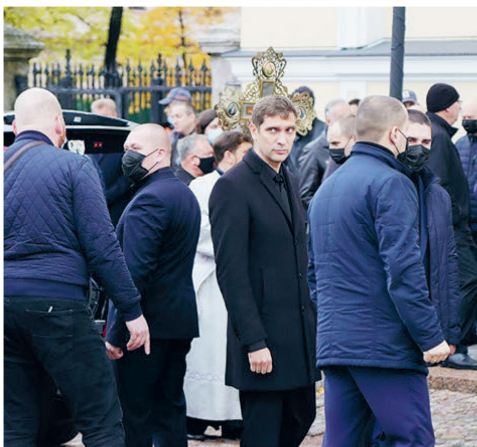
Виталий Петров, известный под прозвищем «Выборгская ракета», на похоронах отца.

ского музыкального театра-студии. За активную общественную и благотворительную работу награжден грамотами президента РФ и Министерства спорта, правительства Ленинградской области и областного Законодательного собрания. А еще победитель конкурса Ленинградской области «Человек слова и дела», обладатель почетного знака «Патриот России», награды «Меценат столетия». Наконец, отец первого российского пилота «Формулы-1» Виталия Петрова.