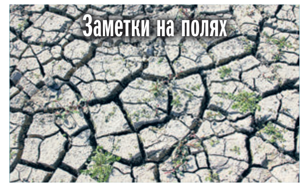
Заметки на полях

PS. Президент Эрдоган подал в суд на Charlie Hebdo, опубликовавший оскорбительную карикатуру, сообщил турецкий телеканал TRT. Генпрокуратура Анкары начала расследование в отношении сотрудников французского журнала.