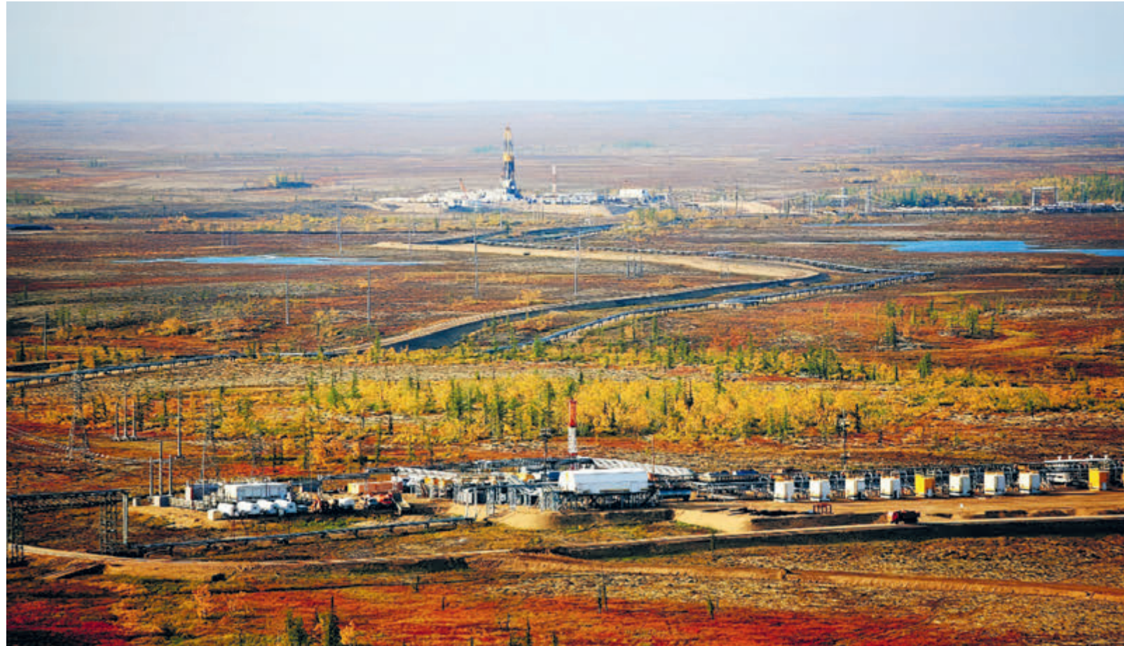
Перспективный проект «Восток Ойл» объединил уже разрабатываемые месторождения Ванкорской группы и новые месторождения на севере Красноярского края.

По словам Сечина, «Роснефть» прилагает все усилия для обеспечения стабильности предложения углеводородов в перспективе. «При этом уже сейчас интенсивность парниковых выбросов компании – одна из самых низких в нефтегазовой отрасли, и сохранение лидерства в этой области является одним из стратегических приоритетов компании. За последние годы «Роснефти» удалось избежать выбросов в размере более 3,1 млн тонн CO 2 -эквивалента. Только за один 2019 год компа-