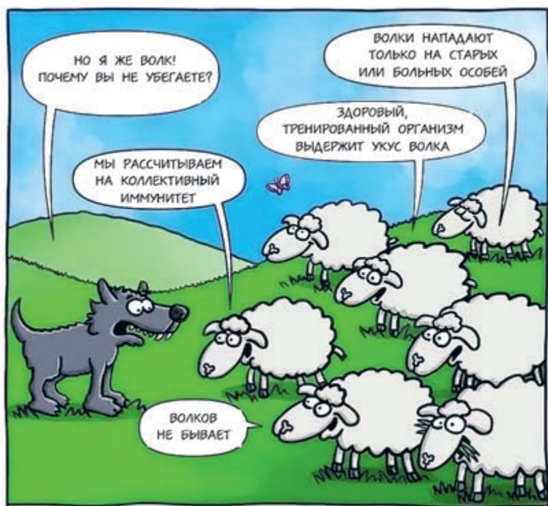
Один из образчиков нового творчества.

Рядом кадр из фильма «Иван Васильевич меняет профессию»: дантист Шпак, воровато озираясь, звонит в участок, и наложен текст: «Алло, милиция, тут на мероприятии 51-й человек подъехал!». Не обошлось и без «Собачьего сердца»: Филипп Филиппович Преображенский сидит в домашнем халате за столом, обхватив голову руками,