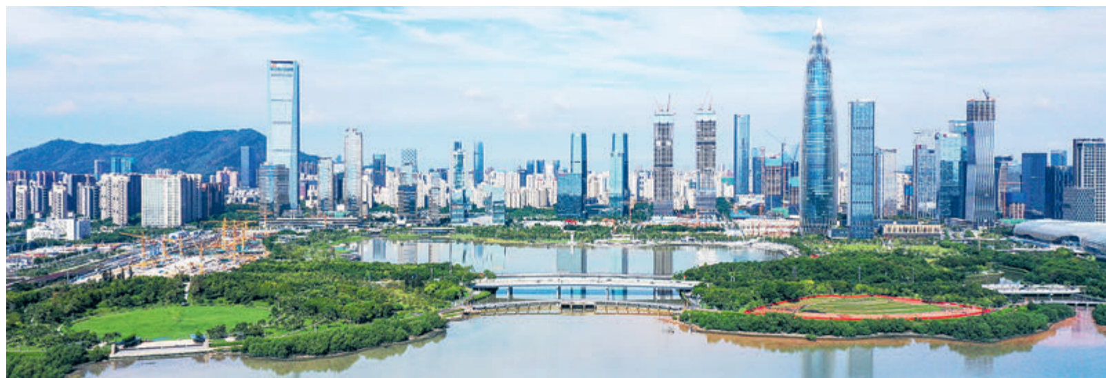
Район Наньшань города Шэньчжэнь.

В августе нынешнего года Шэньчжэнь объявил, что общее число базовых станций связи 5G в городе превысило 46 тысяч, благодаря чему город был полностью покрыт сетью 5G. Это хорошая новость не только для пользователей мобильных телефонов, но и для предприятий, стремящихся открыть новые возможности с помощью этой технологии следующего поколения. «5G сделала исследование и разработки более удобными», – сказал Лю Нянью, вице-президент компании DeerRoute, стартапа в области беспилотных транспортных средств. Эта технология помогает дистанционно координировать и контролировать пробные поездки самоуправляемых автомобилей этой компании. Передовые технологии, от 5G до искусственного интеллекта, способствовали тому, чтобы Шэньчжэнь поддерживал рост в первом полугодии 2020-го, когда эпидемия новой коронавирусной инфекции COVID-19 привела к экономическому спаду на значительной части террито-