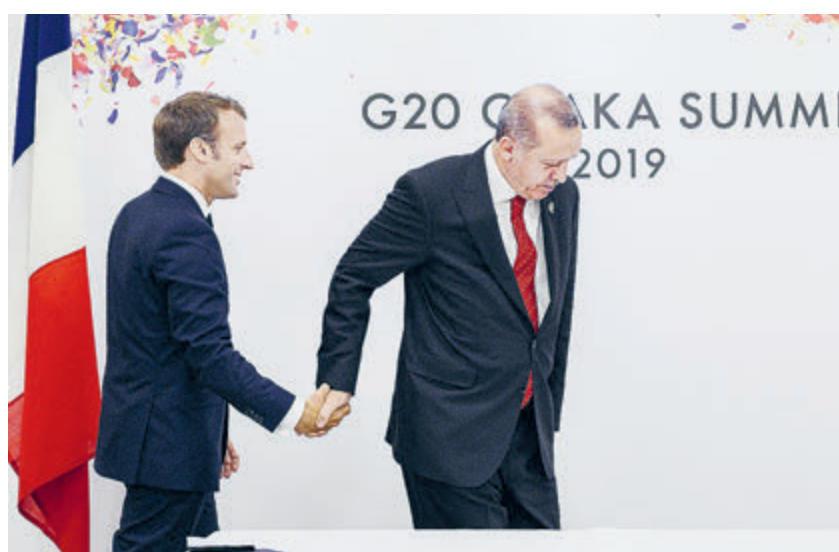
Было время, когда Эрдоган с Макроном гуляли за ручку.

После того как в парижском пригороде Конфлан-Сент-Онорин исламист-тинейджер по заказу радикалов обезглавил школьного учителя, показавшего на уроке карикатуру на пророка, Макрон объявил, что власти Франции «развернут активную борьбу против носителей радикальной идеологии и созданных ими ассоциаций». Что ж, это право любой страны, но нынешнее правительство Франции в своем пристрастии к либерализму не хочет считаться с чувствами миллионов верующих. А в распространении оскорбительных для мусульман карикатур Париж видит проявление демократии, свободы слова и светскости государ-