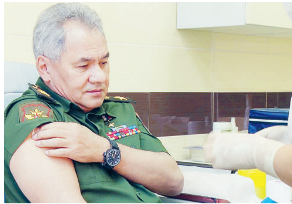
Где должен быть командир? Впереди, на лихом коне... Министр обороны РФ Сергей Шойгу одним из первых привился от ковида.