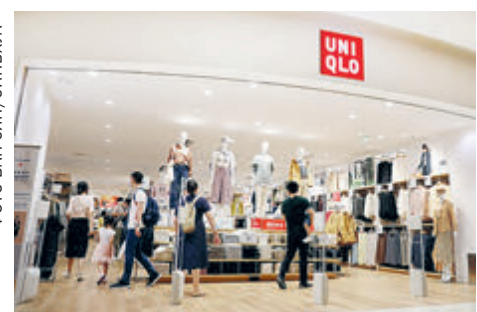
28 августа 2020 года. Покупатели в розничном магазине Uniqlo в Шанхае.

В рамках существующих усилий, таких как сокращение негативного списка для иностранных инвестиций и защита инте-