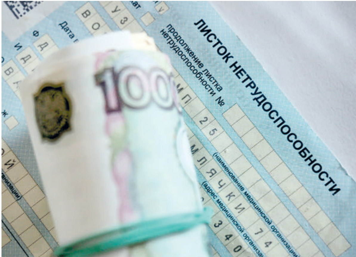
Москва и Московская область перейдут на прямые выплаты с 1 января 2021 года.

С 1 января 2021 года работодатели прекратят выплату социальных пособий