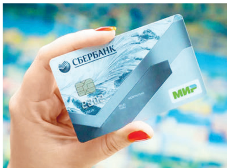
Карта «Мир» дает ряд преимуществ, одно из которых – быстрое зачисление средств.

с несчастным случаем на производстве или профессиональным заболеванием); • по беременности и родам; • единовременное пособие при рождении ребенка; • ежемесячное пособие по уходу за ребенком до достижения им возраста 1,5 года; • оплата дополнительного отпуска (сверх ежегодного предоставляемого) на период лечения, проезда к месту лечения и обратно, предоставляемого застрахованному лицу, пострадавшему на производстве.