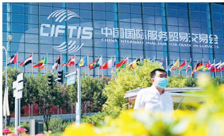
Китайский национальный выставочный центр, главное место проведения Китайской международной ярмарки торговли услугами – 2020 в Пекине.