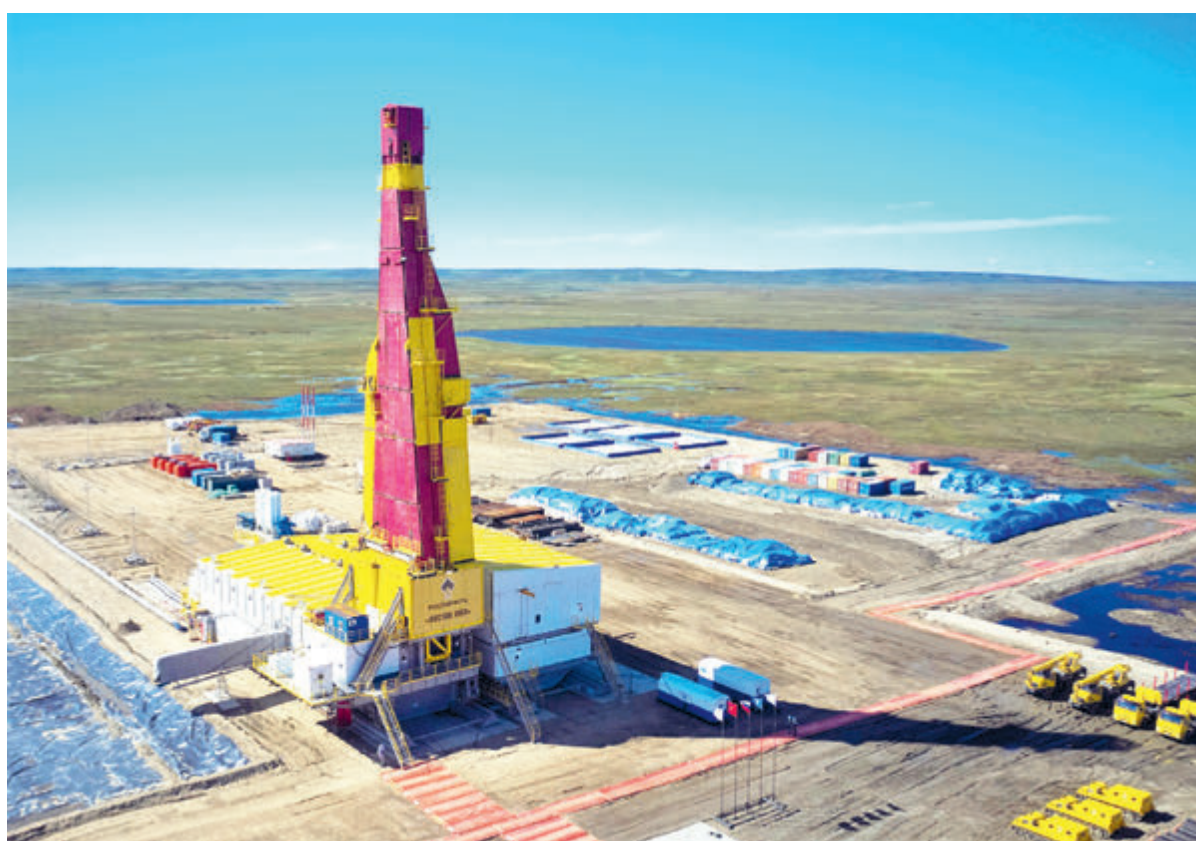
«Роснефть» в соответствии с графиком реализует работы в рамках флагманского проекта «Восток Ойл».