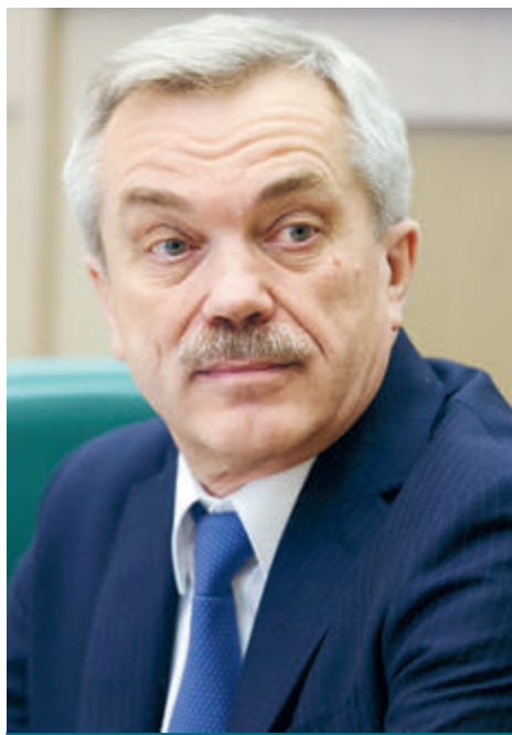
ЕВГЕНИЙ САВЧЕНКО СЕНАТОР, ЧЛЕН КОРРЕСПОНДЕНТ РАН

Сегодня Россия как никогда нуждается в фундаментальной и судьбоносной программе, способной преобразить все грани ее жизнеустройства – экономическую, социальную, духовно-нравственную. Вселить в общество чувство социального оптимизма, справедливости и уверенности в будущем. Задача непростая, но стране и людям она вполне по силам.