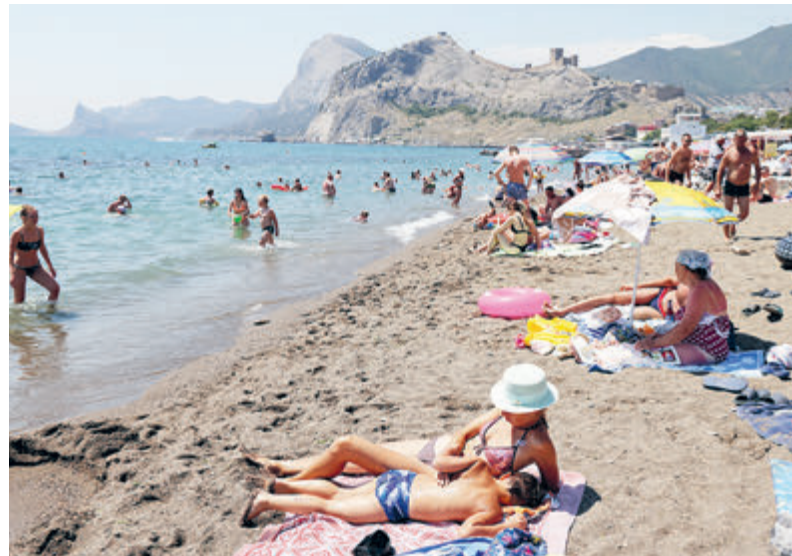
Такая картина в Крыму нынче – редкость.

Увы, радостная статистика в Большой Ялте диссонирует с общей информацией о количестве отдыхающих, посетивших весь остальной Крым. По данным главы республики Сергея Аксенова, от начала нынешнего года речь идет о 3,7 млн человек. Элементарная арифметика: без малого два миллиона гостей рассосались на огромном пространстве крымского побережья. Это капля в море. Все лето напролет многие пляжи оставались пустыми. Например, целый ряд гостевых домов бюджетного курорта Черноморское к августу закрылись. То есть даже в высокий сезон северо-западное побережье оказалось неостре-