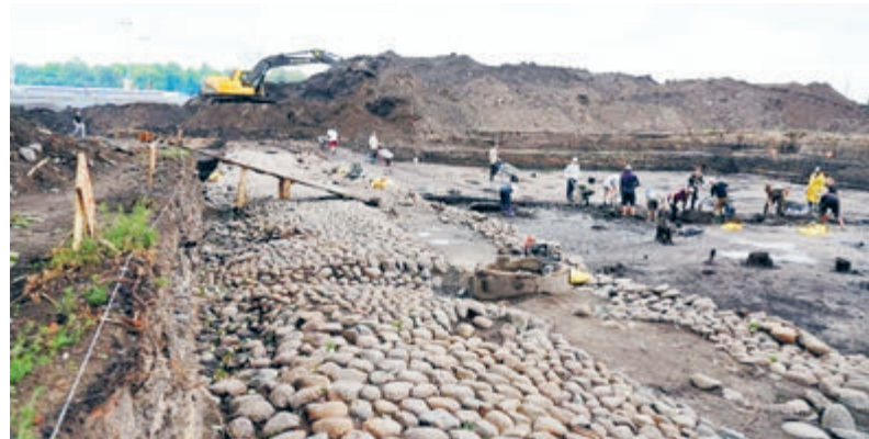
Охтинский мыс. Раскопки в разгаре...

Впрочем, совсем другие риторические вопросы задают петербургские журналисты. Глядя на археологические раскопки, ставя их в один ряд с находками на Охтинском мысе 2006–2009 го-