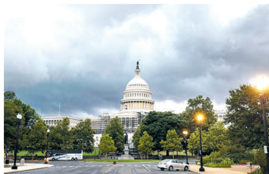
Над Капитолием опять сгущаются тучи?