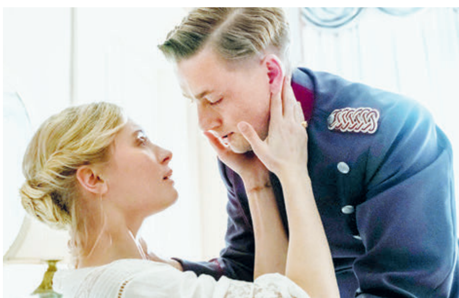
ФОТО ИЗОБРАЖЕНИЙ ИСТОЧНИКОВ