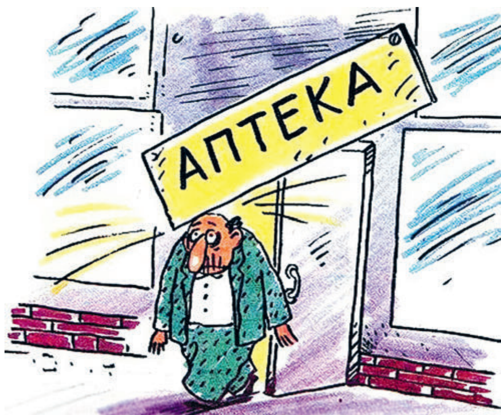
Иллюстрация из открытых источников