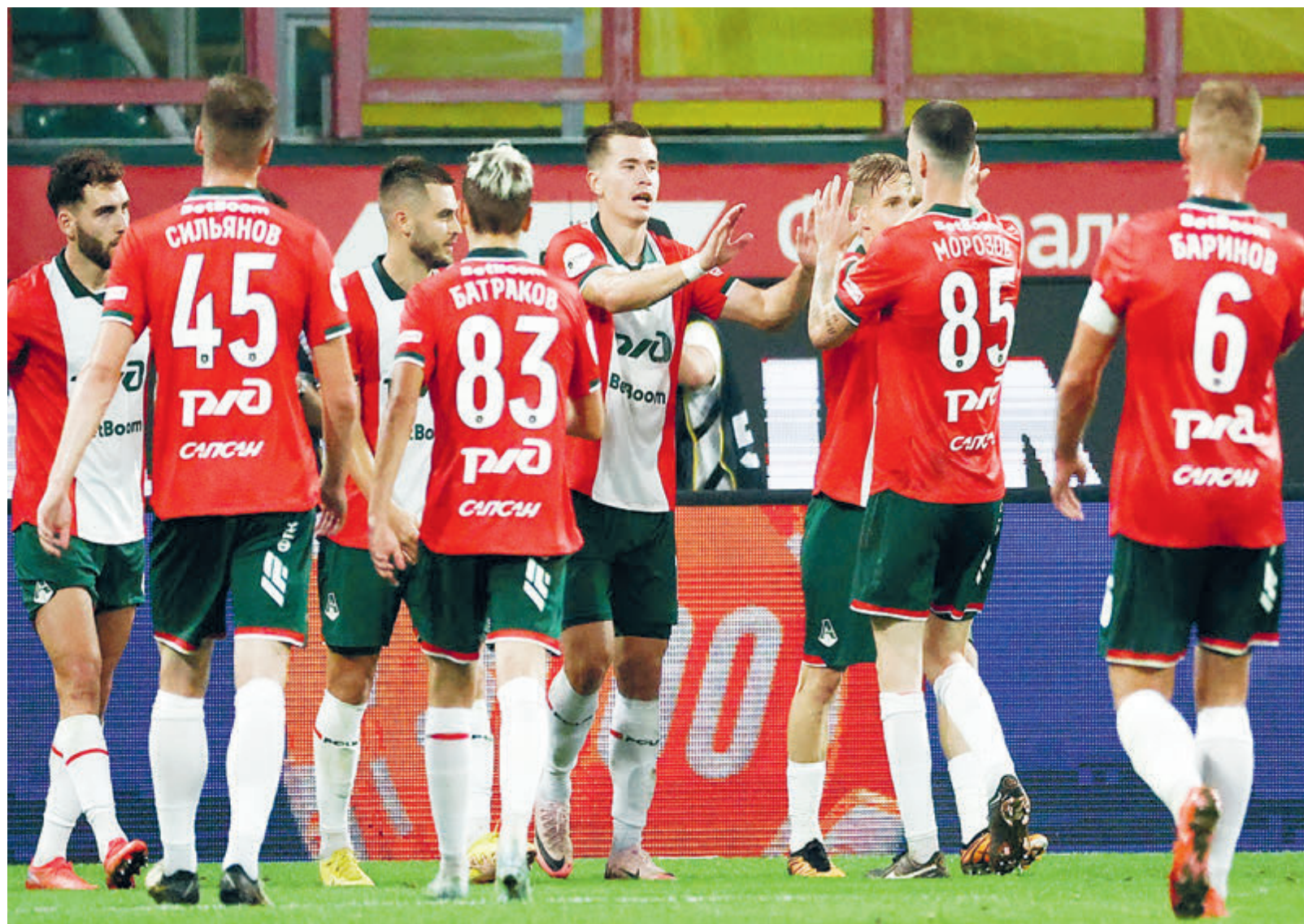
«Локомотив» одержал в матчах чемпионата и кубка семь побед подряд с общим счетом 19:4.

Можно, конечно, порадоваться за «Зенит», но такие траты в наше время мало кому из российских клубов по карману, а значит, пропасть между богачами и бедняками и дальше будет углубляться, соответственно, тактика многих команд все больше будет сваливаться в сугубо защитные варианты. А зенитовские игроки передней линии Андрей Мостовой и Иван Сергеев, на которых могла бы рассчитывать сборная, теперь рискуют прописаться на скамейке запасных.