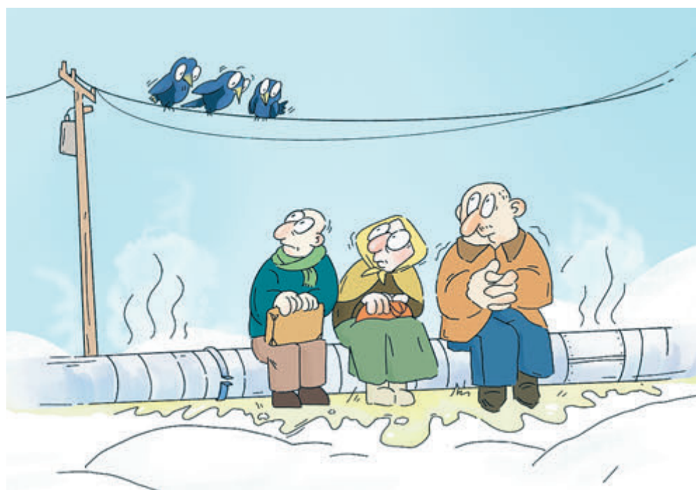
ИЛЛЮСТРАЦИЯ НАСТАСЬИ КОВАЛЕВСКОЙ

Ответственными ведомствами указаны Федеральная антимонопольная служба (ФАС), Минстрой, Минэнерго, Минэкономразвития и комитет Думы по защите конкурентной политики. В числе рекомендаций – установление экономически обоснованного размера платы за жилищные услуги (содержание дома, обслуживание лифтов, текущий ремонт и т. д.) также не менее чем на пять лет. Это, как считают разработчики, «поможет закрыть одну из последних лазеек, которыми пользуются недобросовестные УК, собирая необоснованные средства с граждан». Но сухой остаток таков: тарифы будут поднимать.