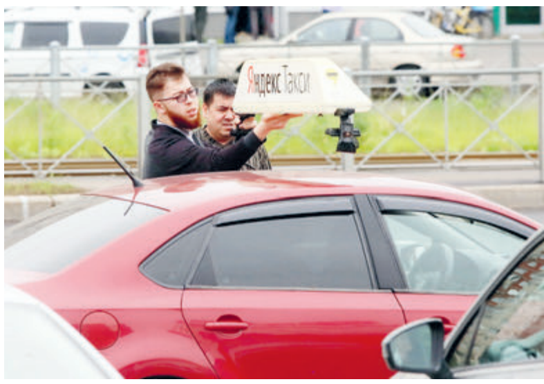
Власти Питера считают, что без мигрантов город останется без такси.