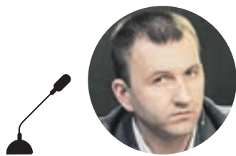
ПАВЕЛ КРАСНОРУТСКИЙ ПРЕДСЕДАТЕЛЬ РОССИЙСКОГО СОЮЗА МОЛОДЕЖИ