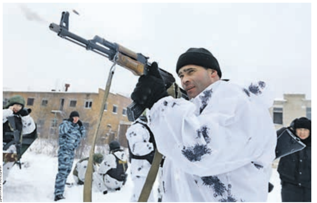
Вчера 17:55 Подмосковный полигон. Боец ОМОНа ведет стрельбу холостыми патронами по условному противнику. Задача спецназа — отбить нападение на колонну и ликвидировать огневые точки «боевиков»

и выстраивают круговую оборону. Быстро вычисляют огневые точки и группами с флангов атакуют неприятеля. Первый прогон (попытка) не устраивает полковника — есть замечания. Группы возвращаются на начальные рубежи. На этот раз применяются дымовые шашки, в бой вступают бронетранспортеры, открывающие стрельбу из своих пушек. Цель достигнута, ни одному «террористу» уйти не удалось. Хочется надеяться, что в настоящую засаду омывцы не попадут.