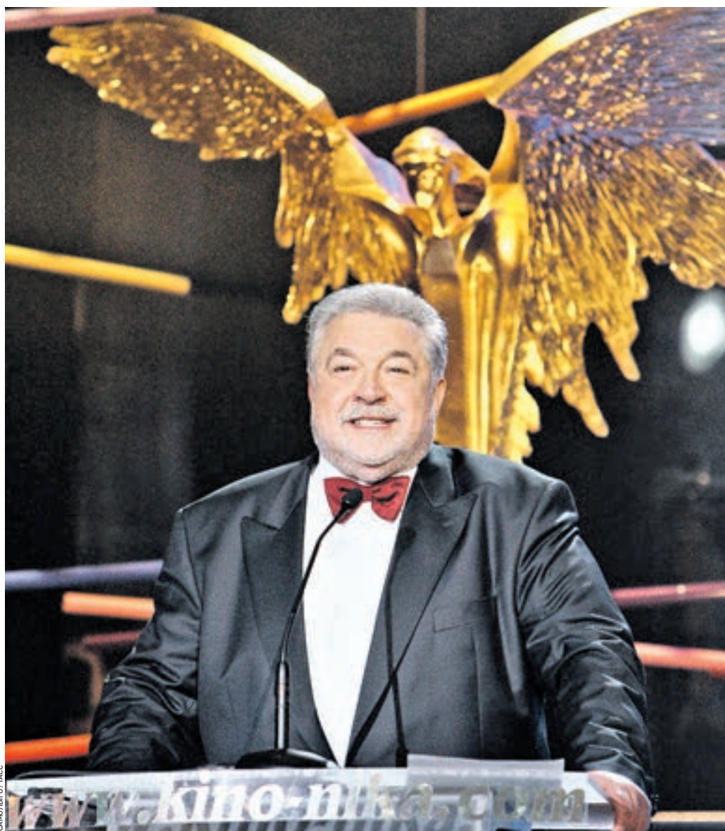
8 апреля 2012 года. «Крокус Сити Холл». Юлий Гусман на 25-й юбилейной торжественной церемонии вручения Национальной кинопремии «Ника»

«Ника» — национальная кинематографическая премия, учрежденная Российской академией кинематографических искусств. Была создана в 1987 году. Идея премии принадлежит ее художественному руководителю Юлию Гусману.