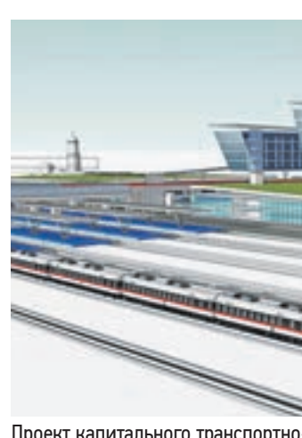
Проект капитального транспортно-пересадочного узла «Рязанская»

разместятся на участке почти в 23 гектара. Территория, на которой появится пересадочный узел, ограничена Рязанским проспектом, шоссе Фрезер и Московской кольцевой железной дорогой. Сейчас на этой территории расположены гаражи, отделение МВД и складская база. В пояснительной записке к проекту указано, что транспортно-пересадочный узел «Рязанская» — крупнейший и наиболее значимый из всех, что будут возведены на Московской кольцевой железной дороге. Как предполагают проектировщики, в час пик этим узлом будут пользоваться 16,3 тысячи человек. Кроме того, этот объект станет связующим звеном между Лефортовским и Нижегородским районами. А в связи с закрытием наземного перехода через пути Горьковского направления железной дороги с шоссе Фрезер пешеходная связь с Рязанским проспектом и Нижегородской улицей также будет осуществляться с помощью этого узла.