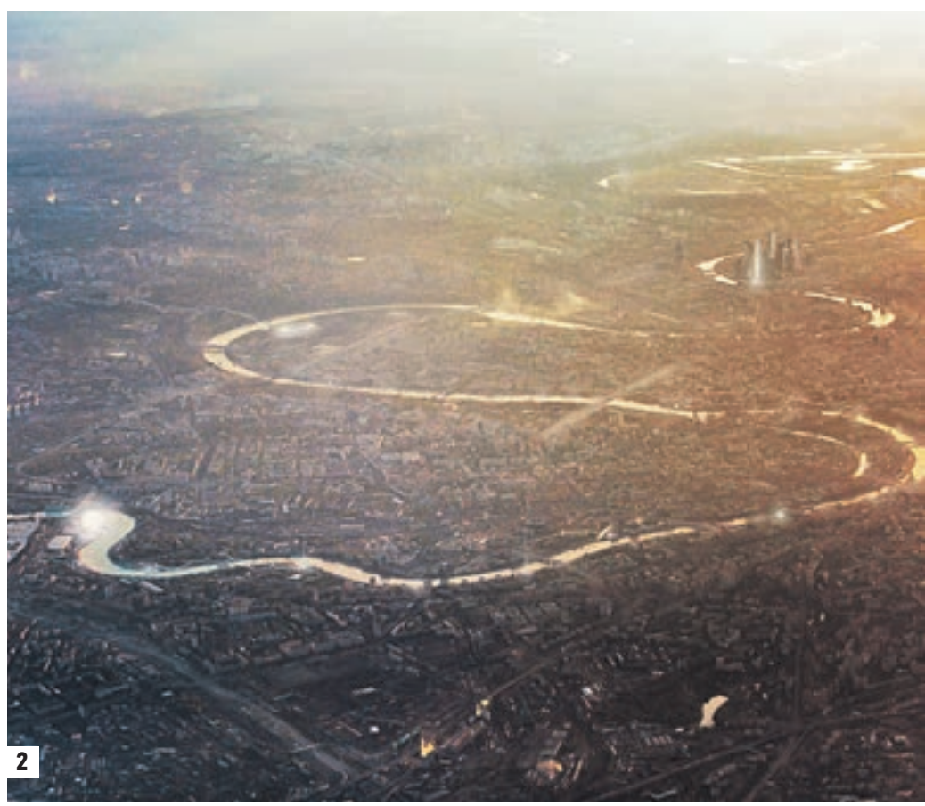
Проекты градостроительной концепции развития территории Москвы-реки, разработанные консорциумом архитекторов во главе с российской компанией «Проект Меганом». В ближайшем будущем главная водная артерия столицы превратится в идеальное место отдыха на всем своем протяжении (1, 2) Проект станции метро «Саларьево», который создали специалисты «Мосинжпроекта» (3) Так с высоты птичьего полета будет выглядеть ледовый дворец спорта «Арена легенд» на территории промзоны ЗИЛ (4)

связать Киевское и Курское направления железной дороги. При их пересечении образуются узлы и территории с хорошей транспортной доступностью, вдоль которых идет развитие территорий. Как будет развиваться структура метрополитена в Новой Москве?