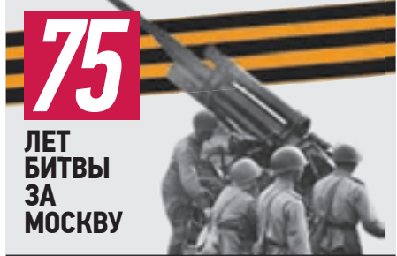
75 ЛЕТ БИТВЫ ЗА МОСКВУ

ентировать. И только тогда бьют на поражение. Это была ювелирная работа зенитных расчетов: сбить бомбардировщик нужно было так, чтобы он не рухнул на жилые дома. Тушил «зажигалки» я весь август. А в сентябре нас с одноклассниками отправили на завод. В цехах нам сделали подставки, чтоб мы могли дотянуться до верстаков. К началу Битвы за Москву мы как раз освоили первичную сборку ПШШ — пистолета-пулемета Шпагина. Выбирали из нескольких ящиков детали и собирали ствольную коробку и затвор, а потом уже квалифицированные слесари доводили все до ума. На заводе нам очень нравилось. Бывало, по две недели не бывали дома — спали тут же, на верстаках. На протяжении всего