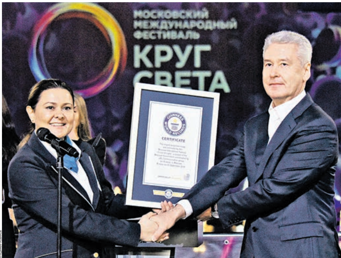
27 сентября 20:40 Официальный представитель Книги рекордов Гиннеса Сейду Субаши-Гемиджи (слева) вручила мэрской Марии Москвы Сергею Собянину сертификаты, подтверждающие мировые рекорды международного фестиваля «Круг света»

— Мы часто слышали об «умных городах» и долго думали, что это не про нас. Но наша патриархальная Москва стремительно превращается в один из них, — заявил Сергей Собянин. — Еще недавно трудно было себе представить, что с мэром можно пообщаться в Твиттере, узнать от него первые новости, высказать все, что вы о нем думаете, и вам за это ничего не будет. Сегодня любой проект можно обсудить на портале «Активный гражданин». Или сделать селфи на фоне городских проблем и отправить на портал «Наш город». И получить от-