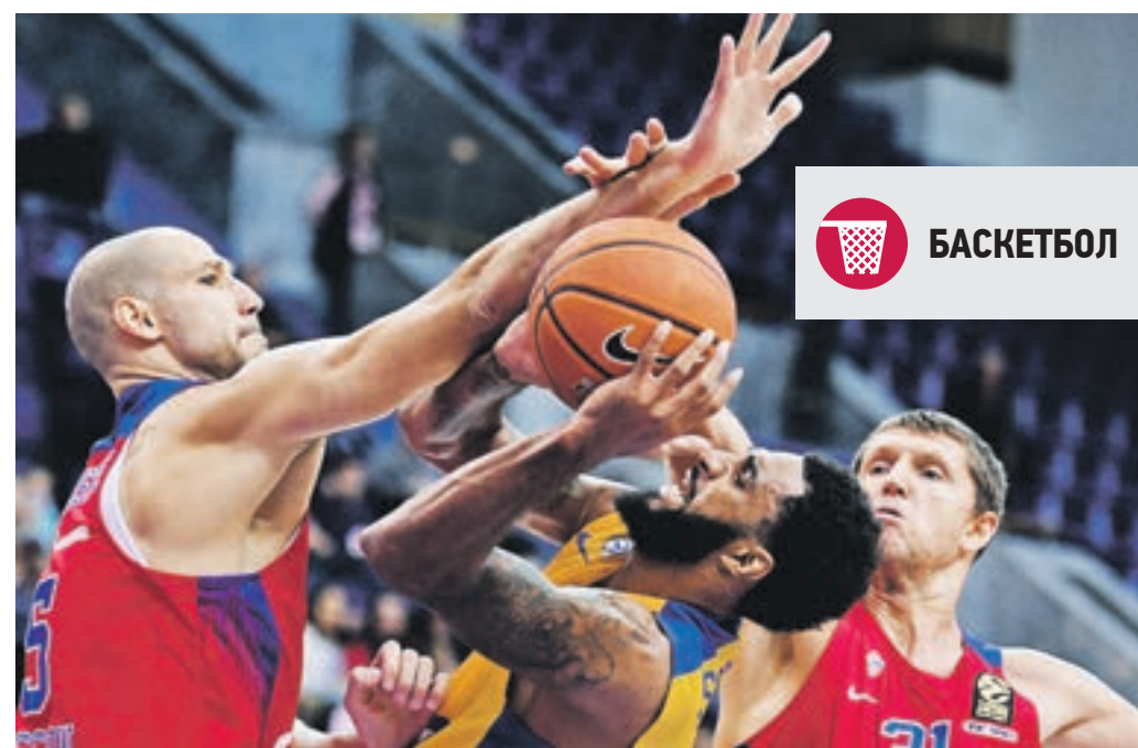
26 сентября 15:20 Игрок баскетбольной команды ЦСКА Милош Теодосич блокирует атаку игрока израильского «Маккаби». Уже в первой четверти счет на табло был 36:18 в пользу «армейцев»!