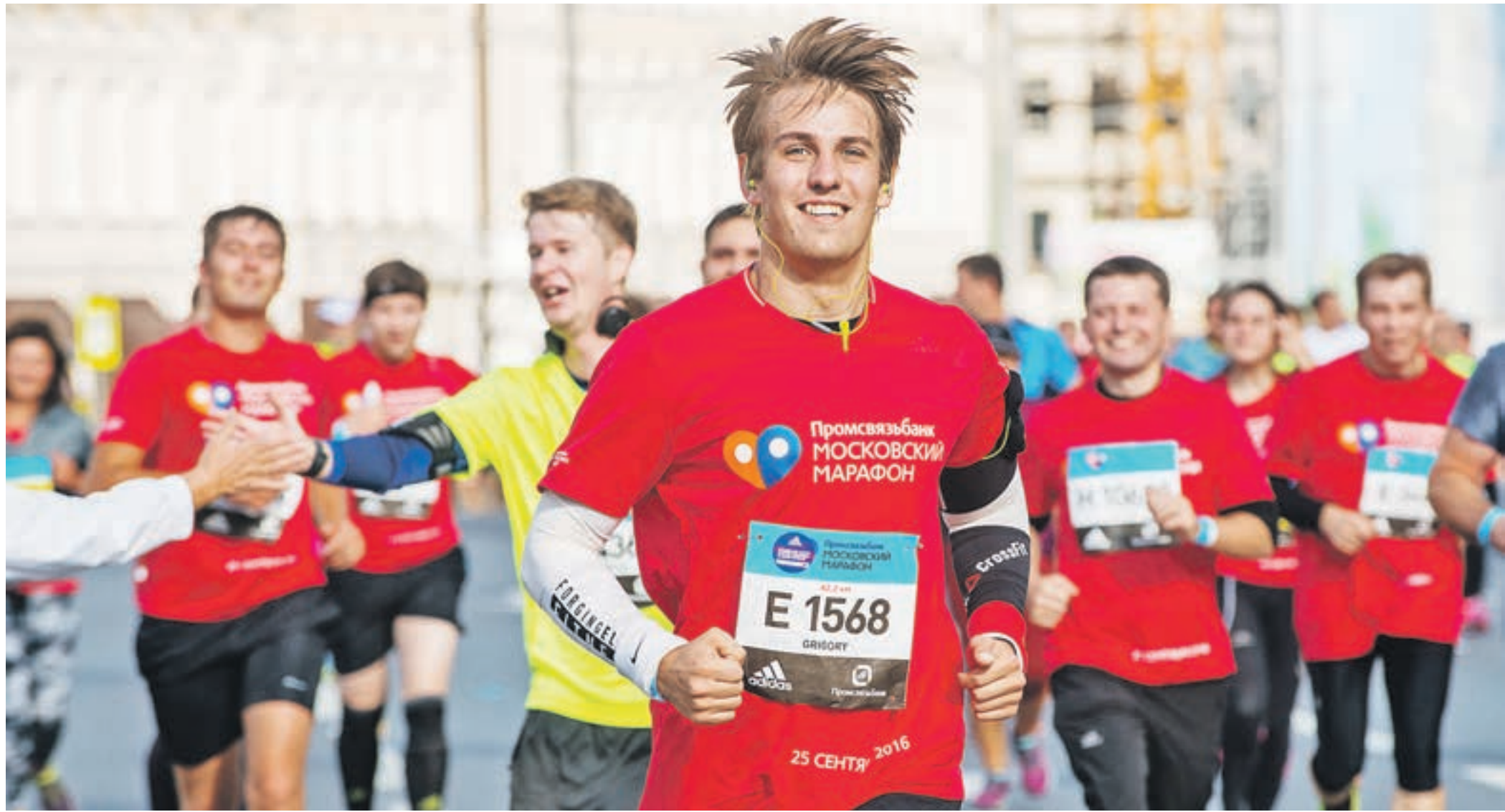
25 сентября 11:47 Участники Московского марафона пробежали по центральным улицам столицы. Вдоль маршрута марафонцев подбадривали зрители, протягивая им свои ладони, говоря: «Молодцы! Вы сможете!»

воскресенье, 25 сентября улицы Москвы превратились в одну большую спортивную площадку, на которой состоялся классический марафон — бег на дистанции 42,2 километра. Этот старт входит в состав Международной ассоциации марафонов и забегов AIMS. Кроме того, параллельно все желающие могли принять участие в забеге-спутнике на 10 километров. Марафон в Москве набирает популярность колоссальными темпами. Сообщество атлетов, преодолевающих обозначенные выше дистанции, растет едва ли не с геометрической прогрессией. Если в 2013 году на старт столичного марафона вышли 5 тысяч атлетов, то в этом году количество участников насчитывало уже 30 тысяч. Если говорить о географии участников, то и эти цифры производят гло-