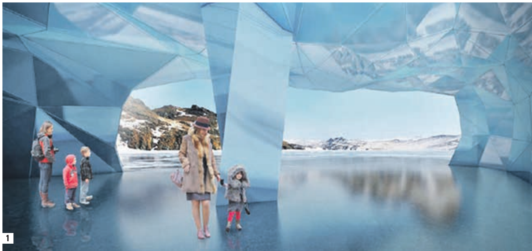
1 Стилизованный под ледяную пещеру павильон с интерактивной экспозицией расскажет об истории освоения Севера (1) Атракцион «Полет над Россией» расскажет о 25 уникальных природных зонах нашей страны. С помощью движущихся кресел и спецэффектов зрители познакомятся с климатическими особенностями территории от Камчатки до Калининграда (2) В парке «Зарядье» разместятся кафе и рестораны общей площадью 4,4 тысячи квадратных метров, а вместимость — 315 посадочных мест. На вынос заведения смогут обслужить до 350 человек в час (3) Проект медиacentра в парке «Зарядье». В его структуре предусмотрен аттракцион «Полет над Россией», экспозиция «Москва сейчас», медиахолл, интерактивный музей и телестудия (4)