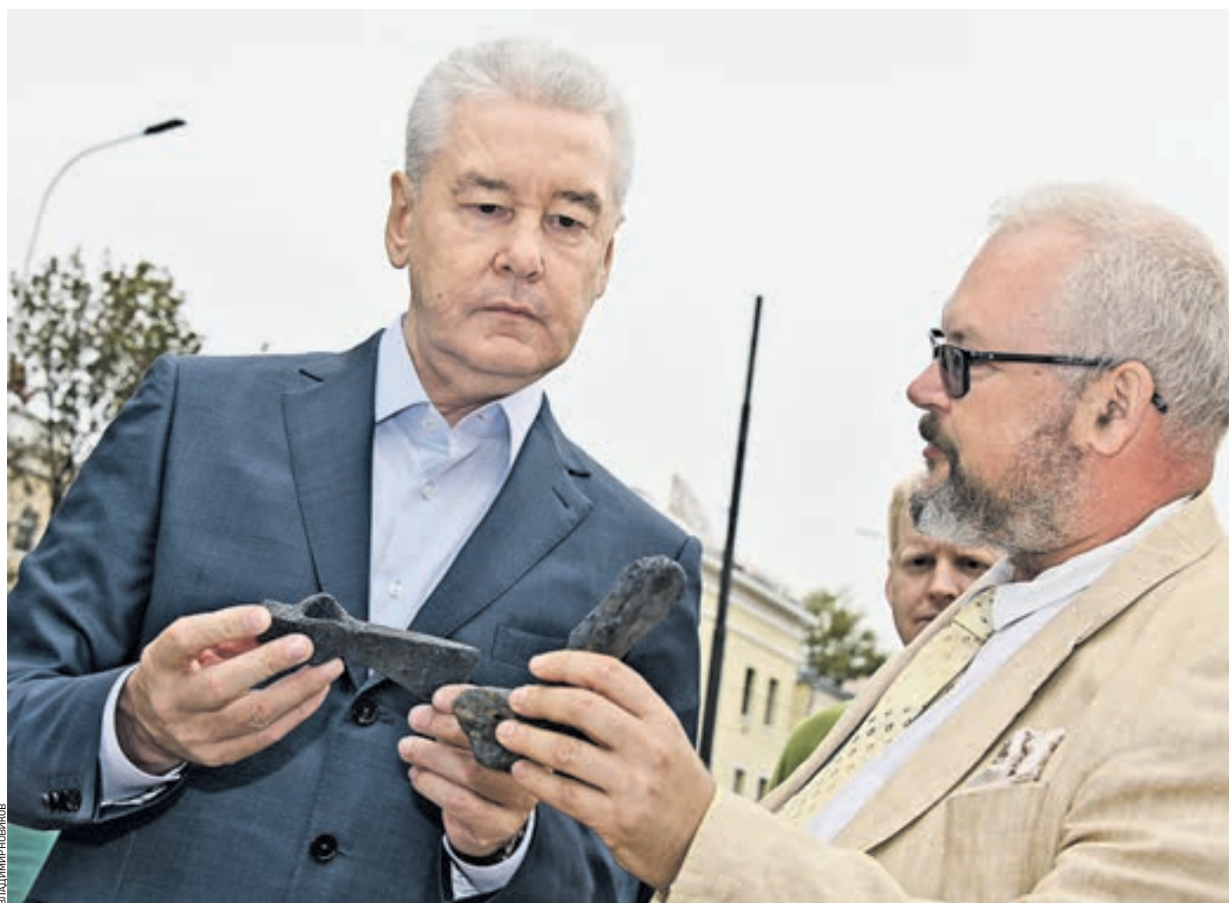
4 августа. Мэр Москвы Сергей Собянин (слева) и главный археолог столицы Леонид Кондрашев рассматривают найденные в центре города артефакты. В руках у главы города — часть каменного топора, который принадлежал первым поселенцам на территории

Действительно, непростое себе представить, что еще десять лет назад здесь мог появиться торгово-развлекательный центр с подземной парковкой. Тогда на Хохловской площади уже начали возводить стоянку для автомобилей, но в процессе строители наткнулись на древние стены. Инвестор попытался сохранить артефакт, были проведены исследования, укрепили саму стену Белого города. Но, пытаясь сохранить наследие XVI века и параллельно строя крупный объект в центре города, инвестор обанкротился. Стройка оказалась замороженной, а старинной оборонительной стены поселилось семейство уток. Они облюбовали болото, которое стало зативать артефакт с почти пятивековой историей. — На месте красивой Хохловской площади был несчастный затопленный объект, фактически — помойка, — сказал Сергей Собянин. —