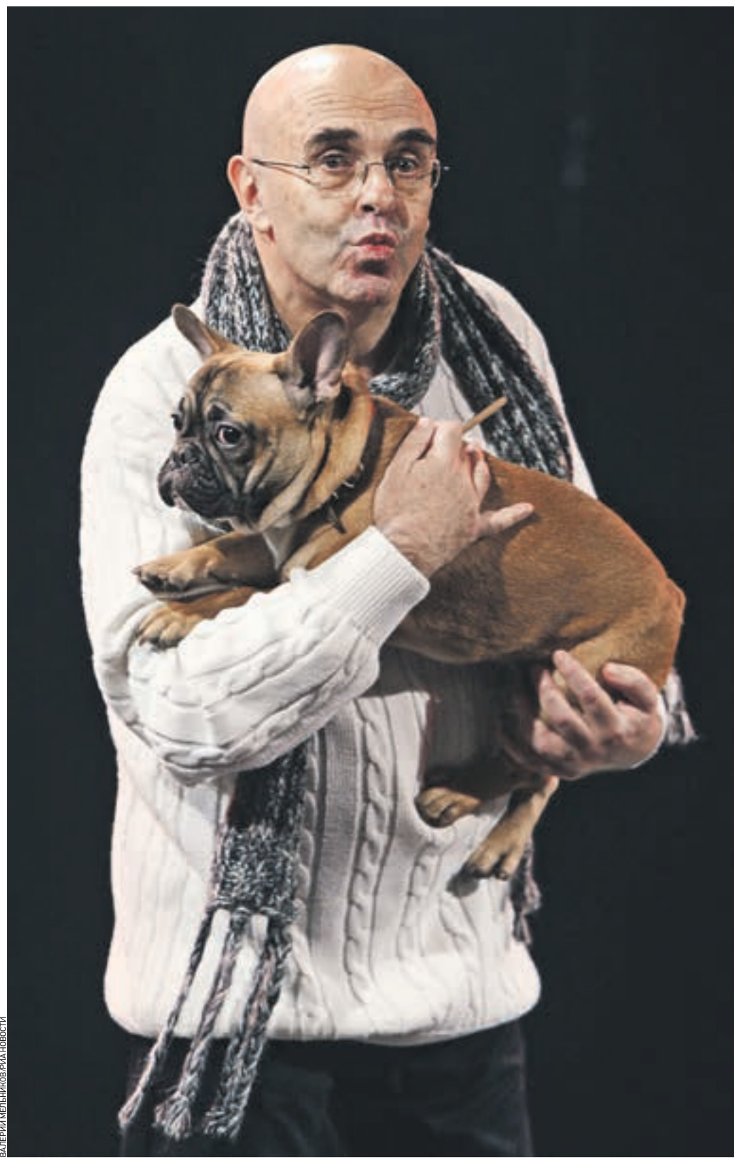
25 декабря 2009 года. Михаил Левитин во время выступления на юбилейном вечере, посвященном 50-летию московского театра «Эрмитаж»

В конце 1970-х годов дебютировал как прозаик. Автор ряда книг. Неоднократный номинант литературной премии «Букер». Заслуженный деятель искусств РСФСР, народный артист России.