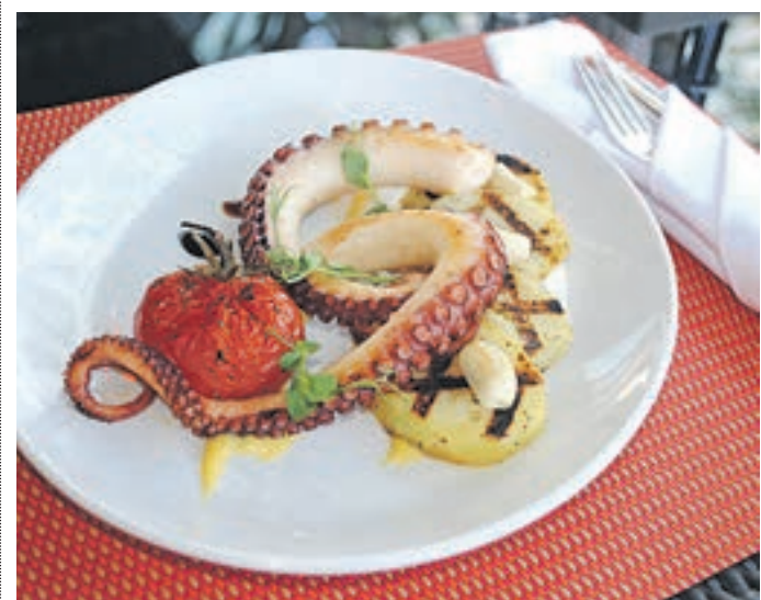
Маринированный осьминог, гриль с картофелем, вяленым томатом и соусом руй — одна из новинок меню

Запоздалая весна наконец пришла в столицу, а значит, наступило время для долгих прогулок по центральным улицам любимого города.