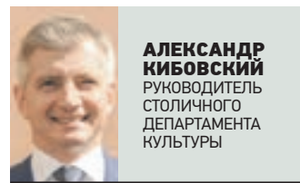
АЛЕКСАНДР КИБОВСКИЙ РУКОВОДИТЕЛЬ СТОЛИЧНОГО ДЕПАРТАМЕНТА КУЛЬТУРЫ

К онкурс на присуждение талантливым ребятам грантов мэра Москвы долгое время существовал как бы в «спящем» режиме. Это была история добровольного характера: школы и колледжи искусств участвовали в нем по желанию. Однако все изменилось в прошлом году. Участие в конкурсе стало обязательным для каждого московского учебного заведения в сфере искусств. Сегодня это 10 колледжей и 144 школы. Причем они готовят ребят по самым разным творческим направлениям: музыка, театр, хореография, изобразительное искусство. Да, это дополнительное образование. Но в то же время оно является начальной профессиональной подготовкой исполнителей следующего поколения — нашего музыкального и творческого завтра. Чтобы не быть голословным, вот яркий пример. В Лондоне всего шесть музыкальных школ. И все они частные. В Москве же шесть тысяч педагогов бесплатно учат более 90 тысяч талантливых ребят. И мы, и наши коллеги, конечно, понимаем, кто будет завтра определять художественную повестку не только в России, но и в мире.