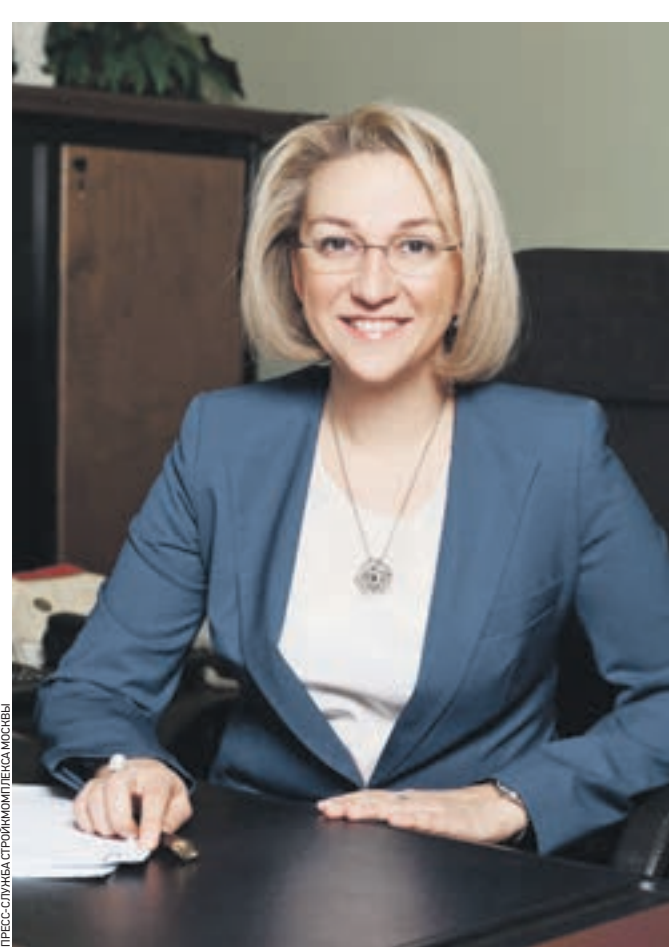
Вчера 13:30 Председатель Комитета по архитектуре и градостроительству Москвы Юлиана Княжевская

Если есть желание докупить площадь и переехать в более просторную квартиру, будет предусмотрена рассрочка платежей, можно будет использовать материнский капитал. Очередники получат новые квартиры по социальным нормам предоставления жилья.