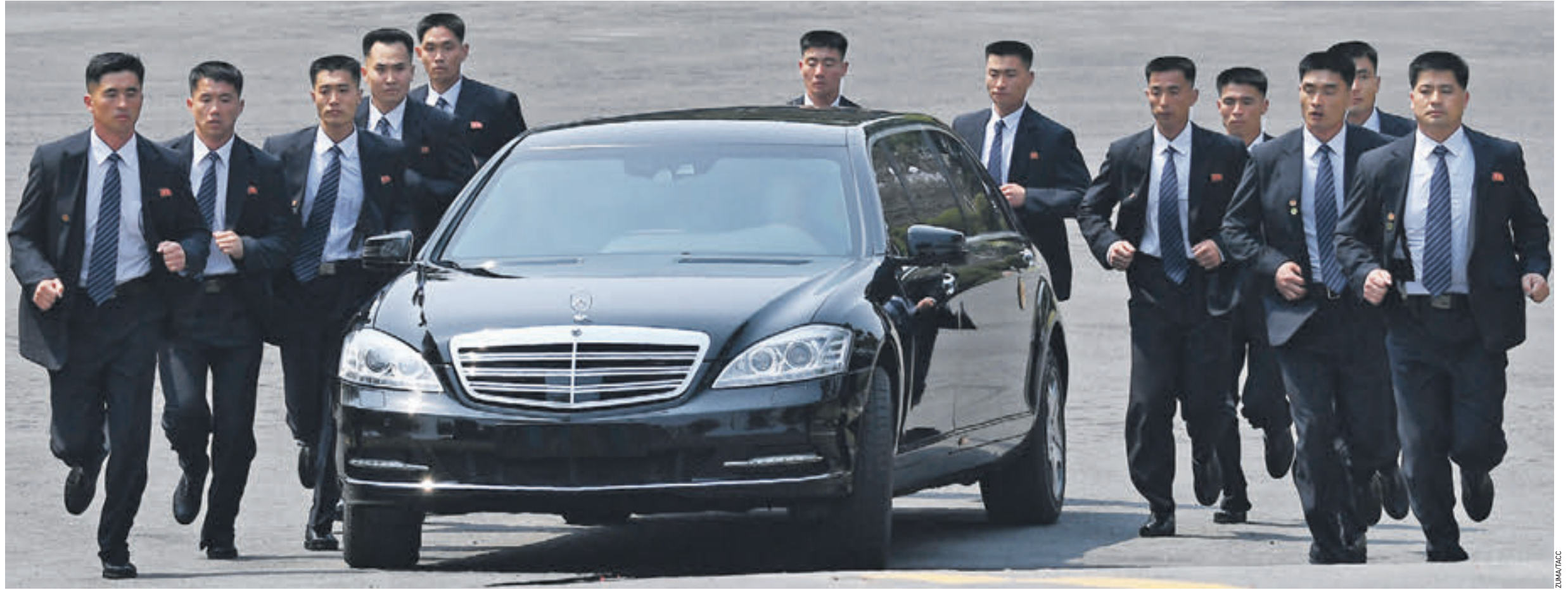
27 апреля 2018 года 17:55 Встреча лидера КНДР Ким Чен Ына и президента Южной Кореи Мун Чжэ Ина в рамках межкорейского саммита. Автомобиль президента Северной Кореи Mercedes-Maybach S600 Pullman Guard сопровождают 12 бегущих охранников. Таким образом они обеспечивают безопасность лидера страны. Видео поездки Ким Чен Ына с бегущими за машиной мужчинами в строгих костюмах вызвало бурные обсуждения в соцсетях

Больше всего подробностей известно о лимузине президента США Дональда Трампа. Его производит концерн «Кадиллак». Название у машины — соответствующее: The Beast («Зверь»). И таких уже две — сначала подобное авто создали для первого темнокоричневого президента США Барака Обамы. Кстати, американские производители действительно разработали самый бронированный в мире автомобиль (см. ТТХ), при этом отказались от скоростных характеристик в угоду безопасности. Имеется арсенал оружия: в водительской двери и в правой, пассажирской. За правым задним фонарем скрывается пушка, стреляющая гранатами со слезоточивым газом, и система пожаротушения. В багажнике — автоматическое оружие и гранатометы.