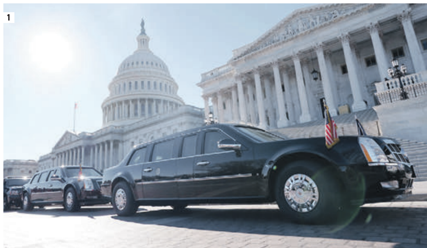
28 ноября 2017 года 18:09 Лимузин президента США Дональда Трампа «Зверь» считается самой бронированной машиной в мире (1) 7 мая 2018 года 18:08 Aurus проекта «Кортеж» был представлен 7 мая — на этом авто президент России приехал на инаугурацию (2)

Мнение колумнистов может не совпадать с точкой зрения редакции «Вечерней Москвы»