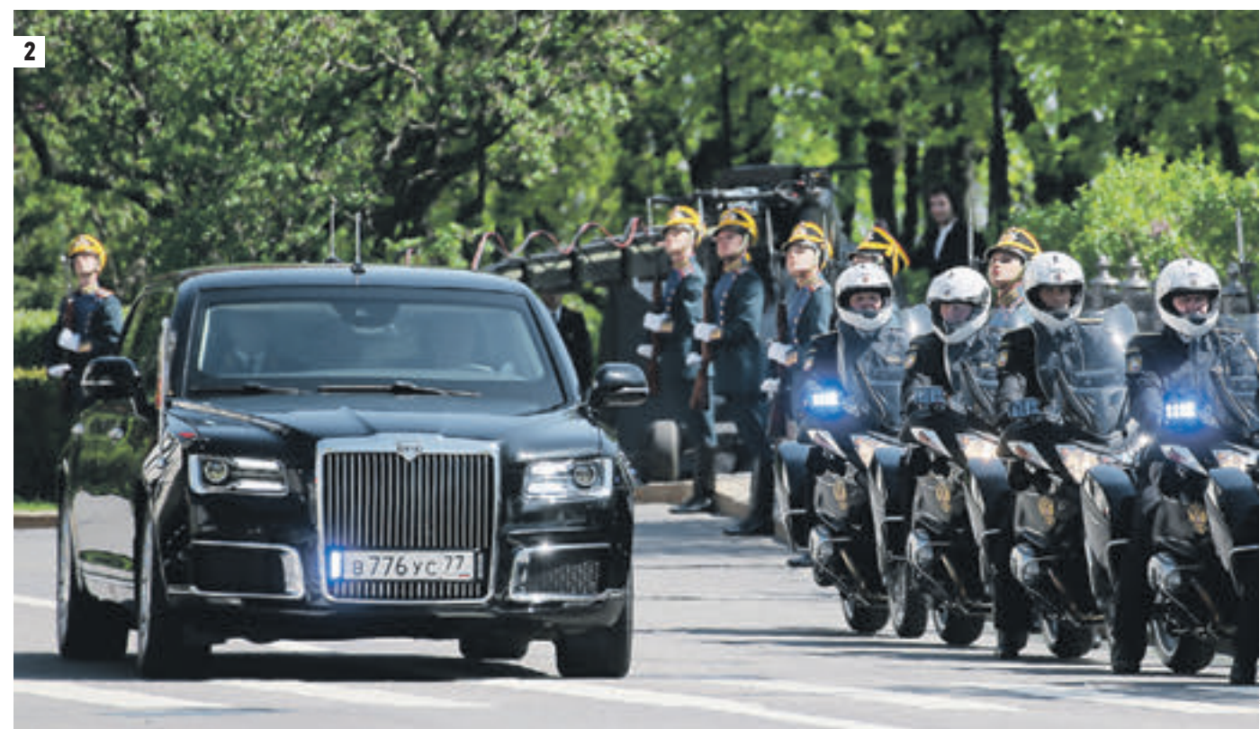
7 мая 2018 года 18:08 Aurus проекта «Кортеж» был представлен 7 мая — на этом авто президент России приехал на инаугурацию (2)