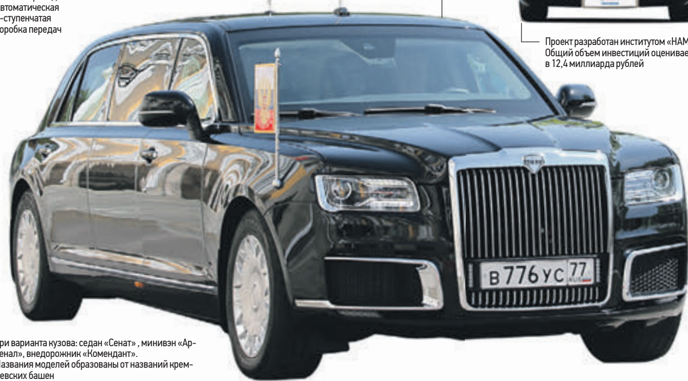
Три варианта кузова: седан «Сенат», минивэн «Арсенал», внедорожник «Номенданти». Названия моделей образованы от названий кремлевских башен

Четыре комплектации: Бизнес, Премиум, Люкс, Эксклюзив. Стоимость от 6 миллионов рублей