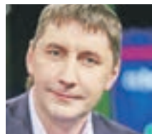
ВИКТОР ПАНИН ПРЕДСЕДАТЕЛЬ ВСЕРОССИЙСКОГО ОБЩЕСТВА ЗАЩИТЫ ПРАВ ПОТРЕБИТЕЛЕЙ ОБРАЗОВАТЕЛЬНЫХ УСЛУГ

мость, и она обостряется с каждой новой сигаретой. Людей зависимых необходимо лечить. Рекомендую им обратиться в наркологический диспансер, там могут помочь. К тому же необходимо доказать, что курение происходило в рабочее время. Воспитатели ведь работают по сменам. Их рабочий день часто заканчивается раньше, чем у других людей. Поэтому необходимо выяснить, был ли это перерыв, или сотрудники уже закончили выполнение своих обязанностей на момент фотосъемки. Только тогда мы сможем дать объективную оценку.