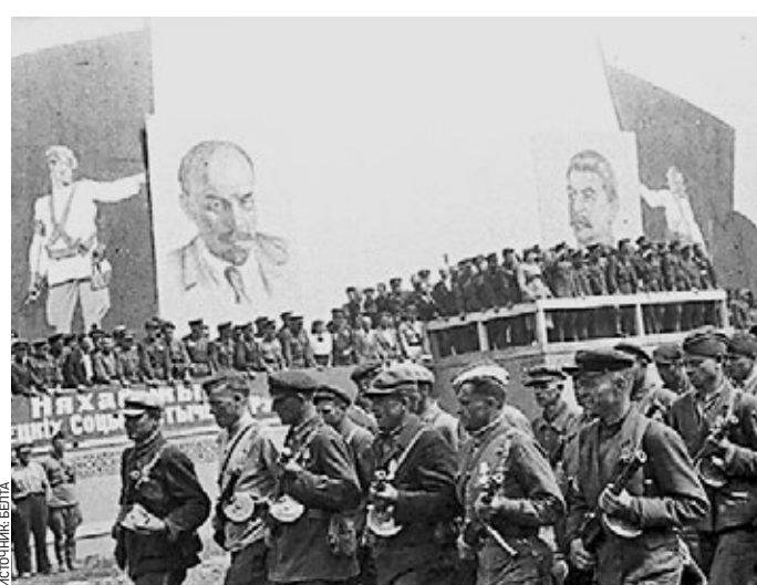
16 июля 1944 года. Партизаны идут по улицам Минска

Минск был освобожден от немецко-фашистских захватчиков 3 июля 1944 года. И уже через две недели, 16 июля, столица Белоруссии встречала свое первое победное шествие.