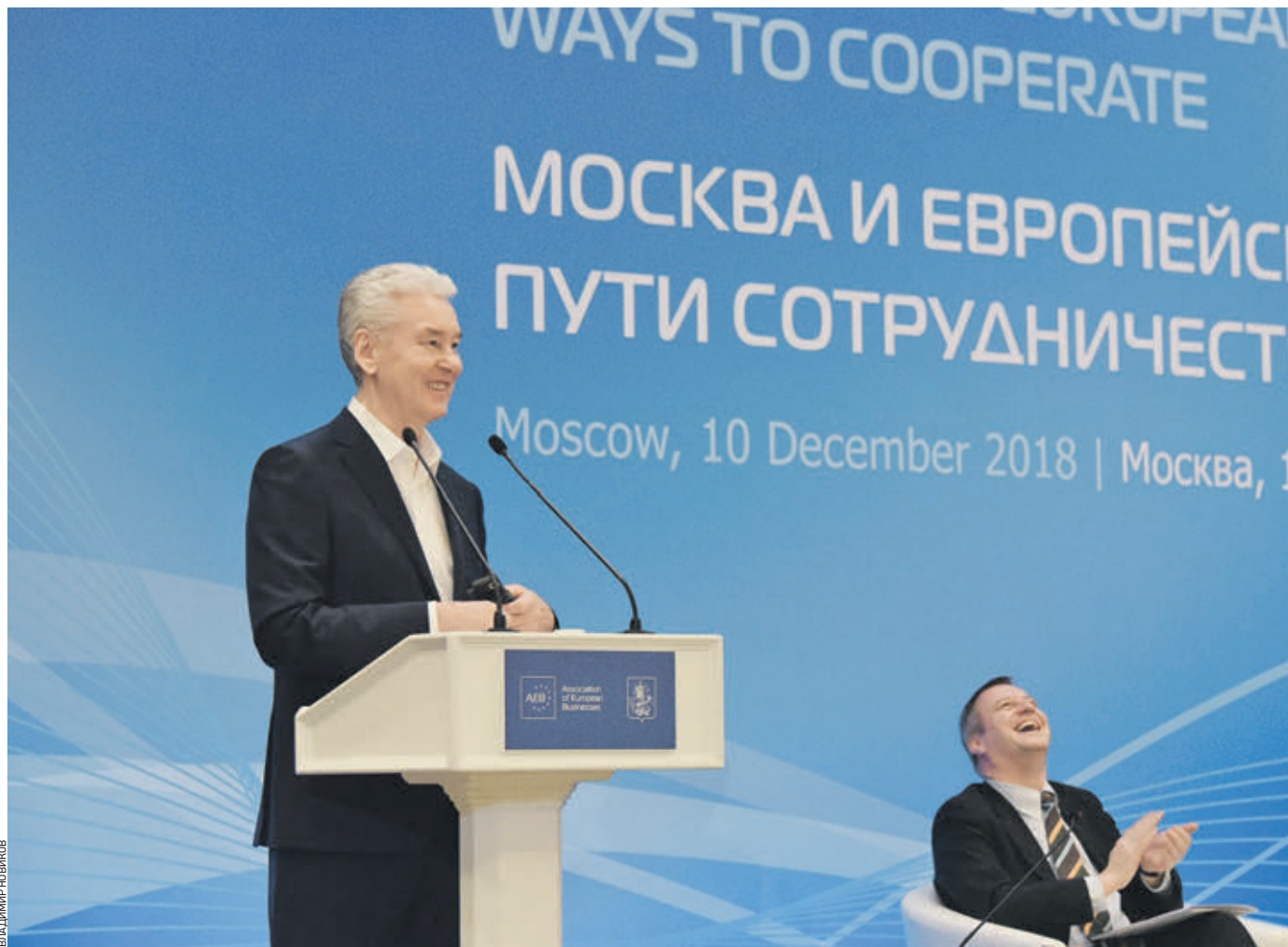
Вчера 17:09 Мэр Москвы Сергей Собянин выступил перед представителями европейской ассоциации бизнеса. Председателю правления ассоциации Йохану Вандерплаетсе (сидит в кресле) заявления главы столицы России пришлось по душе

— Это говорит о высокой осведомленности и определенной доле оптимизма, — ответил Сергей Собянин. По его словам, европейские бизнесмены — важнейшие партнеры Москвы, несмотря на внешнеполитические события, в том числе введенные ранее санкции. — Несмотря на все проблемы, бизнес идет своей дорогой, и в последние годы мы наблюдаем увеличение товарооборота между нашей столицей и европейскими странами. Некоторые коллеги приезжали в Москву, жаловались на санкции, возможно, думали, что город будет меняться в худшую сторону. Однако предварительные итоги даже этого года говорят, что Москва вышла в позитивные