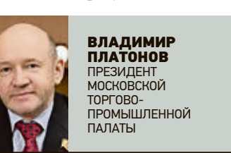
ВЛАДИМИР ПЛАТОНОВ ПРЕЗИДЕНТ МОСКОВСКОЙ ТОРГОВО-ПРОМЫШЛЕННОЙ ПАЛАТЫ

Не факт — все зависит от того, чем вы планируете заниматься. На 81 вид работ можно приобрести у города патент — и сразу освободиться от необходимости платить налог на имущество, НДС, торговый сбор. Если этот вариант не подходит — существует еще и упрощенная система налогообложения. Кстати, это очень важно, — для тех, кто использует такую упрощенную систему, Государственное бюджетное учреждение «Малый бизнес Москвы» бесплатно оказывает услугу заполнения налоговых деклараций.