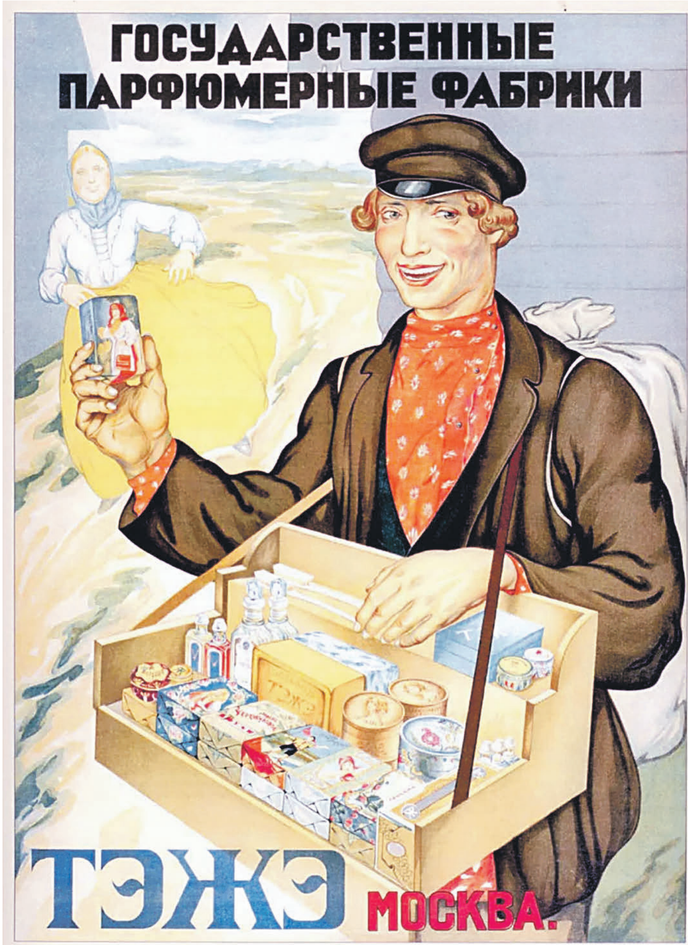
1928 год. Рекламный плакат «ТЭЖЭ», или Треста эфирно-жировых эссенций. Предприятие производило кремы, которыми пользовались наши прабабушки. Реклама была всегда — она лишь время от времени меняла носителя