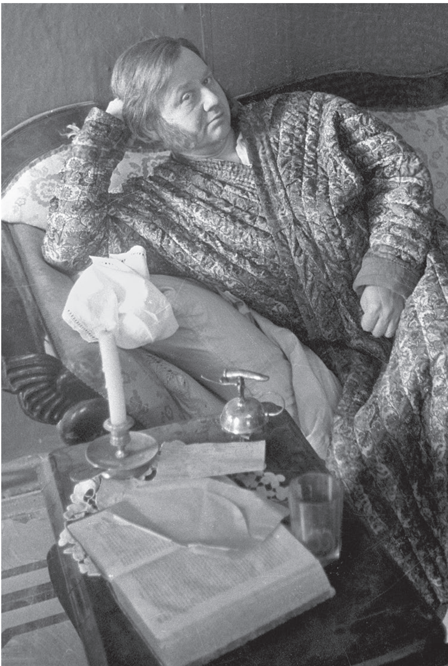
Герою романа Гончарова Илье Ильичу Обломову (его роль исполнил Олег Табаков) никакие тренинги и курсы по управлению временем помочь бы не смогли, считают психологи

людей более глубоких и осознанных это про концентрацию, умение подышать пять минут, медитировать то есть, умение выделять время на создание ресурсного состояния. Если человек не очень «осознанный», он пытается контролировать действительность. Он начинает все планировать, наполняет свой день списками и планами. Один из самых знаменитых исследователей личной эффективности Дэвид Аллен более двадцати лет консультирует руководителей крупных корпораций — в том числе Ford Foundation и «Всемирного банка». Его книга «Как привести дела в порядок: искусство продуктивности без стресса» произвела большой ажиотаж и была переведена на пятнадцать языков. Наш мозг, считает Аллен, постоянно нагружен перечнями текущих дел и планов.