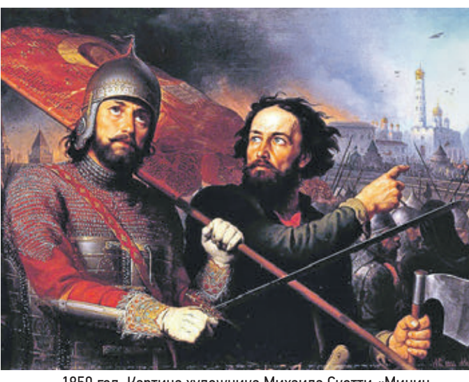
1850 год. Картина художника Михаила Скотти «Минин и Пожарский»

В этот день 202 года назад на Красной площади был открыт монумент героям войны с польскими интервентами во времена Смуты.