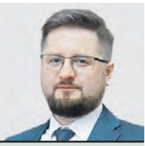
АЛЕКСАНДР ТВЕРСКОЙ ЗАМЕСТИТЕЛЬ РУКОВОДИТЕЛЯ ДЕПАРТАМЕНТА ОБРАЗОВАНИЯ И НАУКИ МОСКВЫ

Сегодня московские колледжи — это образовательные центры с мастерскими и производственными площадками, оборудованными по последнему слову техники. Именно на этих площадках проходят подготовку победители европейских и мировых чемпионатов профессионального мастерства, которые представляют столицу в составе национальной сборной.