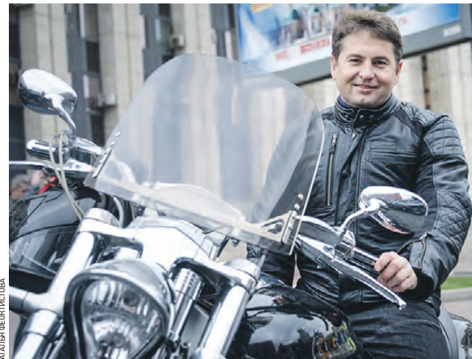
14 октября 2018 года. Глава столичного Департамента торговли и услуг Алексей Немерюк на закрытии мотофестиваля

вполне понятна. Другой способ объяснить что-то — через игру. Но есть и серьезные разговоры, ведь сыновья — это будущие мужчины. Да и в целом, считаю, что у человека все должно быть гармонично. Сам он тоже старается быть примером для подрастающих мальчишек — ходит в спортзал или может устроить утреннюю физкультминутку дома.