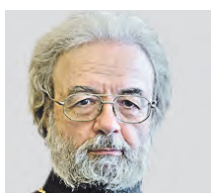
АЛЕКСАНДР ИЛЬЯШЕНКО ПРОТИБЕРЕЙ РУССКОЙ ПРАВОСЛАВНОЙ ЦЕРКВИ

Я согласен с депутатом Виталием Милоновым, который считает, что курсы личностного роста не имеют никакого научного обоснования. Важно понять, что главная задача воспитания личности — это гармоничное его развитие в духовном, нравственном, интеллектуальном, эстетическом и патриотическом направлениях. Заменить все это какими-то сиюминутными курсами с результатом на три минуты значит засорять мозги и тратить свое драгоценное время на бесполезное дело. Более того, иногда такие курсы формируют в человеке устойчивое стремление добиться цели любой ценой. Это безнравственный поступок, который приводит к негативным последствиям. Не только личностным, но и социальным, так как вредит обществу.