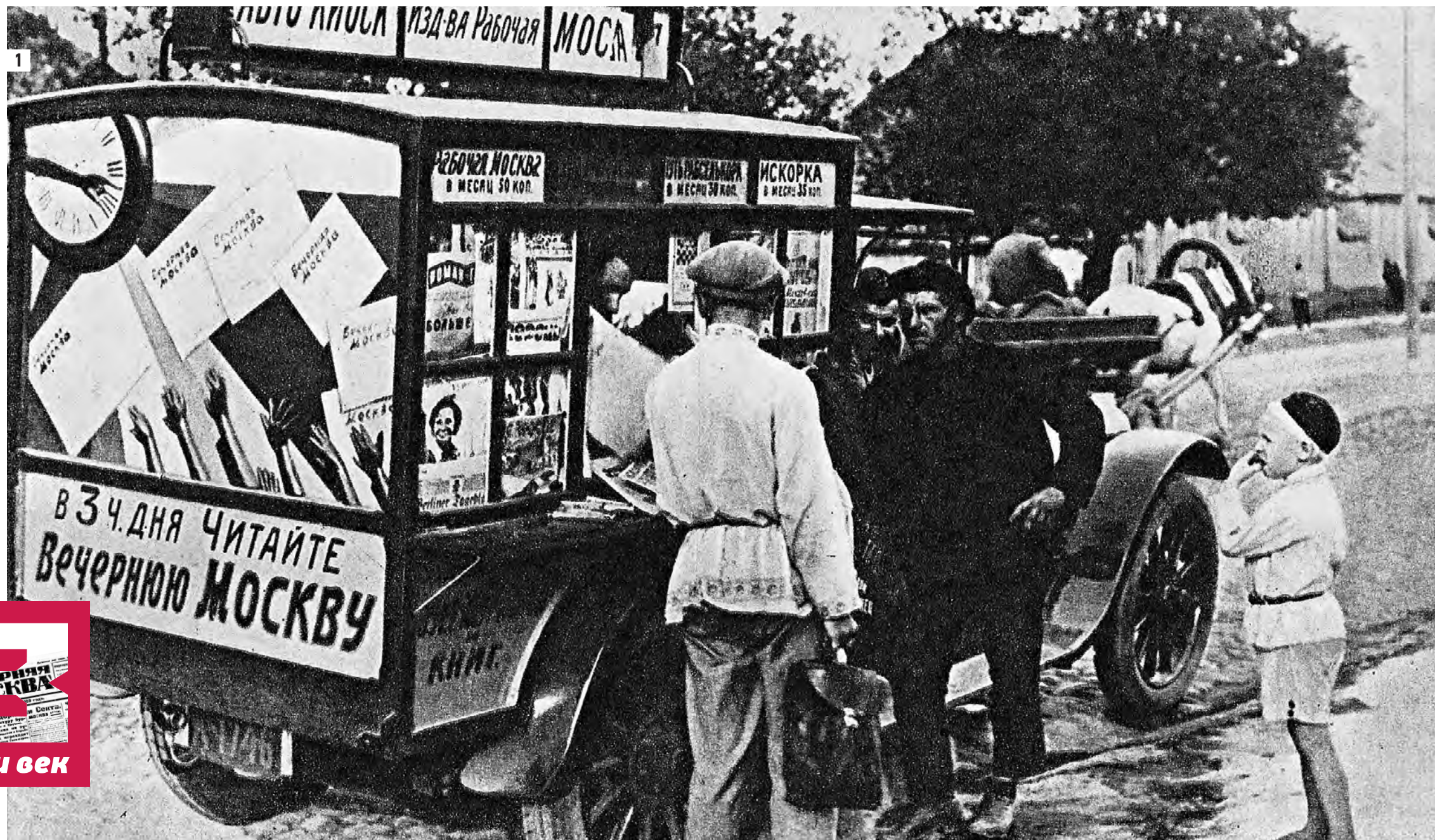
1927 год. Автомобильный киоск, продающий газеты в Москве (1) Реклама Сберегательной кассы. Выпуск «Вечерней Москвы» от 13 февраля 1940 года (2) Анонс цветного художественного фильма «Илья Муромец» на страницах «Вечерки». Номер от 2 апреля 1958 года (3)

Казалось бы, какая реклама в суровые военные годы?! Правильный ответ: реклама суровых времен. Площадь рекламного пространства ужимается до «подвала», а иногда и до малоприметной колонки в подвале четвертой, последней полосы. При первом же взгляде на «Вечерку» того времени бросаются в глаза кричащие объявления с жирным заголовком «Требуются». Московские предприятия круглосуточно работали на нужды фронта и остро нуждались в трудовых кадрах. Требовались каменщики, плотники, строители, газосварщики и т.п., а также преподаватели, которые обучили бы рабочих специальностям ребят, окончивших девять классов школы. Обращают на себя внимание объявления о защитах диссертаций и о конкурсах о замещении должностей в вузах страны. Это свидетельство повышенного внимания государства к научным кадрам! Сохранилась и реклама театров, концертов, кино.