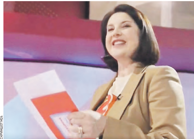
10 ноября 19:24 Фигуристка Ирина Слуцкая объявляет в эфире телеканала «Москва 24» имена победителей лотереи