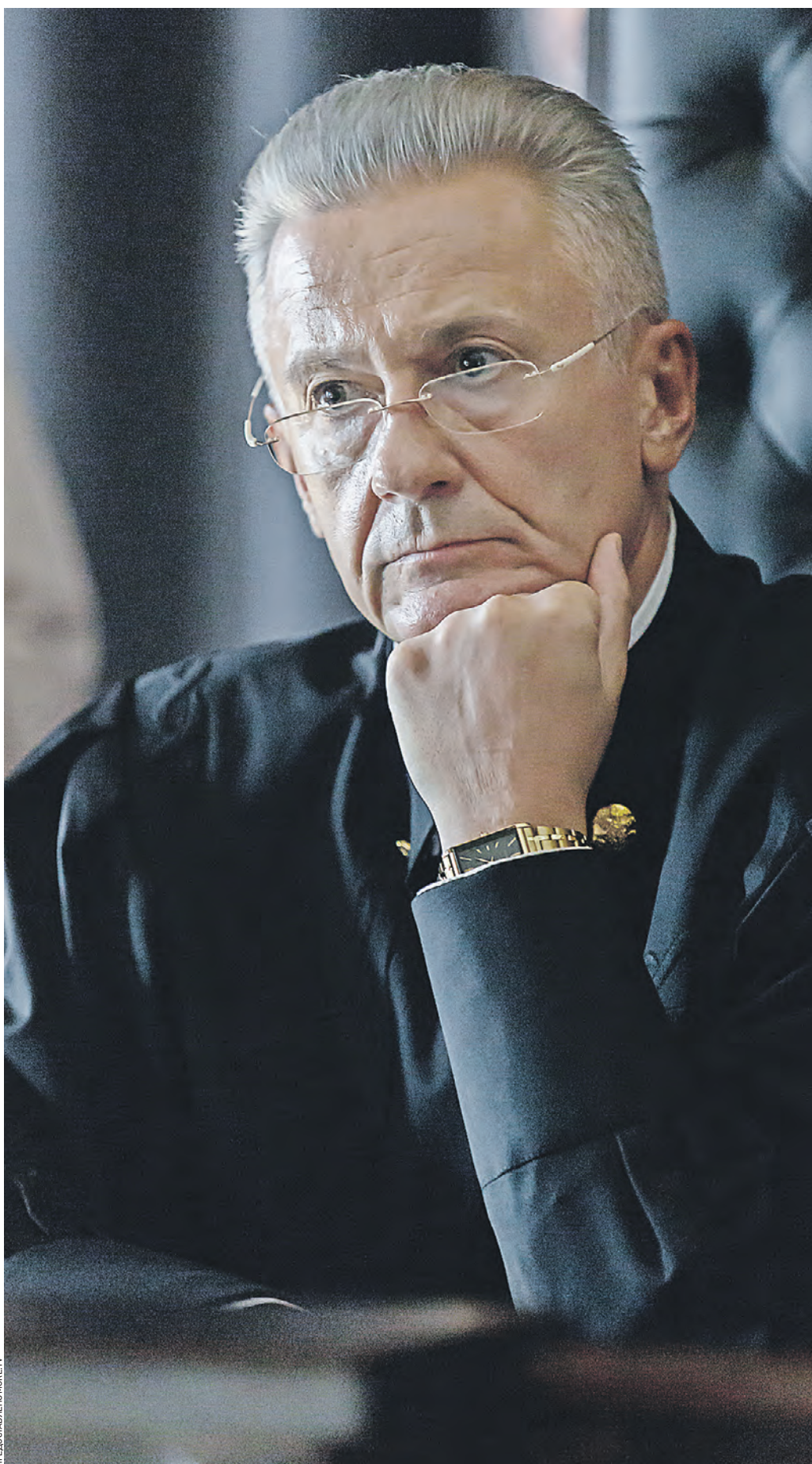
Кадр из сериала «Ваша честь»: народный артист Российской Федерации Олег Меньшиков в роли судьи Михаила Романова. Можно гарантировать: вы не останете удивляться тем переменам, которые произойдут с его персонажем, и будете бесконечно спорить с собой — оправдать и понять его или все же осудить, невзирая ни на какие обстоятельства

Любовь родителей чиста и безгранична. Но иногда стирается грань между справедливостью и беззаконием — можно ли это оправдать своей любовью? Что важнее: профессиональная честь или все же родительский долг? Простительно ли зло во имя блага? Дай бог, чтобы все нашли ответы не в реальной жизни, а в истории, разыгранной блистательным актерским составом.