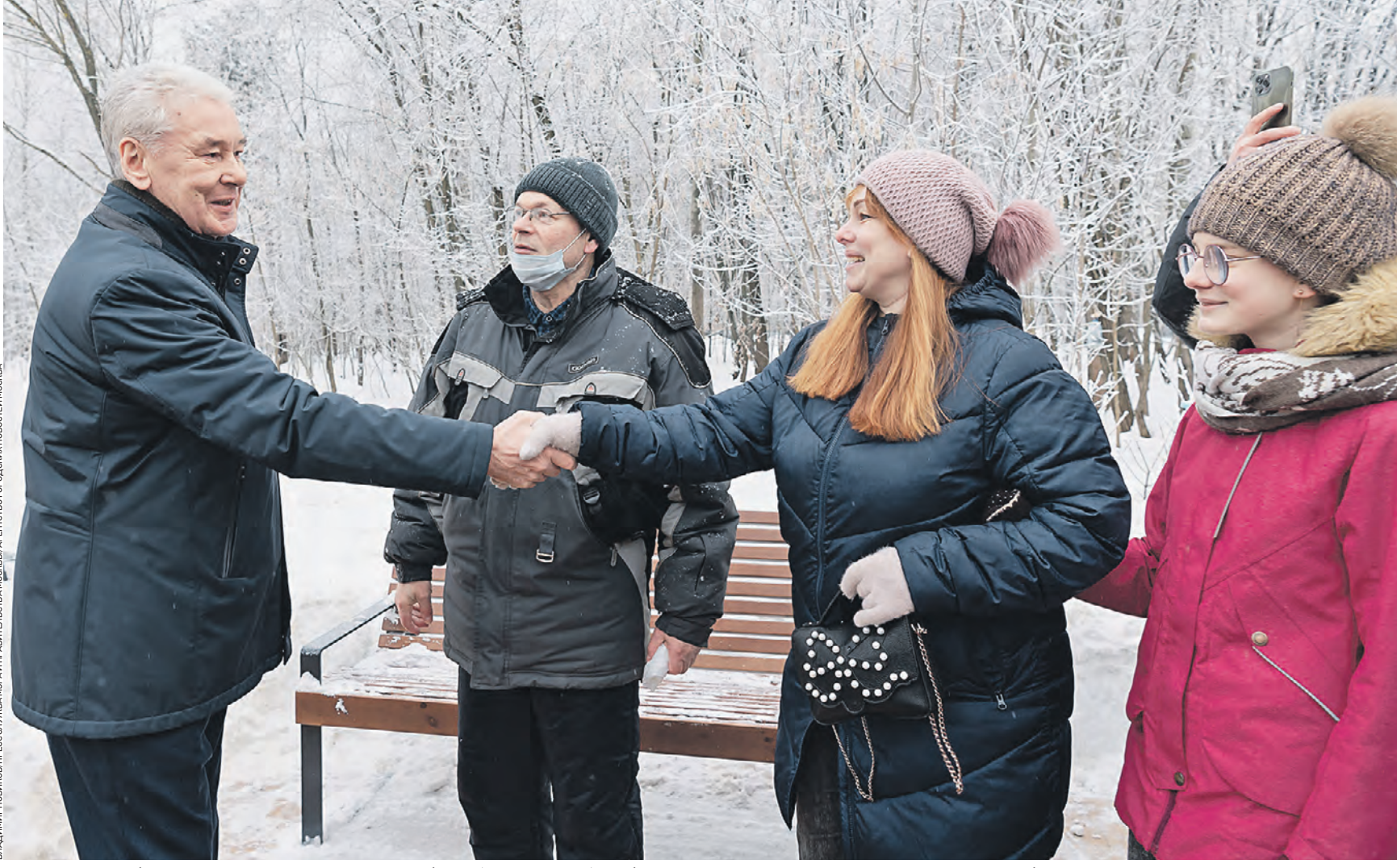
30 декабря 2021 года. Мэр Москвы Сергей Собянин (на фото слева) пообщался с жителями района Новоосино, где после благоустройства части Салтыковского лесопарка открылся пункт проката спортивного инвентаря. Зимой здесь можно взять напрокат лыжи и тюбинги для катания со снежных горок

В этом году на севере города будут реализованы четыре больших проекта. Так, в Левобережном районе приведут в порядок набережную Канала имени Москвы и прилегающие к ней территории. — Общая площадь благоустройства составит 13,7 гектара, — уточнил Сергей Собянин. — Основная задача — создать комфортную зону отдыха, которая будет притягательной для родителей с детьми, поклонников здорового образа жизни и всех, кому нравится проводить свободное время на природе. Для безопасности вдоль берега установят ограждение. А рядом с набережной на территории, которая сейчас пустует, сделают зону отдыха с площадками для воркаута и пляжного волейбола. — В Молжаниновском районе возьмем в работу Синявинский сквер, — продолжил Сергей Собянин. — Сейчас это по сути пустырь с пожарными прудами. В сквере высадят деревья и кустарники, вдоль новеньких тротуаров установят фонари. После благоустройства здесь появятся современные спор-