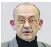
ВЛАДИМИР ВОЙТКОВ ПРОФЕССОР БИОЛОГИЧЕСКОГО ФАКУЛЬТЕТА МГУ ИМЕНИ М. В. ЛОМОНОСОВА

Почти половина россиян считают, что наука переживает упадок. И как вам?