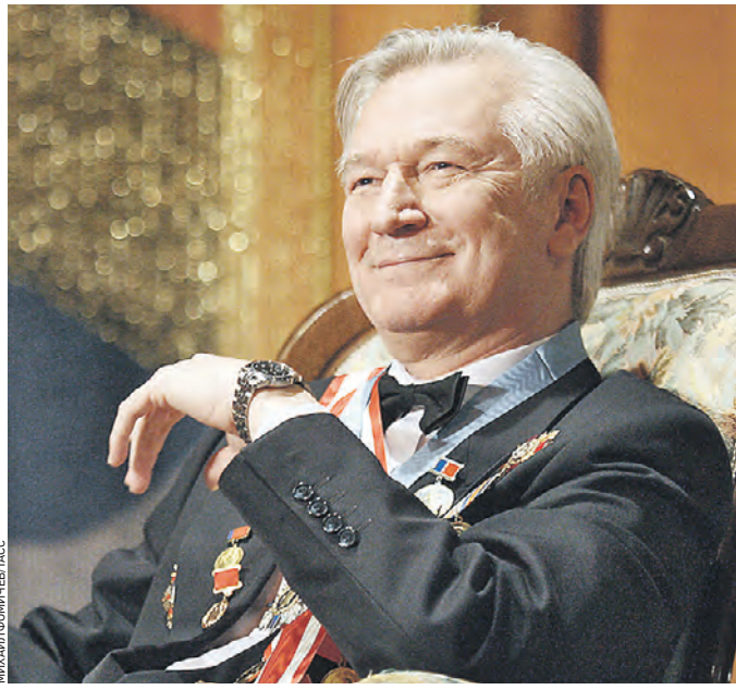
20 марта 2007 года. Аристарх Ливанов на праздновании 60-летия в Центральном доме актера

В 1986 году в театральной жизни Ливанова произошли перемены. Он ушел из Театра имени Моссовета, продолжил карьеру в Центральном академическом театре Российской армии. Но играл там недолго. Через год перешел во МХАТ имени Горького. Там он и служил до 2020 года. — Аристархом очень любил работать все наши актрисы, потому что им важно, чтобы в дуэте был сильный партнер, — отметил Андрей Житинкин. — Ливанов в жизни довольно скуп на эмоции, но за этим всегда стоит какая-то тайна и невероятная глубина. Он, как говорится, умеет играть без слов. Еще и поэтому его очень любили кинорежиссеры. Хочу пожелать ему здоровья, гармонии и побольше новых ролей на радость публике. После роли белого офицера Сержа Алексеева в приключенческой картине «Государ-