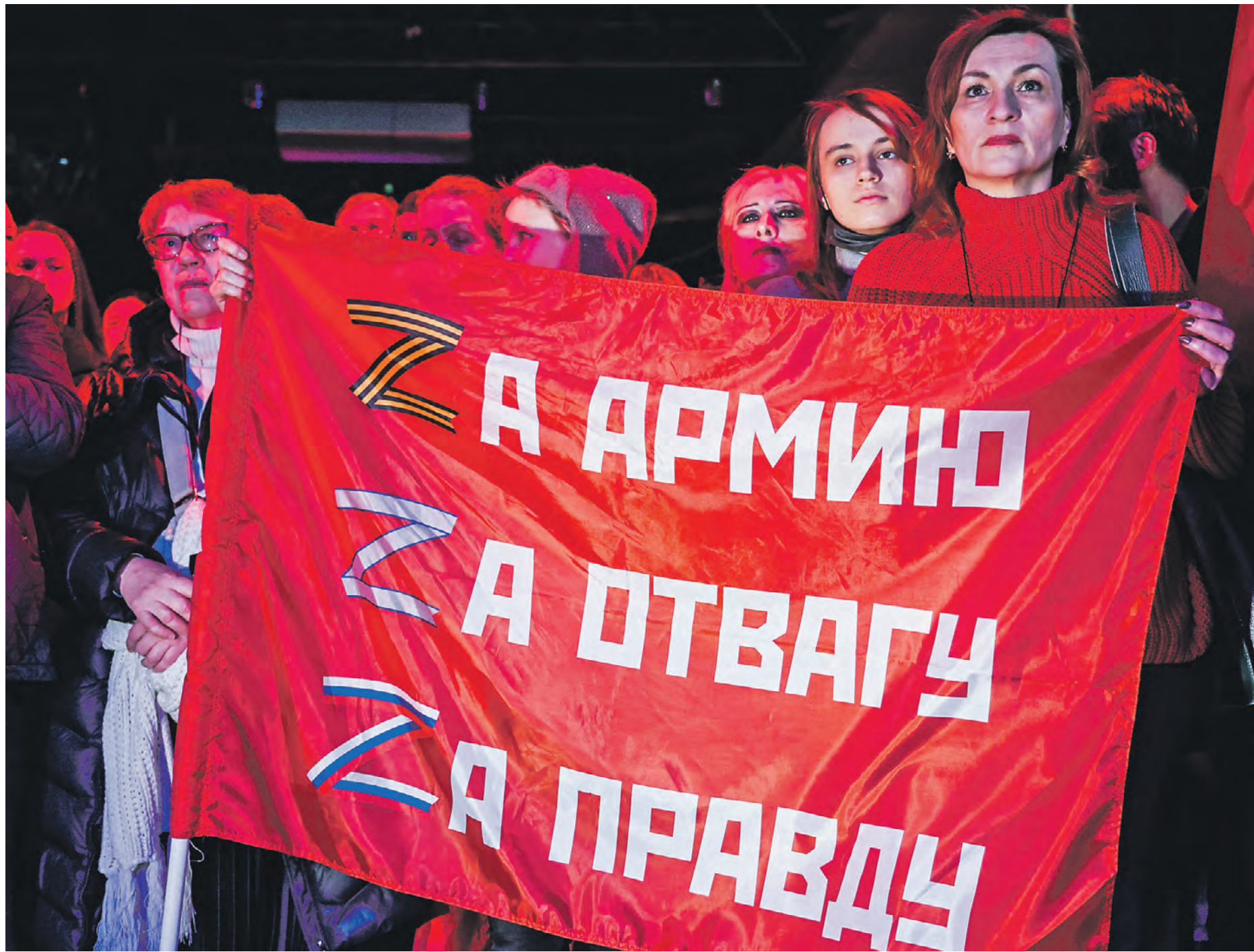
9 марта 2022 года. Москва. Зрители на концерте в поддержку российской армии и спецоперации РФ на Донбассе в одном из столичных клубов

Танцуем в кругу и хмелеем от ласк... А где-то врагу не сдастся Донбасс! Шахтерская воля — судьба без прикрас, Средь русского поля — он встал за всех нас! И вот уж с орудий снимают чехлы — Не добрые люди, братишки-хохлы, Крещенные тоже, но вросшие в ложь — Где лица, где рожи — не сразу поймешь! Вам — злоба, а нам — вера, Нам — край, а вам — откос! Вам Байден и Бандера, Нам — Иисус Христос! И песня поется, как было не раз: «Врагу не сдастся наш гордый...» Донбасс!