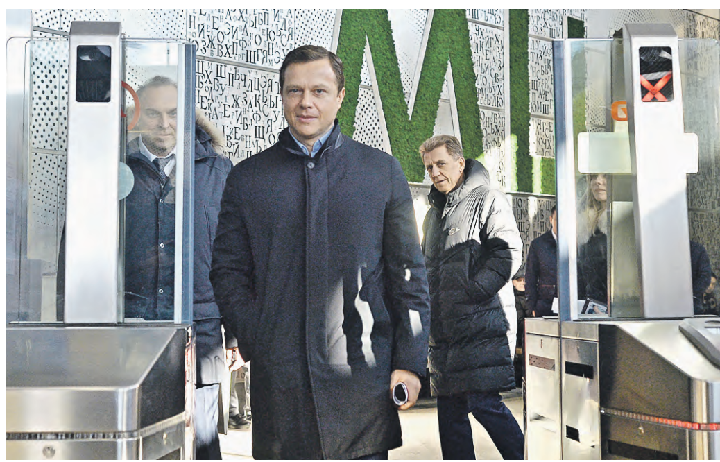
Вчера 9:41 Заместитель мэра Москвы Мансим Ликсутов (в центре) проходит через турникет с помощью системы Face Pay на станции «Кутузовская» Московского центрального кольца

Вчера сервис оплаты проезда Face Pay заработал на станции «Кутузовская» Московского центрального кольца.