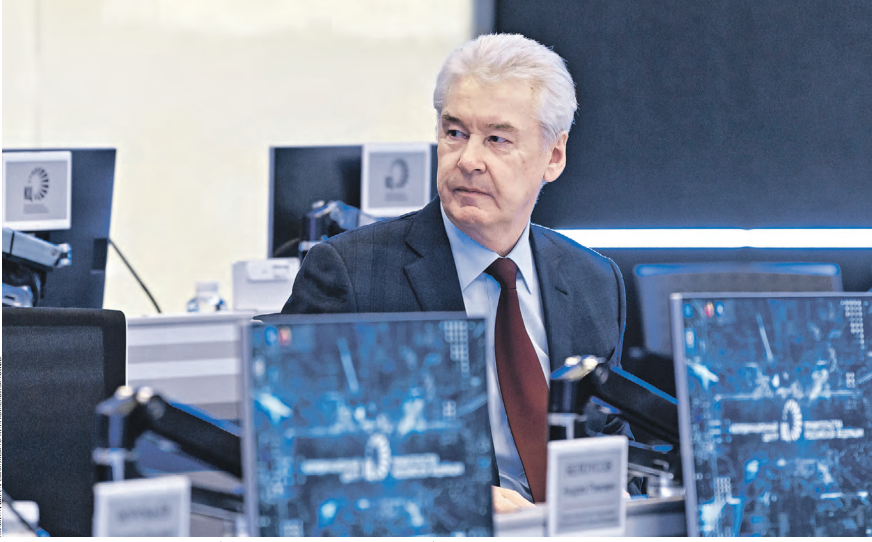
Вчера 9:27 Мэр Москвы Сергей Собянин во время селекторного совещания рабочей группы Госсовета страны по экономическим вопросам и противодействию распространению коронавирусной инфекции

Селекторное совещание рабочей группы Госсовета России было посвящено проблемам бизнеса. Поддержку предпринимателям решено оказывать на всех уровнях: и федеральном, и региональном. — Обсудили с коллегами комплекс мер поддержки граждан, экономики и бизнеса, который будет включен в план первоочередных действий правительства России по противодействию санкционному давлению, — заявил Сергей Собянин. — Проинформировал глав регионов о развитии в налоговой, бюджетной, градостроительной и иных сферах, принятых на федеральном уровне. Обсудили программу льготного кредитования системообразующих предприятий. По его словам, поступившие предложения от регионов по стабилизации ситуации в экономике и социальной сфере в кратчайшие сроки будут обобщены и включены в план первоочередных действий властей. Выступая на совещании, заместитель председателя пра-