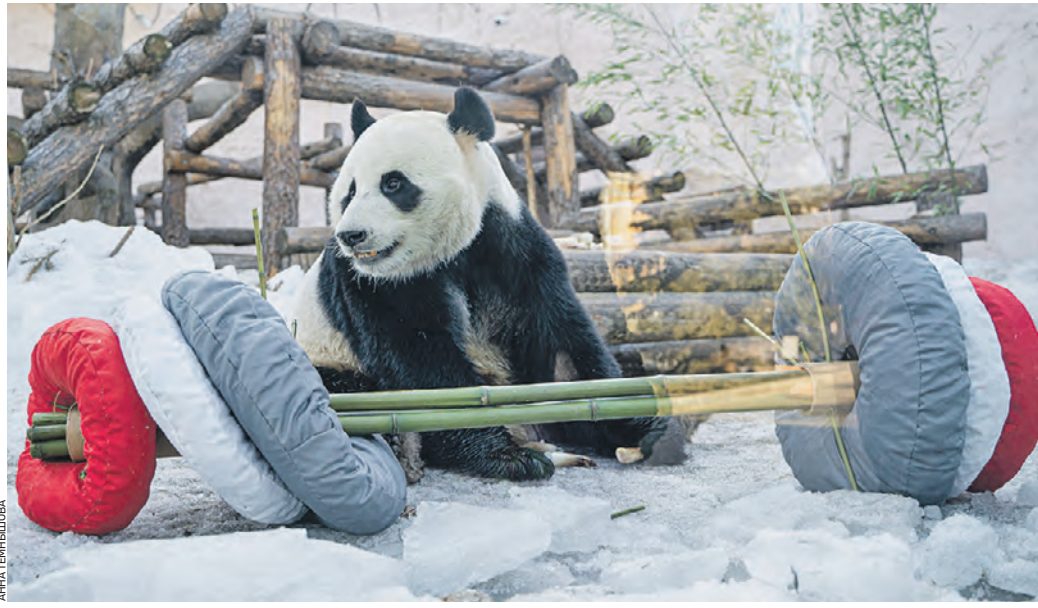
Вчера 16:20 Панда Жуи сидит около «штанги»: гриф заменяют стебли бамбука, а в тканевых «блинах» спрятана морковь