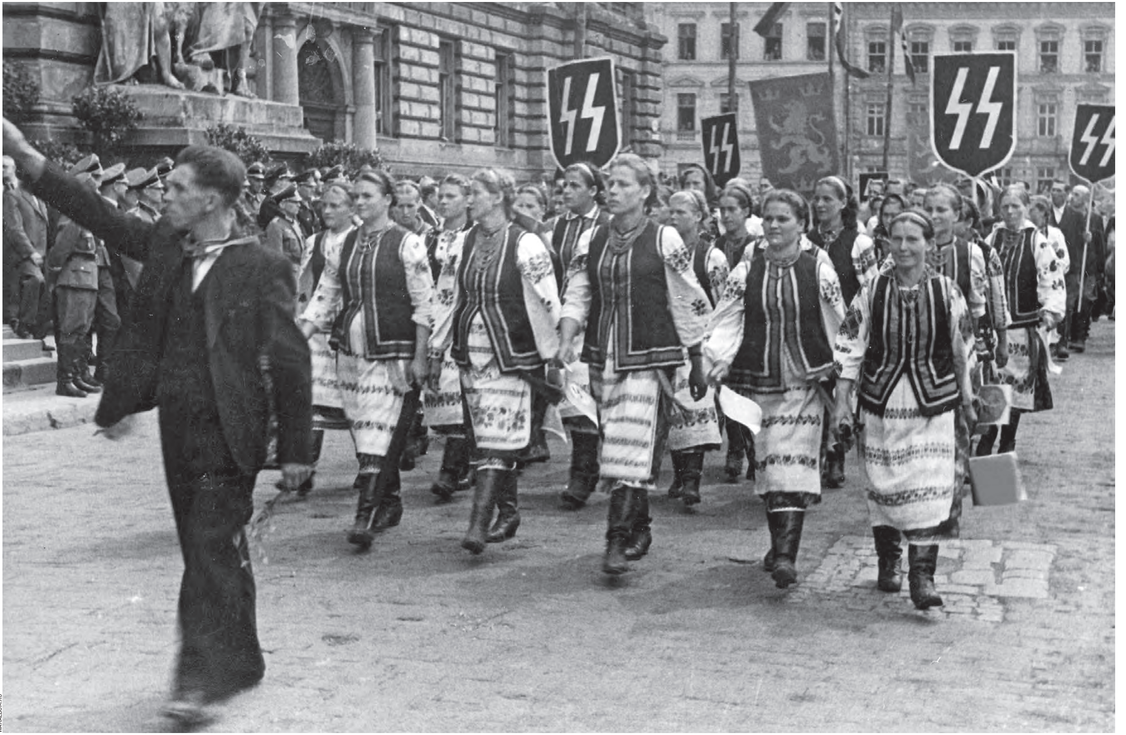
Вот она, поступь воинствующего фашизма... Этот исторический кадр был сделан в 1941 году на параде УПА (Украинской повстанческой армии — организации, ныне запрещенной в России) в Львове. Наряженные в национальные костюмы девушки несут символы фашизма, тоже ныне запрещенные. Как страшно и горько смотреть на это зло. Еще горше — потому, что оно вернулось...