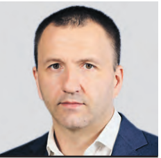
ПАВЕЛ КРАСНОРУЦКИЙ ПРЕДСЕДАТЕЛЬ РОССИЙСКОГО СОЮЗА МОЛОДЕЖИ