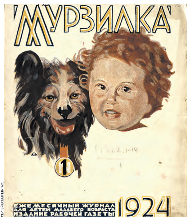
Первый выпуск журнала «Мурзилка» хранится в Российской книжной палате