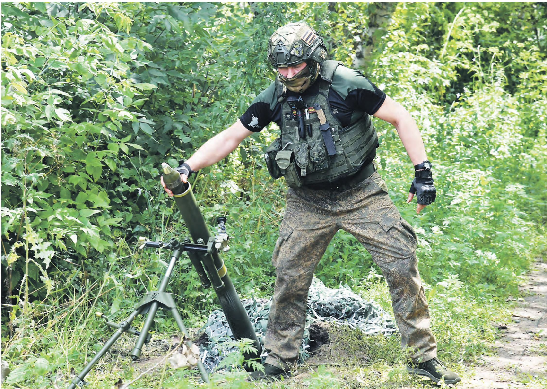
18 июля 2023 года. Работа разведчиков 1-й танковой армии Западной группы войск на Сватовском направлении. Минометчик готовится выстрелить по опорному пункту Вооруженных сил Украины

Россия от гибкой обороны постепенно переходит к масштабным атакам