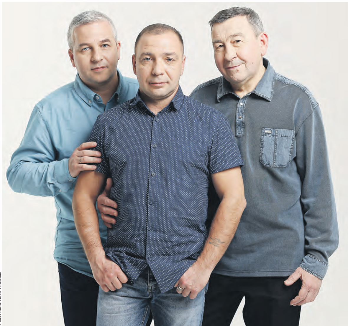
ПРЕДСТАВЛЕНЫ ДИТТ. МОСКВА

Чтобы привлечь молодежь, нужно уделять больше внимания подготовке кадров в колледжах, техникумах, нужна пропаганда работы на производстве в школах, стоит больше показывать