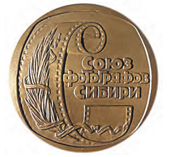
Медаль Союза фотографов Сибири, которую вручили Наталье Шатохиной