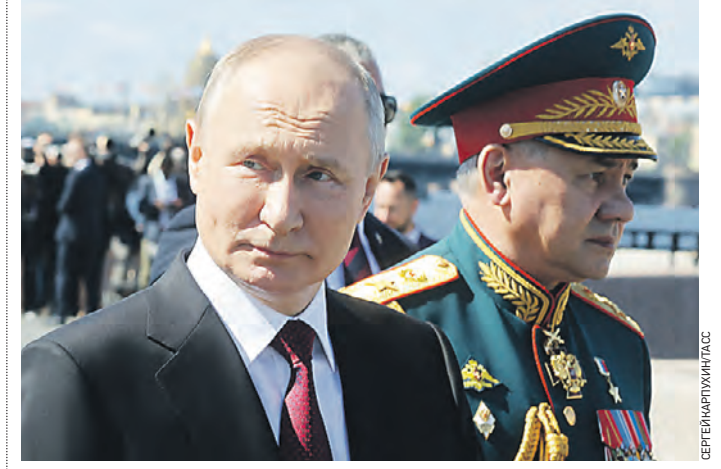
Вчера 11:55 Президент России Владимир Путин и министр обороны РФ Сергей Шойгу на Главном военно-морском параде по случаю Дня ВМФ в Санкт-Петербурге

Вчера президент РФ Владимир Путин поздравил моряков с Днем Военно-Морского Флота, а также подвел итоги саммита Россия — Африка.