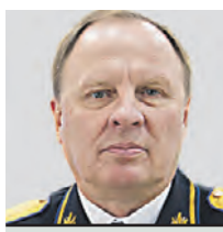
СЕРГЕЙ ЛИПОВОЙ ПРЕДСЕДТЕЛЬ ПРЕДСИДИМА ОБЩЕРОССИЙСКОЙ ОРГАНИЗАЦИИ «ОФИЦЕРЫ РОССИИ», ГЕРОЙ РФ

Блокадники Ленинграда служат нам примером того, как нужно сохранять самообладание и вести себя в самые тяжелые времена. Большинство из них после столь трагических событий стали знакомыми людьми в пределах всего государства в самых разных областях науки, промышленности и искусства. До сих пор сложно в полной мере оценить то, как повлияла блокада Северной столицы на хронологию войны. Ленинград, испытывая тяжесть осад, голода и бесконечных бомбежек, оттянул на себя большое число фашистских войск. Защитникам Москвы было во сто крат тяжелее вести оборону столицы без этой 900-дневной жертвы ленинградцев. По сей день на протяжении долгих десятилетий благодарные потомки преклоняют колено перед каждым, кого тронула эта трагедия. Многих эти ужасы застали в юном возрасте. При мужественной обороне Ленинграда погибло множество людей как гражданских, так и военных. Наши поисковые отряды спустя почти 80 лет после снятия блокады находят останки солдат, отдавших жизни в те роковые годы. С каждым годом число доживших до наших дней ветеранов Великой Отечественной войны, в том числе и блокадников, неумолимо уменьшается. Необходимо создать условия, при которых свидетели Победы смогли бы передать знания о том непростом времени нашему подрастающему поколению.