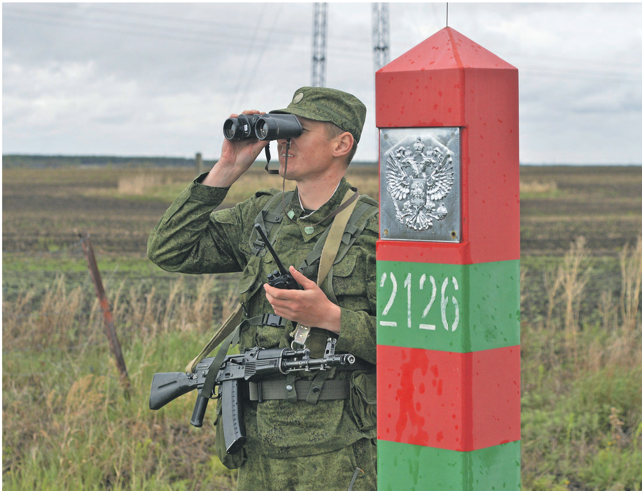
13 мая 2022 года. Военнослужащий пограничной службы ФСБ РФ по Челябинской области на дежурстве по охране российско-казахстанской границы. Кстати, из Казахстана часть русских мигрантов уже «просят»

Правительство Казахстана изменило правила въезда и пребывания иностранцев в республике. Согласно новому порядку, гражданам стран —