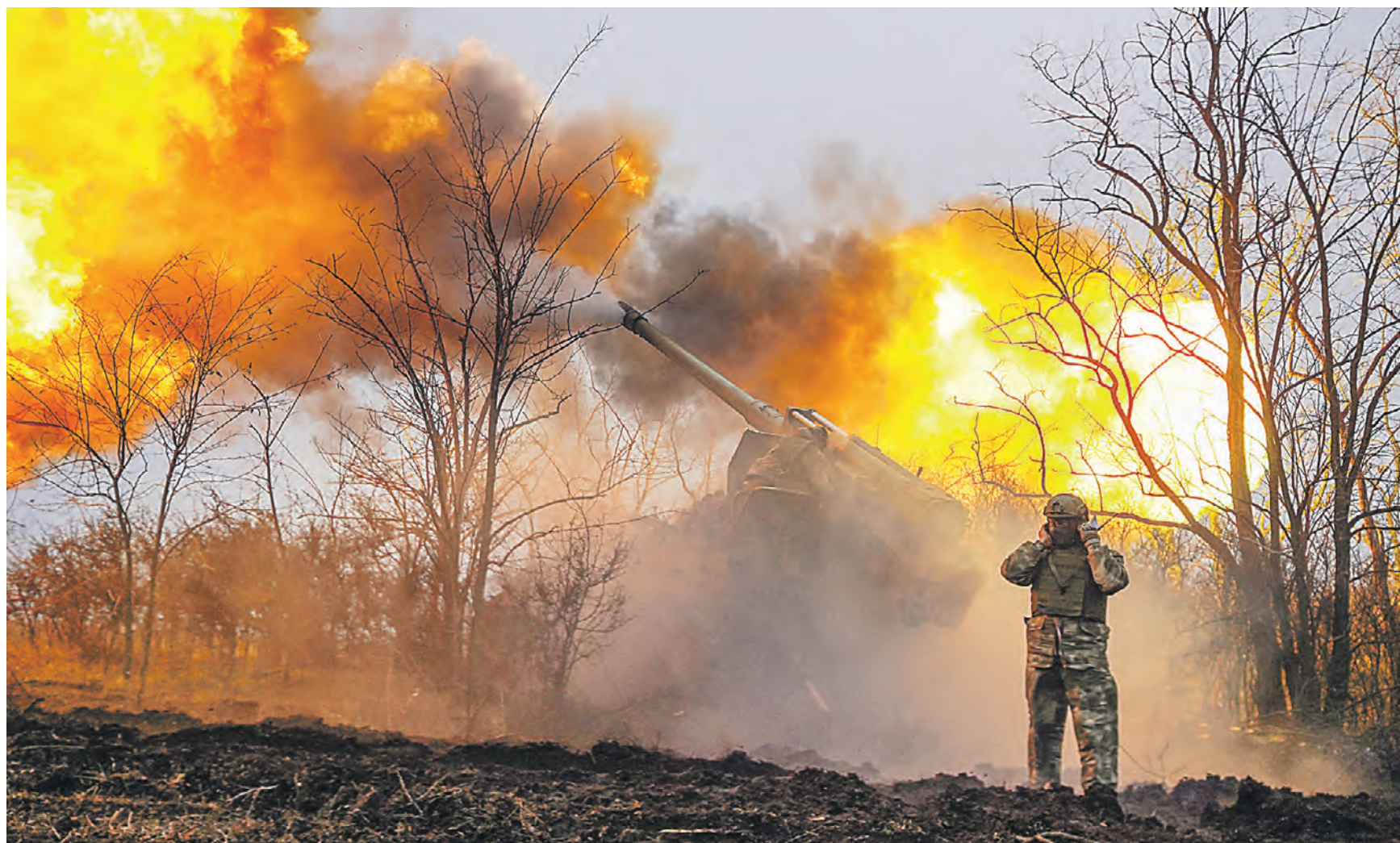
22 января 12:34 Военнослужащий Вооруженных сил России во время боевой работы артиллерийской установки «Гиацинт» в зоне проведения спецоперации в Запорожской области

Помимо этого, Пушилин отметил, что наши войска ежедневно продолжают наступление. — Буквально ежедневно в тех сводках, которые мне поступают, мы видим продвижения наших подразделений. Сейчас боевые действия ведутся в частном секторе Марьинки, — добавил Денис Пушилин. — Противник пока еще продолжает перебрасывать резервы и старается изо всех сил затянуть освобождение этого населенного пункта. Потому что после полного освобождения Марьинки мы выходим в направлении Курахово, Красногоровки — это те населенные пункты, которые оперативно выходить на оперативное окружение Авдеевки.