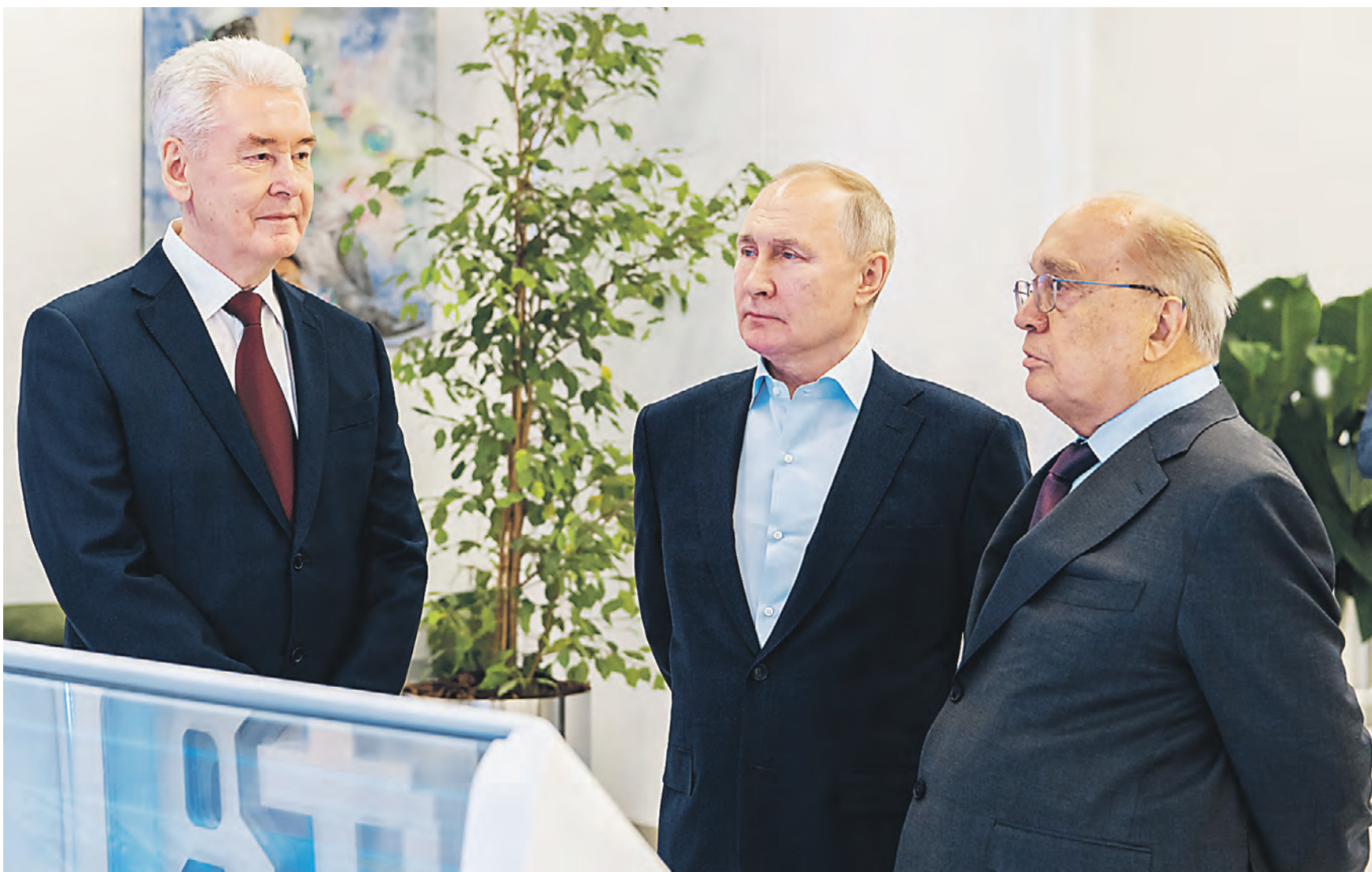
Вчера 14:11 Мэр Москвы Сергей Собянин, президент России Владимир Путин и ректор МГУ им. М. В. Ломоносова Виктор Садовничий (слева направо) на открытии кластера «Ломоносов», который является частью инновационного научно-технологического центра «Воробьевы горы»

Правительство Москвы активно участвует в создании крупнейшего проекта научно-технологического развития России. Строительство десятиэтажного здания кластера «Ломоносов» площадью 65 тысяч квадратных метров было начато в январе 2021 года и завершено ровно через два года. Сергей Собянин представил Владимиру Путину интерактивный макет центра МГУ. Мэр столицы напомнил, что на месте сегодняшнего инновационного центра раньше были гаражи и заброшенная территория.