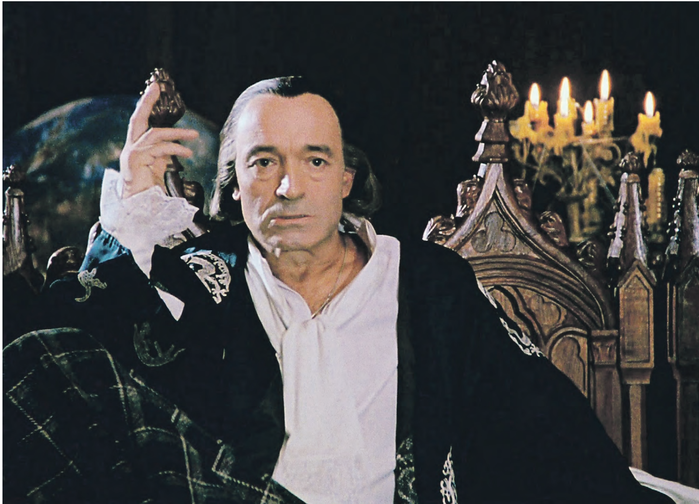
Кадр из фильма режиссера Юрия Кары «Мастер и Маргарита» 1993 года. Воланд в исполнении Валентина Гафта с печалью наблюдал за тем, как изменились москвичи, которых «испортил квартирный вопрос»

В борьбе за имущество люди теряют разум и нравственность