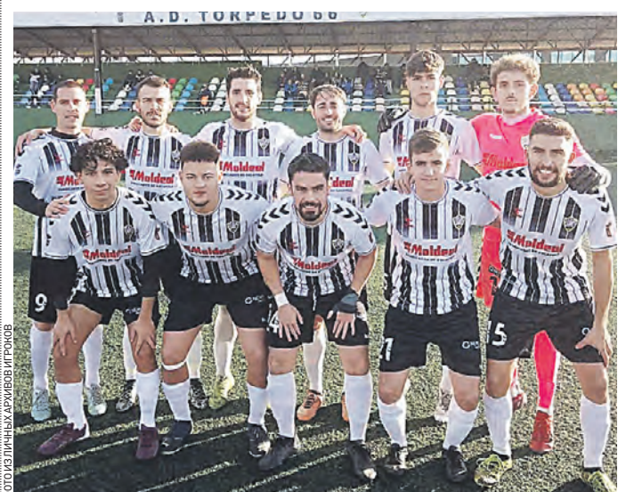
30 сентября 2022 года. Игроки основного клуба «Спортивное объединение Торпедо 66» на домашнем стадионе в преддверии матча