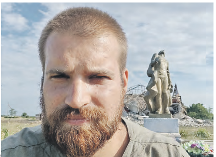
1 августа 2022 года. Боец с позывным Мэйсон в селе Урожайное (ДНР)