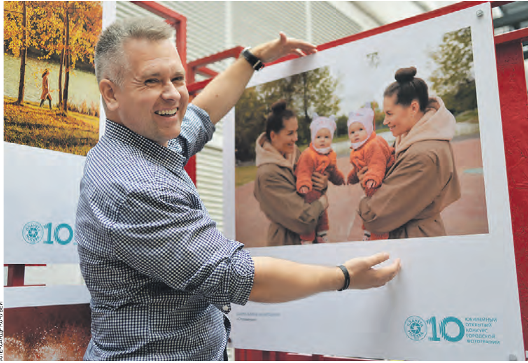
12 августа 13:46 Фотокорреспондент «Вечерней Москвы» Анатолий Цымбалюк показывает свою работу «Отражение» на выставке десятого юбилейного конкурса «Планета Москва»