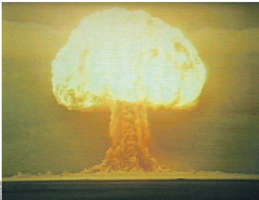
Огненное облако, образовавшееся после взрыва советской водородной бомбы РДС-6с — первого в мире устройства с использованием термоядерной энергии, годного к военному применению

Чуть более 70 лет назад, 12 августа 1953 года, на полигоне в Семипалатинске была испытана первая в мире водородная бомба.