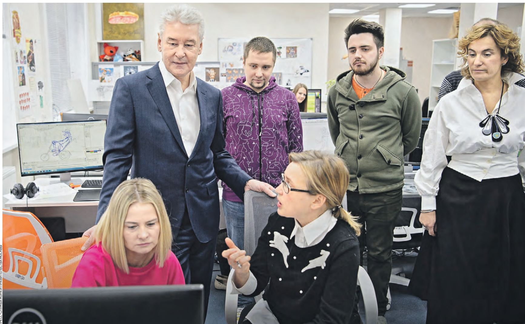
30 января 2019 года. Мэр Москвы Сергей Собянин (крайний слева во втором ряду) пообщался с работниками киностудии «Союзмультфильм». Сегодня на ее базе создан технопарк, где развивают все анимационные техники — от кукольного производства до традиционной рисованной и 3D-анимации