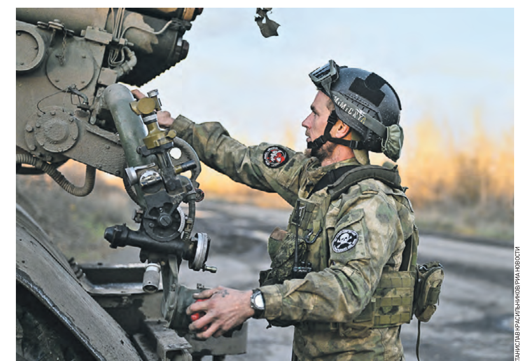
Российский наводчик готовит к боевой работе реактивную систему залпового огня «Град» на соледарском направлении в зоне проведения специальной военной операции. Боец служит в составе казачьей бригады «Терек», куда вошли добровольцы Терского казачьего войска. На передовой бойцы прошли путь от Угледара до Херсона. А сегодня казаки выполняют боевые задачи на соледарском направлении.