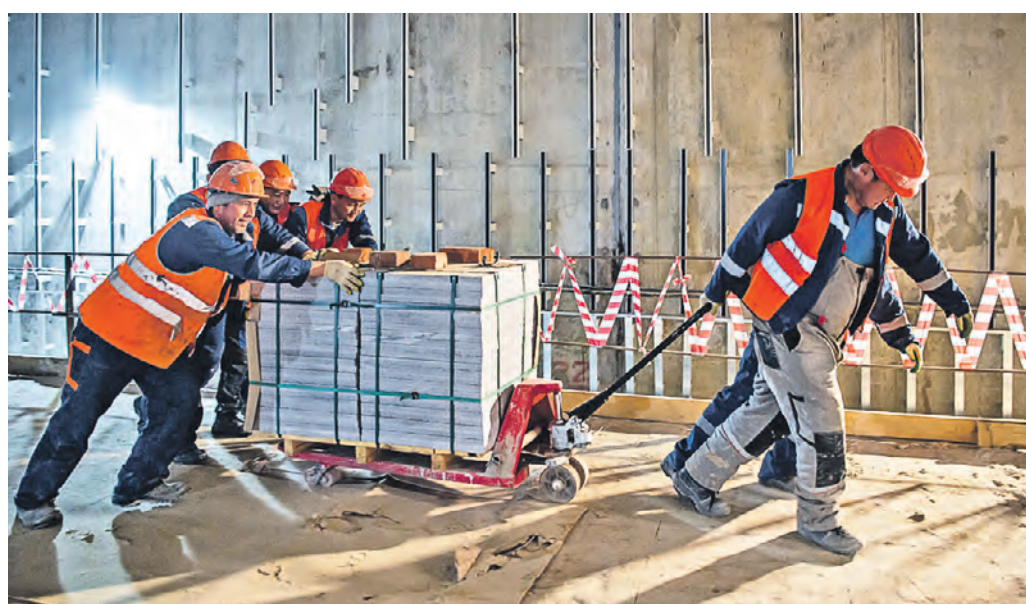
25 мая. Строительство станции «Университет Дружбы Народов» Троицкой ветки метро. В Москве одновременно идет возведение нескольких станций и линий подземки

ловане глубиной до 17 метров. За ней разместят оборотные тупики для ночного отстоя и оборота подвижных составов Арбатско-Покровской ветки. — Длина участка продления синей ветки составит 2,6 километра, — уточнили в столичном Стройкомплексе. — Проектировщики разработали предварительный план трассы участка продления синей ветки. Также сформирован план организации строительства, выделены этапы проведения подготовительных и основных работ. По всем этапам, включающим сооружение тоннелей, котлованов демонтажной камеры, станционного комплекса и оборотных тупиков, разработка проектной документации продолжается. У станции будет платформа островного типа. Ее длина составит 163, а ширина — порядка 11 метров. — Она будет расположена посередине, а пути будут прохо-