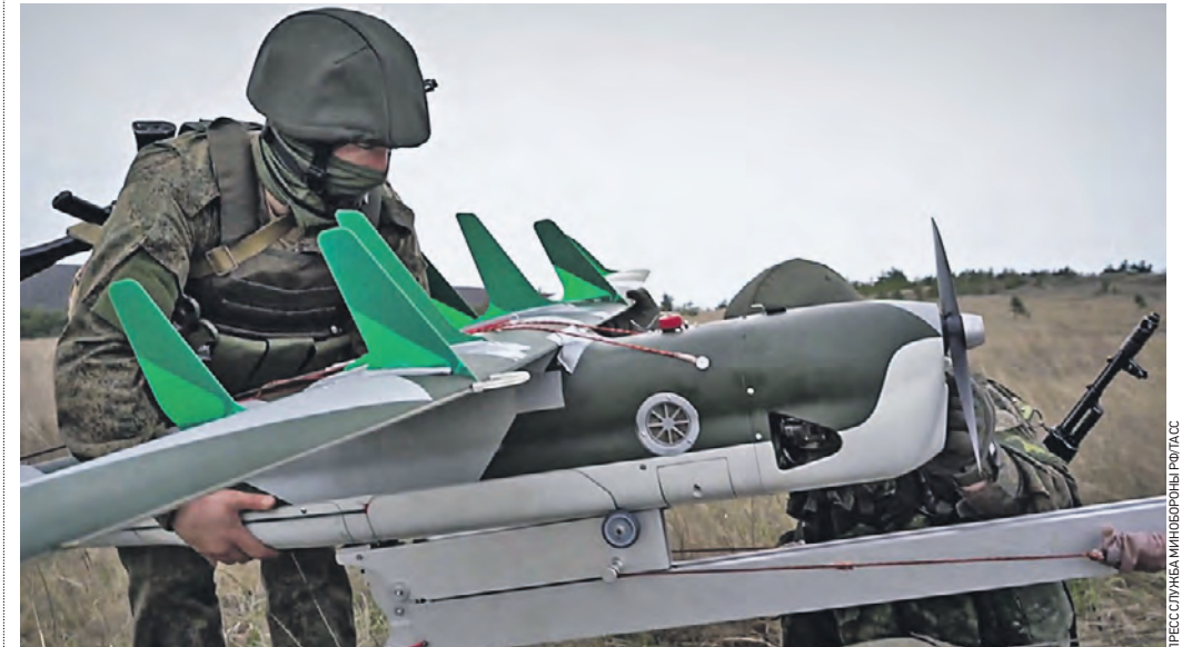
15 апреля 07:04 Военнослужащий расчетов БПЛА «Москит» в зоне спецоперации. Наши бойцы приближают победу, каждый день совершая подвиги и рискуя своей жизнью