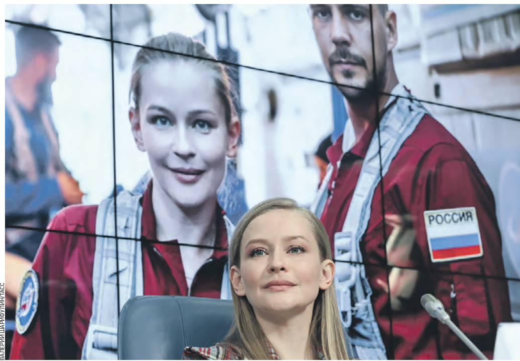
Вчера 13:55 Актриса Юлия Пересильд во время пресс-конференции, посвященной выходу в широкий прокат художественного фильма «Вызов» — первой картины, снятой в космосе

20 апреля в широкий прокат выходит «Вызов» — первый художественный фильм, снятый в космосе. Помимо России, ленту покажут в других странах, идут переговоры с Китаем. Об этом вчера заявил генеральный директор кинокомпании Вадим Верещагин.