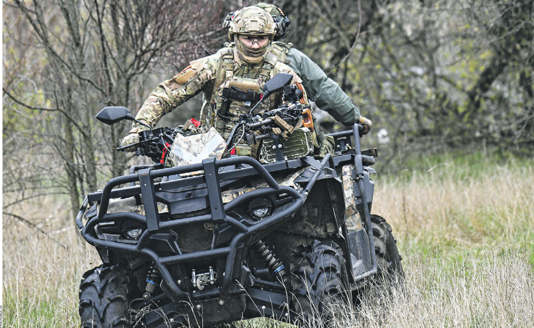
13 апреля 12:22 Военнослужащий подразделения Воздушно-десантных войск едет на квадроцикле во время подготовки штурмовых групп на полигоне в южном секторе спецоперации

Большие потери враг несет и на донецком направлении. — Общие потери противника за сутки составили свыше 270 украинских военнослужащих и наемников, танк, боевая машина пехоты, семь боевых бронированных машин и пять автомобилей, — добавил Конашенков.