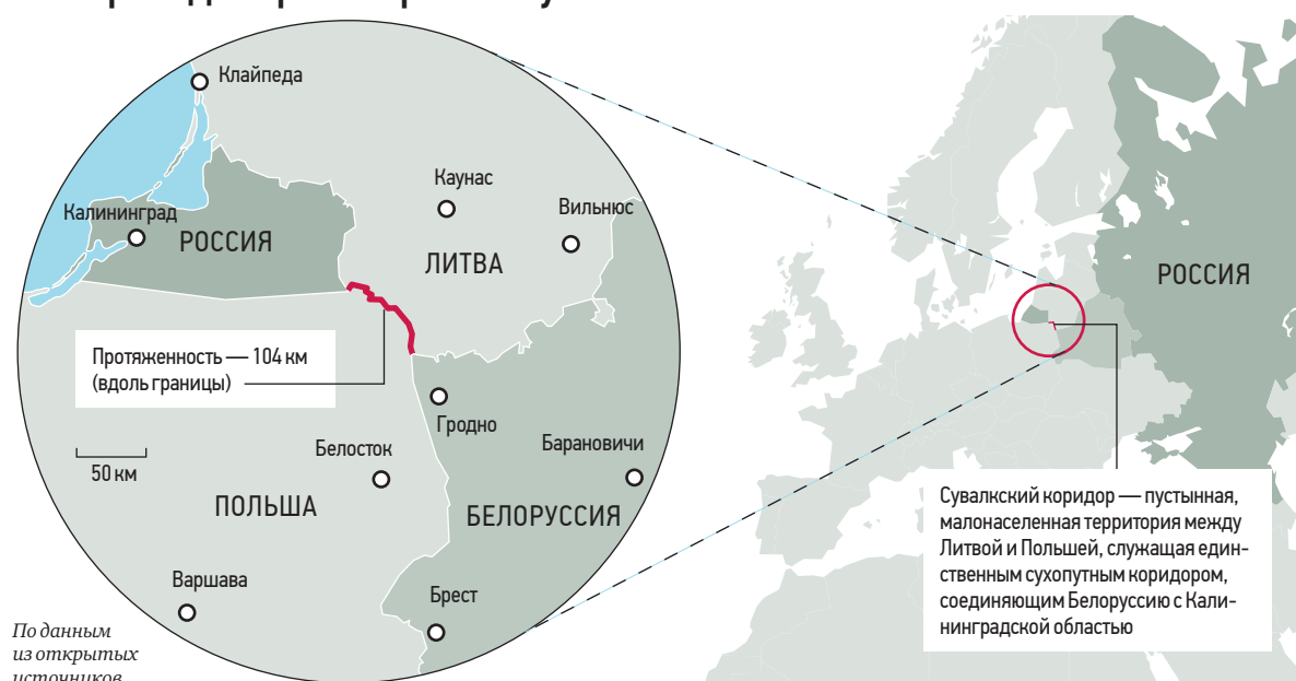
По данным из открытых источников