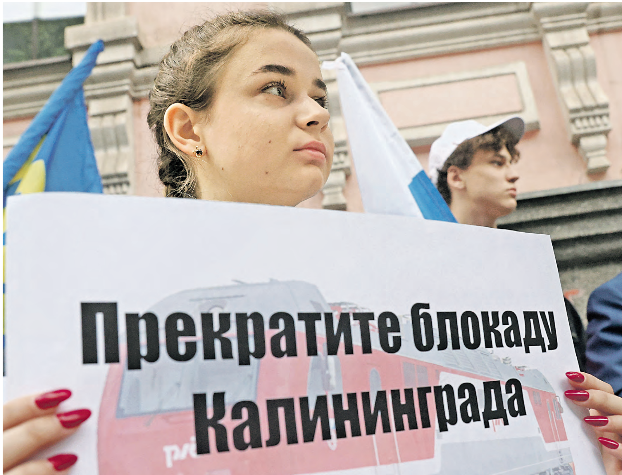
21 июня 2022 года. Участница протеста у посольства Литвы, выступившая против ограничений на поставку российских товаров из ряда регионов страны в Калининград, которые прибалтийская республика ввела 18 июня

Европа пытается сжать кольцо блокады вокруг Калининграда