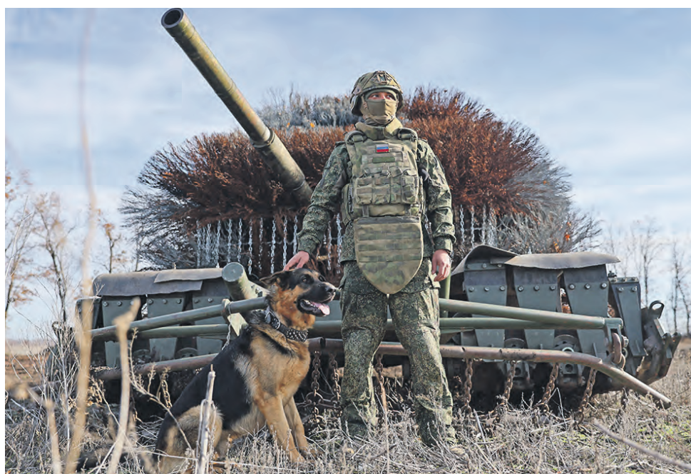
12 ноября. Танкист 36-й бригады 29-й армии группировки войск «Восток» на южно-донецком направлении. Без его боевой машины, прикрывающей наступление штурмовых групп, невозможно представить ни одну успешную атаку российских войск