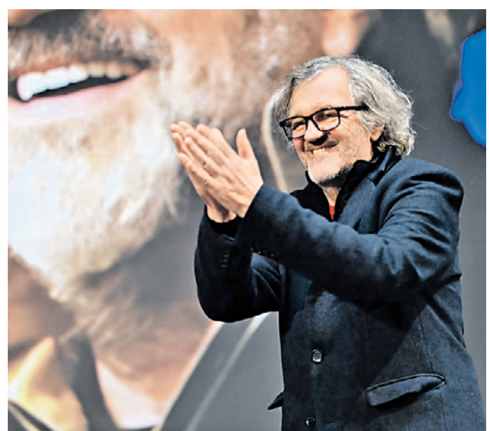
12 ноября. Режиссер Эмир Кустурица проводит творческую встречу со студентами ВГИКа.

Открытие подводной лодки-музея состоялось в День военно-морского флота, 26 июля 2006 года, по инициативе мэра Москвы Юрия Лужкова. Подлодку Б-396 «Новосибирский комсомолец» отбуксировали из Северодвинска (Архангельская область). За время несения службы она совершала боевые походы в Средиземное море, выполняла задачи в Атлантике, у побережья Африки, в Баренцевом и Норвежском морях.