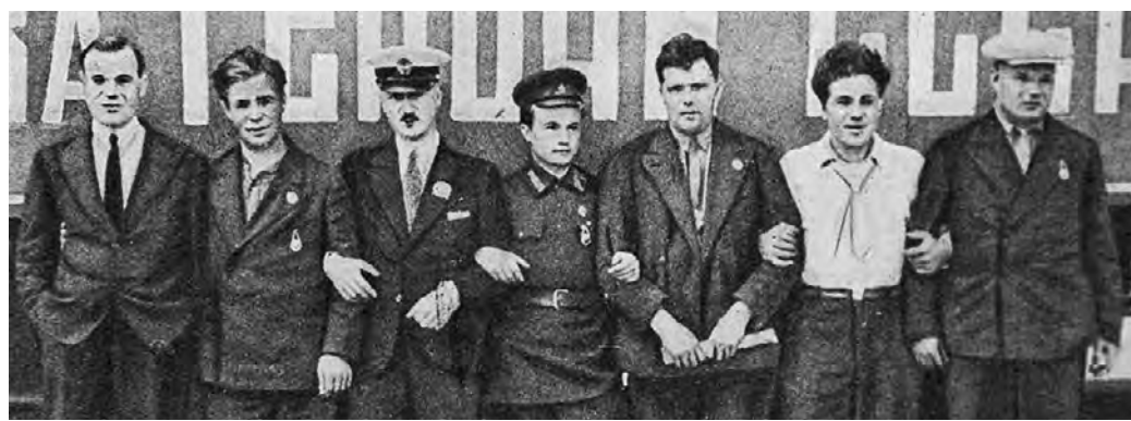
Герои Советского Союза (слева направо): Сигизмунд Леваневский, Василий Молоков, Маврикий Слепнев, Николай Каманин, Михаил Водопьянов, Анатолий Ляпидевский, Иван Дорониин — полярные летчики, спасшие членов экипажа парохода «Челюскин». Фотокопия 1983 года.

16 апреля 1934 года было установлено звание Героя Советского Союза. Это высшая степень отличия в СССР, которой удостаивались за подвиги во время боевых действий и в мирное время.