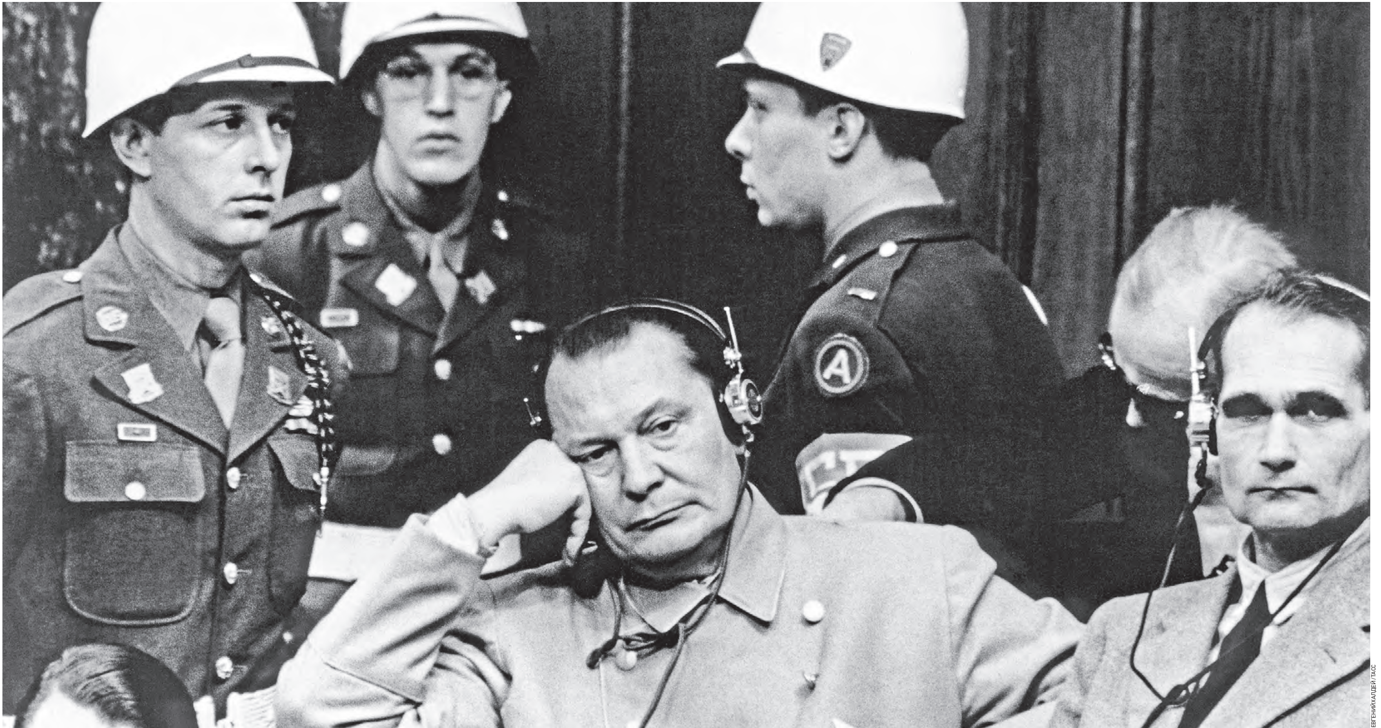
7 декабря 1945 года. Нацистские преступники Герман Геринг (слева) и Рудольф Гесс на одном из заседаний Нюрнбергского трибунала. Первый покончит с собой в тюрьме меньше чем через год, накануне казни. Второй проведет в тюрьме более 40 лет и потом также сведет счеты с жизнью. Такое же самоубийство, только пока политическое, совершают и многие современные европейские политики, забывшие о страшных уроках не такой уж далекой истории

Почему современные западные политики так плохо выучили уроки истории