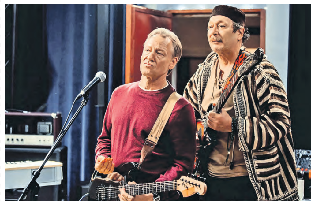
Кадр из сериала «ВИА «Васильки»». На фото — Дмитрий Харатьян (слева, у микрофона) и Владислав Ветров. Звезды сыграли звезд

На СТС скоро покажут новый музыкальный проект Wink «ВИА «Васильки»». Светская вечеринка по поводу премьеры собрала изрядное количество людей и показала, что у проекта есть все шансы стать телехитом.