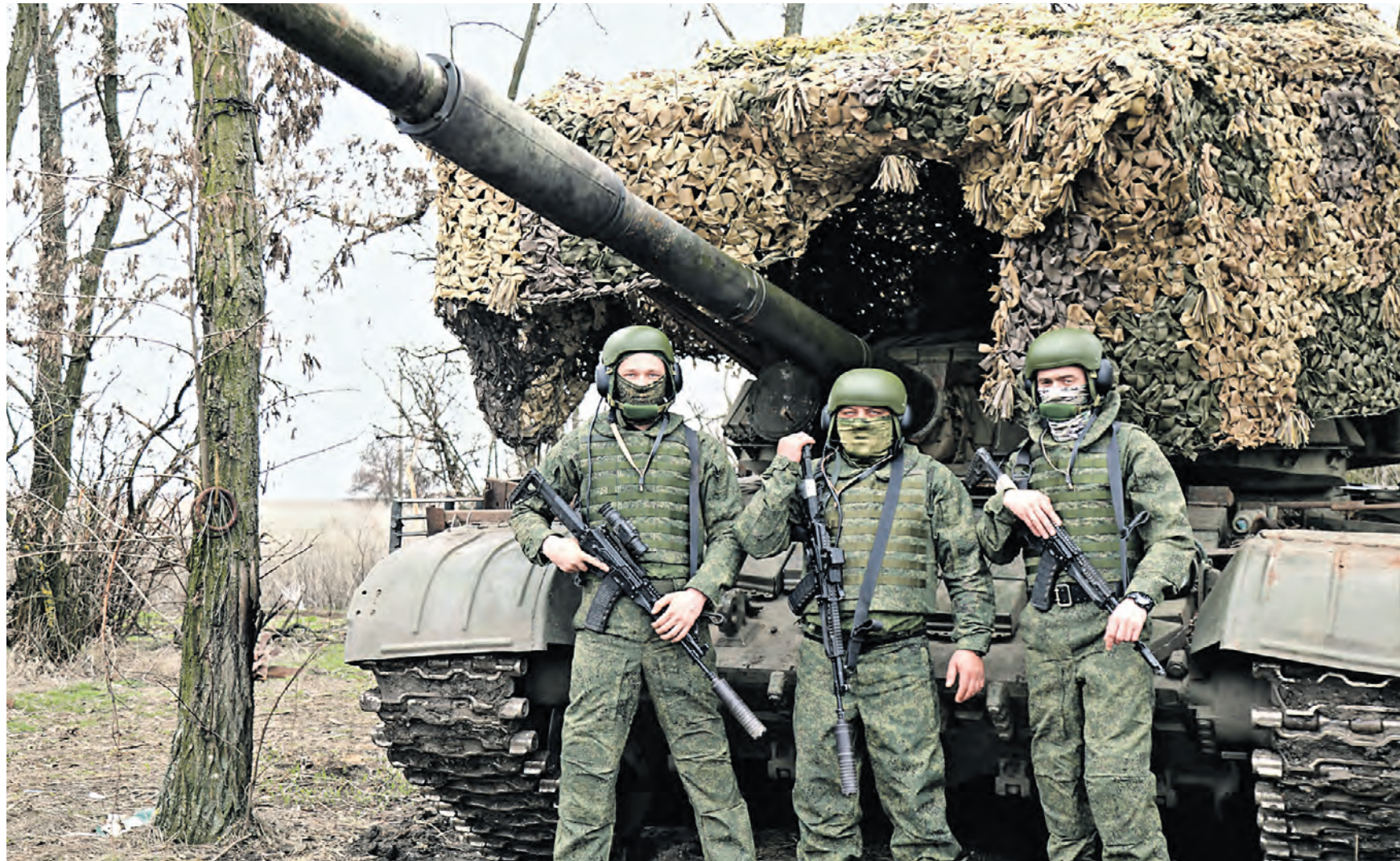
15 апреля. Танкисты 139-го отдельного штурмового батальона группировки войск «Восток» (слева направо) с позывными «Брат», «Ласта» и «Кошечка» рядом со своей надежной боевой машиной.