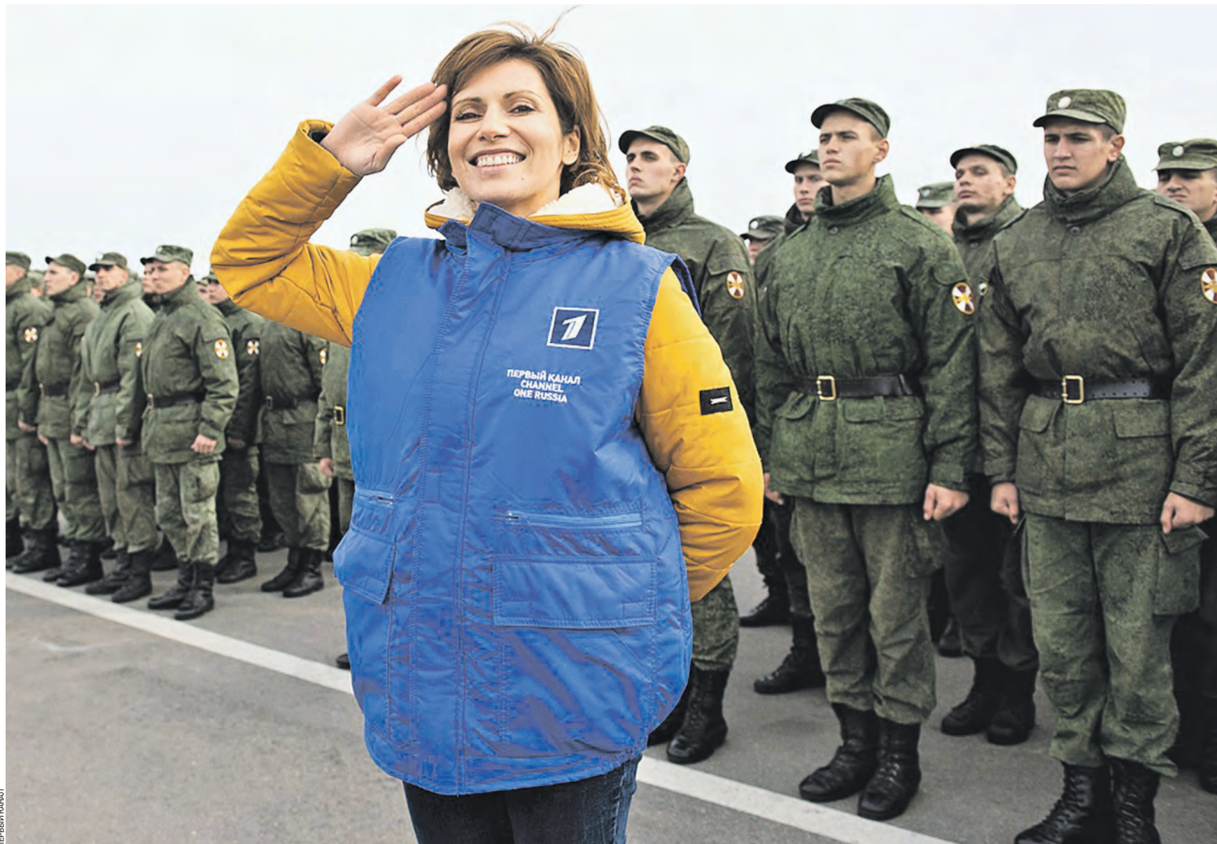
Одна из популярных ведущих Первого канала Светлана Зейналова во время проведения акции «Первый в армии!». Съемка была сделана 4 октября 2017 года в подмосковной Балашихе, где располагается легендарная дивизия оперативного назначения имени Дзержинского