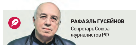
РАФАЭЛЬ ГУСЕЙНОВ Секретарь Союза журналистов РФ