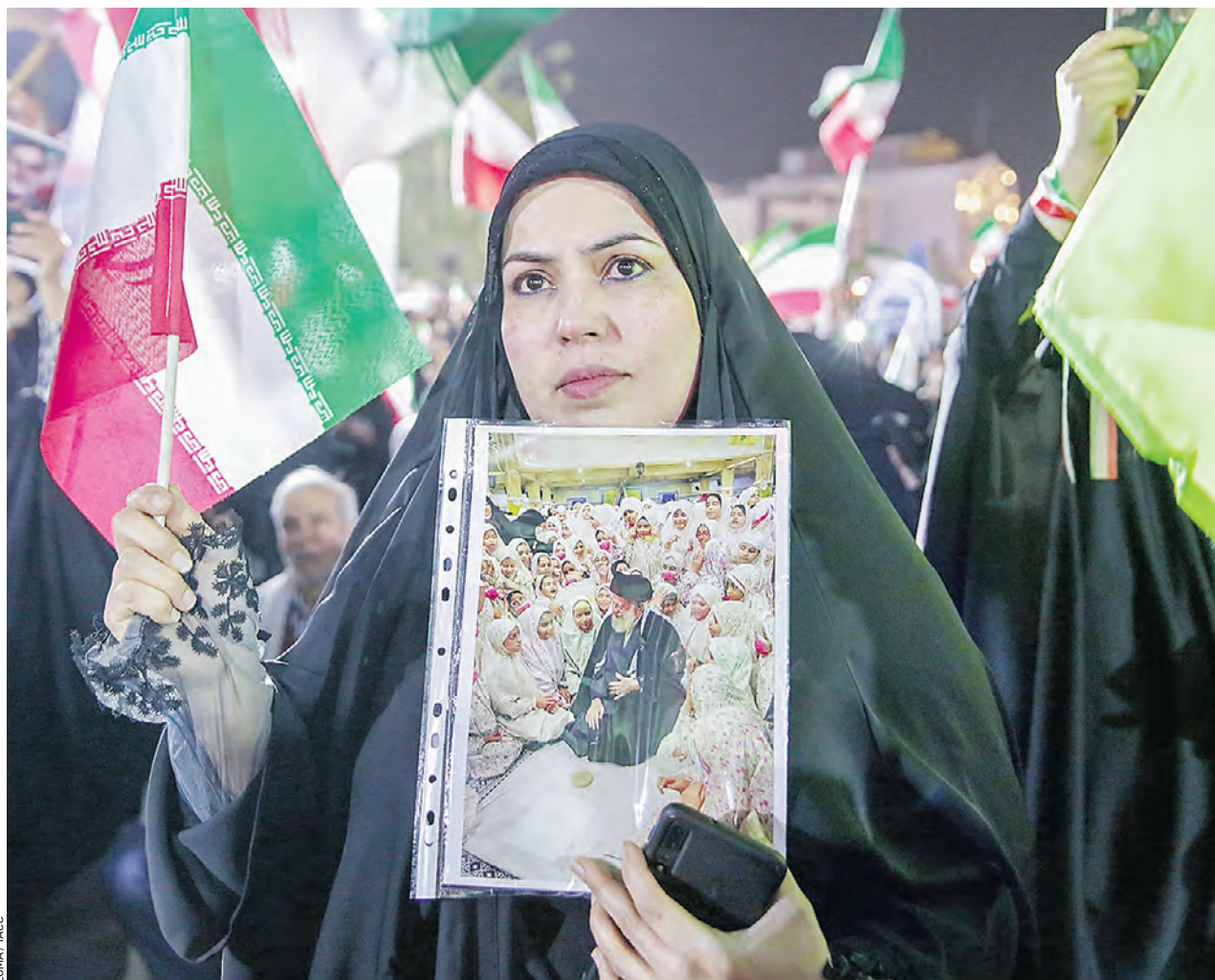
8 апреля. Жительница Исламской Республики Иран с фотографией погибшего аятоллы Хаменеи приняла участие в митинге по случаю перемирия в войне между Тегераном и Вашингтоном

Заявления лидера США о перемирии — это всего лишь политический популизм, — считает политолог. — Война продолжится. Скажу больше, в ближайшее время зона эскалации будет увеличена, поскольку Иран ударит по военным объектам в странах-партнерах США на Ближнем Востоке, как это было и до перемирия. Действительно, пока перемирием и не пахнет. Так, вооруженные силы Кувейта с утра 8 апреля перехватили 28 иранских беспилотников. В заявлении сказано, что часть дронов направилась