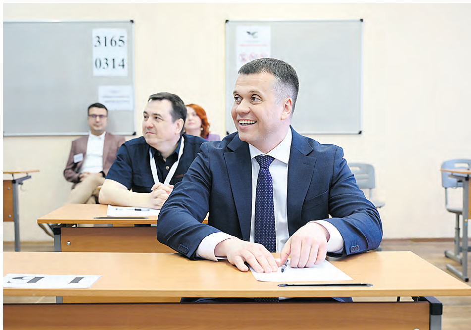
8 апреля. Замруководителя Рособрнадзора Игорь Круглинский перед началом ЕГЭ по русскому языку, который он сдавал в рамках ежегодной акции.

И для чиновника, и для родителей полностью воспроизвели весь процесс. При входе на пункт проведения установили рамку-металлоискатель, провели проверку паспорта, заставили сдать телефон. — Игорь Константинович, проходите в кабинет, — пригласила замглаву Рособрнадзора организатор пункта Екатерина Алексеева.