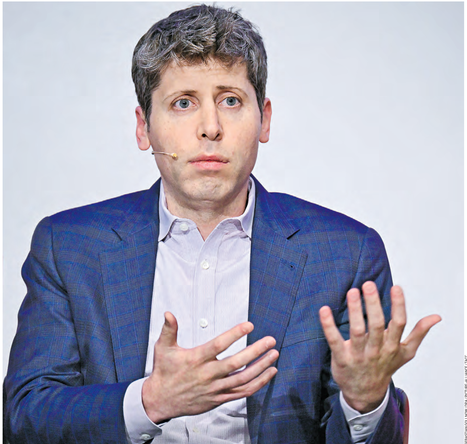
7 февраля 2025 года. Глава компании OpenAI Сэм Альтман выступает в Берлинском техническом университете

Получается историческое противоречие. Технология, которая должна была привести нас к изобилию, приносит только двойную нагрузку и массовые увольнения — причем последние часто проходят под шумок громких заявлений о цифровой трансформации. «ВМ» пообщалась с экспер-