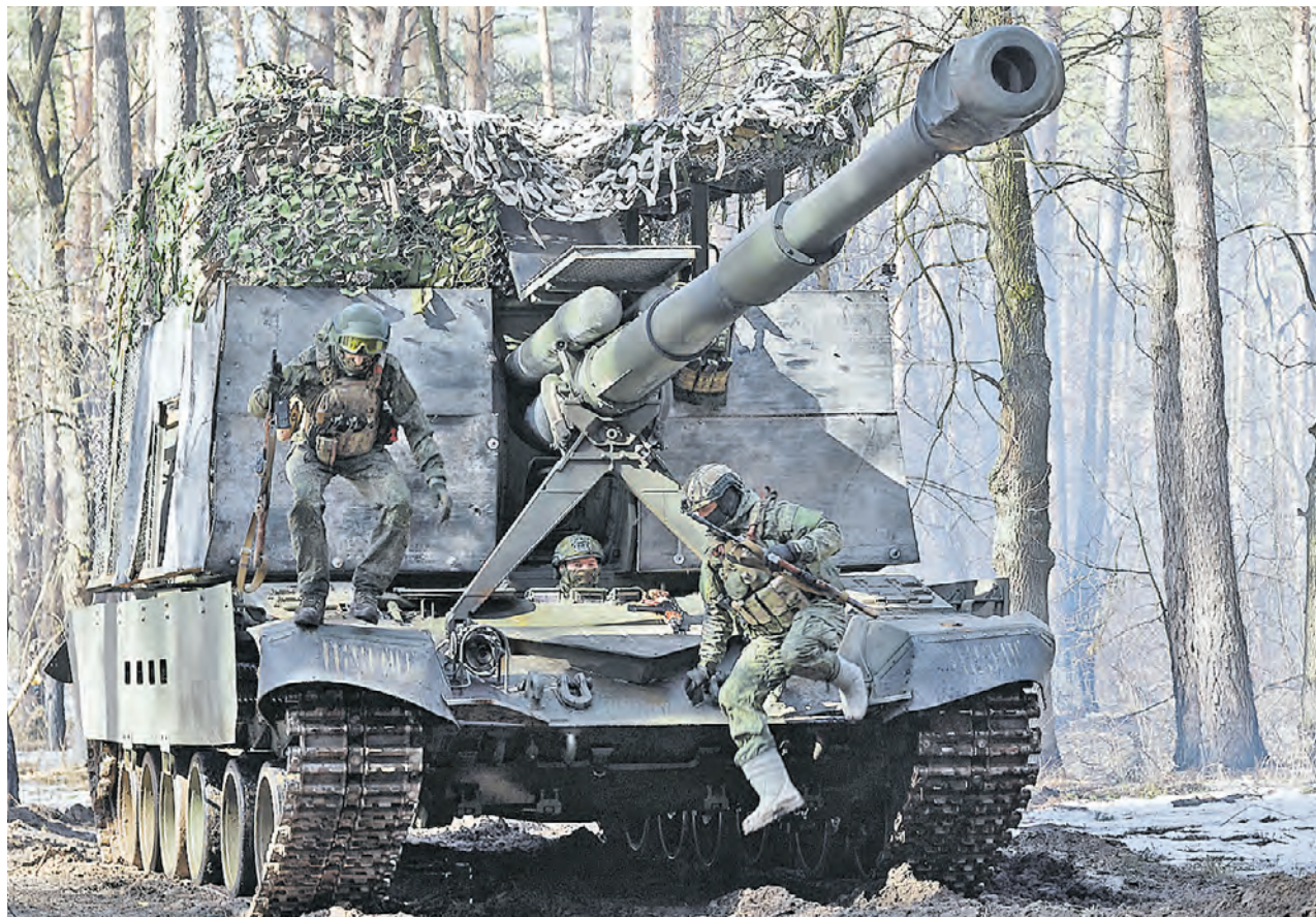
25 марта. Военнослужащие вернулись с боевой задачи, отработав на «Мсте-С».

Один из тех, кто делает эту работу ежедневно, — командир орудия 10-го самоходно-артиллерийского полка с позывным «Карма». Сам он признается, что после школы хотел стать офицером, пытался поступить в военную академию, а позже все равно пришел к мысли связать жизнь с армией. Подписал контракт, попал в самоход-