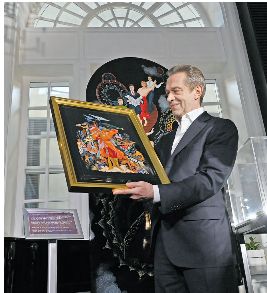
15 апреля. Художественный руководитель театра «Современник» Владимир Машков принимает подарок — панно от художников Палеха.

ИСТОРИЯ ТЕАТРА НАЧАЛАСЬ С НОЧНОГО СПЕКТАКЛЯ, КОТОРЫЙ ПОСТАВИЛ ОЛЕГ ЕФРЕМОВ