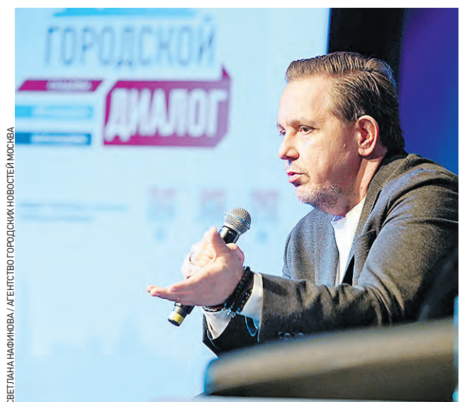
СВЕТЛАНА НАФИКОВА / АГЕНТСТВО ГОРОДСКИХ НОВОСТЕЙ МОСКВЫ