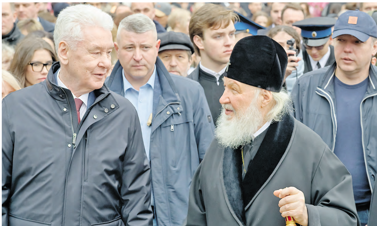
15 апреля. Мэр Москвы Сергей Собянин и Патриарх Московский и всея Руси Кирилл посетили фестиваль «Пасхальный дар», центральной площадкой которого впервые стала Пушкинская набережная Парка Горького.

Мэр Москвы призвал гостей «Пасхального дара» оказать поддержку нашим бойцам на фронтах спецоперации