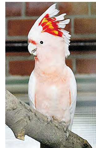
Какаду инка готовы встречать гостей Московского зоопарка