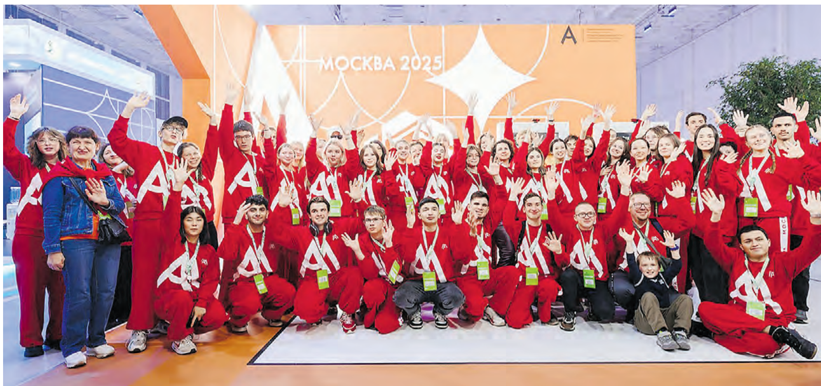
2 ноября 2025 года. Сборная команда Москвы на национальном чемпионате «Абилимпикс» стала лучшей почти во всех компетенциях, завоевав 101 медаль