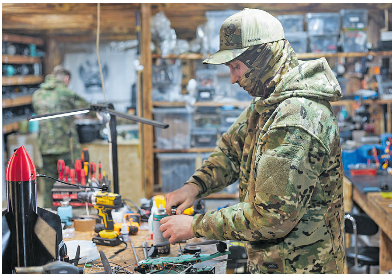
25 апреля. Военнослужащий 82-го мотострелкового полка группировки ВС РФ «Север» с позывным «Дэйл» трудится в мастерской, подготавливая дрон к боевой работе.

Процесс сборки одной машины занимает от тридцати минут до часа. Каждый дрон проходит