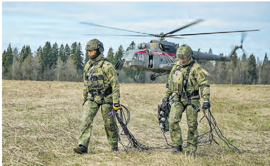
15 апреля. Сотрудники специального отряда быстрого реагирования «Столица» и отряда мобильного особого назначения «Авангард» Главного управления Росгвардии по Москве после беспарашютного десантирования из вертолета Ми-8