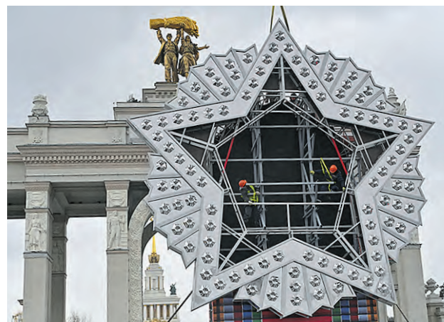
29 апреля. Специалисты монтируют конструкцию «Орден Победы» на ВДНХ.