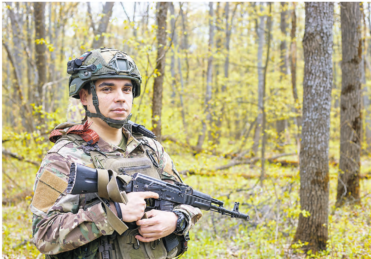
28 апреля. Заместитель командира штурмового отряда по военно-политической работе 83-го мотострелкового полка 6-й общевойсковой армии группировки войск «Север» с позывным «Турист».

Кроме ордена «Мужества» у «Туриста», медали «Участника специальной военной операции», «За боевые отличия», «За воинскую доблесть» I и II степеней. Есть и память о срочной службе — медаль «90 лет пограничных войск». Он служил на границе еще до СВО.