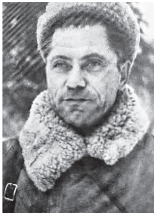
А так — в годы Великой Отечественной войны

обороны. К исходу второго дня (19 декабря) наш полк оказался полностью окруженным гитлеровцами. Командование полка приняло решение — крепко держать круговую оборону, а под покровом ночи быстро маневрировать.