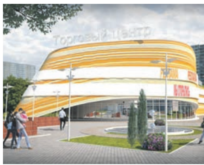
Проект транспортно-пересадочного узла на станции метро «Пятницкое шоссе» в Северо-Западном округе столицы

живут и работают по такому же принципу. Главная задача, которую ставит перед собой город, — это соблюсти баланс между технологической частью и строительством коммерческих объектов. — Сам по себе транспорт — дорогостоящая инфраструктура, — признается Марат Хуснуллин. — За счет реализации земельных участков и возможности строительства недвижимости вокруг транспортно-пересадочных узлов город получает компенсацию на строительство транспортной инфраструктуры. Практически во всех проектах этот баланс найден. Так, в составе транспортно-пересадочного узла «Технопарк» появится жилой комплекс. Инвестор построит дом с подземным паркингом и встроенным детским садом. Кроме того, проектом преду-