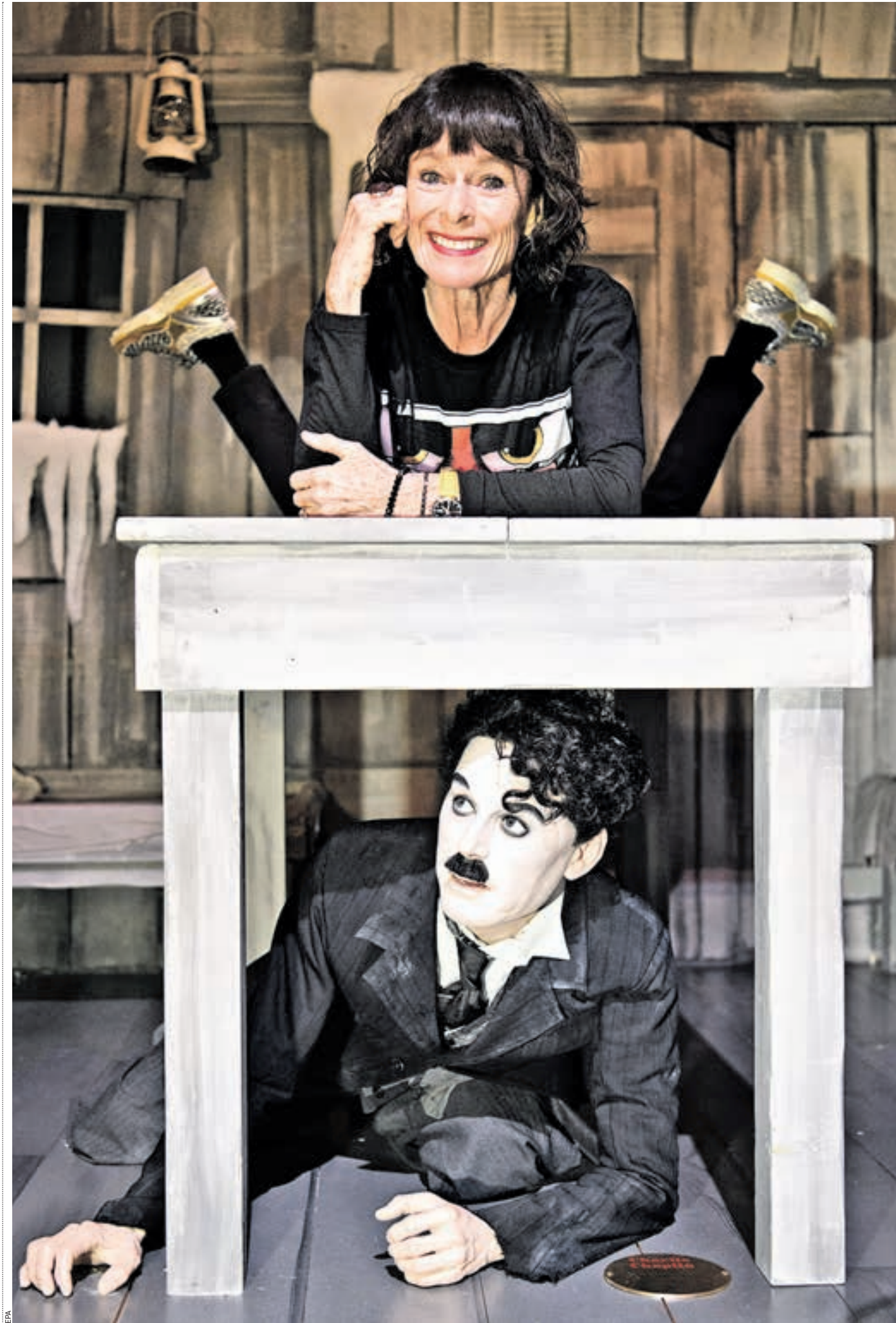
Точка Сегодня точку в номере ставит Джеральдин Лей Чаплин — британская актриса американского происхождения и дочь легендарного Чарли Чаплина, позирующая рядом с восковой фигурой своего отца. Удивительная в своей реалистичности скульптура — один из главных экспонатов музея Chaplin's World в швейцарском Корсье. На территории этого музея площадью 14 гектаров находится особняк, где лучший комик всех времен и народов жил на протяжении 25 лет, обширная экспозиция реквизита, задействованного в съемках фильмов с Чаплиным, и многое другое.

Мнение колумнистов может не совпадать с точкой зрения редакции «Вечерней Москвы»