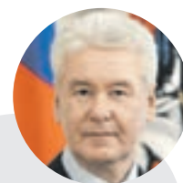
СЕРГЕЙ СОБЯНИН МЭР МОСКВЫ

На протяжении нескольких лет мы ведем работу по наведению порядка на московских улицах и площадях. Это позволяет проводить нам на общественных пространствах крупные уличные мероприятия, доступные для всех жителей и гостей столицы. Это не просто украшательство или прихоть городских властей. Уличные мероприятия, фестивали и ярмарки посещают миллионы людей — всех возрастов и профессий. Все это способствует развитию индустрии туризма, отдыха, сферы гостиничного хозяйства, торговли и услуг, малого и среднего бизнеса, в целом экономики города. Сегодня мы начали подготовку к наиболее популярному и известному фестивалю «Путешествие в Рождество». В нем примут участие 15 стран и представители 40 регионов России. Учитывая мнения горожан, центральные площадки в новогоднюю ночь проработают до трех часов ночи. Благодаря системной работе Москва заняла ведущие позиции, рекомендуемые для путешествий, и наша столица становится одним из самых привлекательных мегаполисов. Мы постараемся сделать все, чтобы Рождество и новогодние праздники стали незабываемыми и интересными для москвичей.