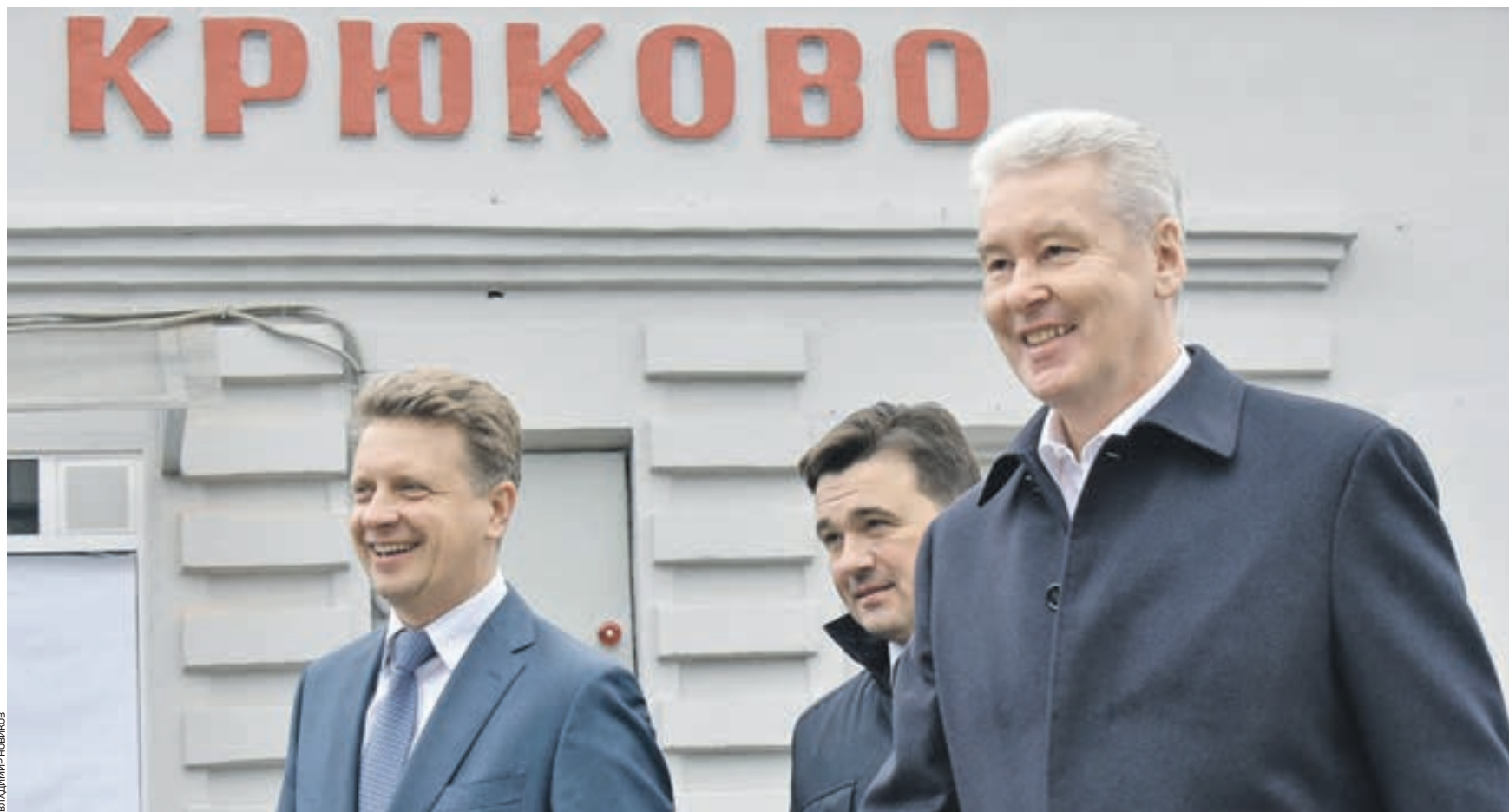
1 октября 2015 года 10:50 Мэр Москвы Сергей Собянин (справа) вместе с министром транспорта России Максимом Соколовым (слева) и губернатором Московской области Андреем Воробьевым (в центре) на станции Крюково открыли движение пригородных поездов «Ласточка»

ДЕНЬ МЭРА Вчера мэр Москвы Сергей Собянин принял участие в заседании координационного совета по развитию транспортной системы Москвы и области. Также глава города провел заседание президиума столичного правительства.