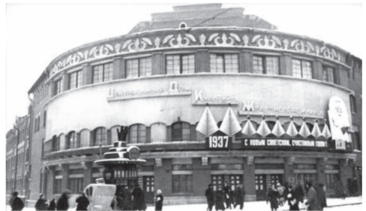
1937 год. 10 лет с момента своего открытия Дом культуры железнодорожников назывался Клубом имени Октябрьской революции. Только в 1937 году он получил новое имя. С этой даты сегодня ведут отсчет его истории сотрудники ЦДКЖ