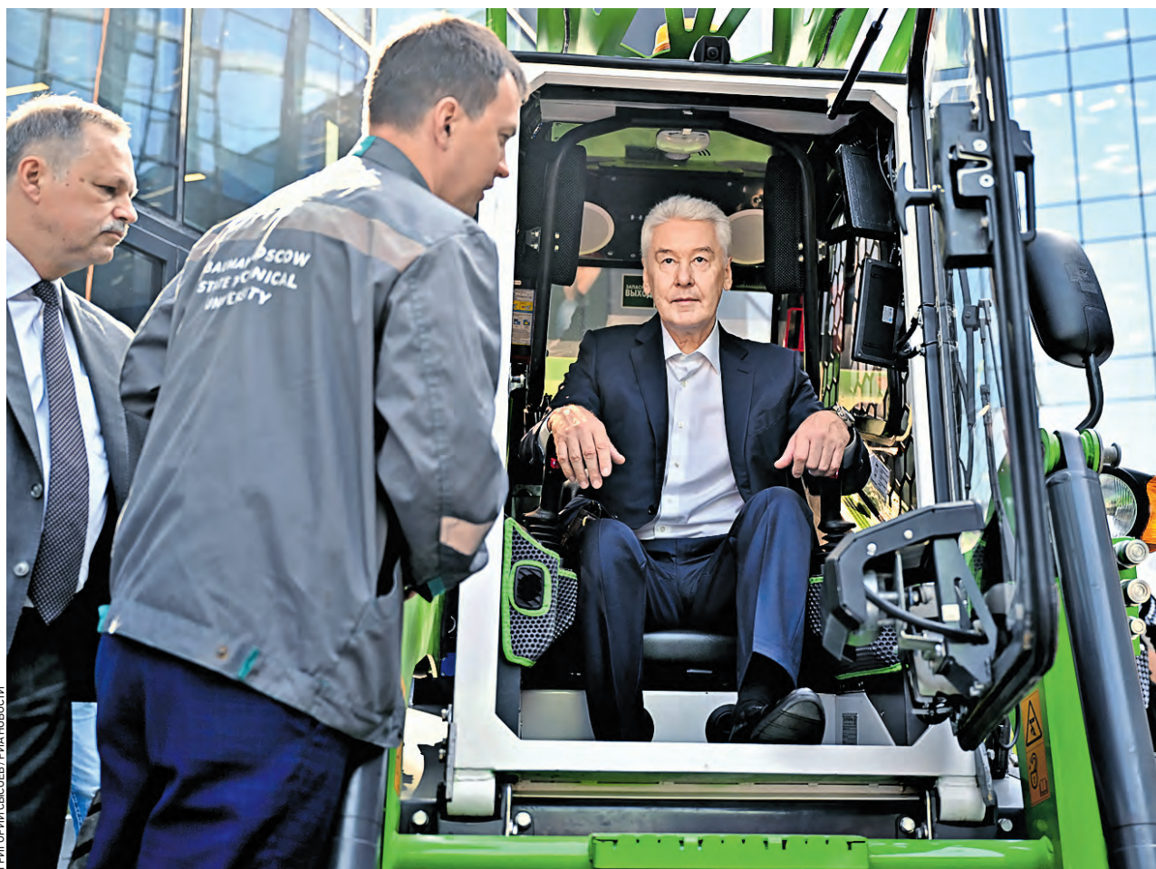
Мэр Москвы Сергей Собянин в Многофункциональной электроплатформе «HARD E» на территории МГТУ имени Н. Э. Баумана

ЗА ОДНУ СМЕНУ УСТРОЙСТВО УБИРАЕТ БОЛЕЕ ДВУХ ГЕКТАРОВ