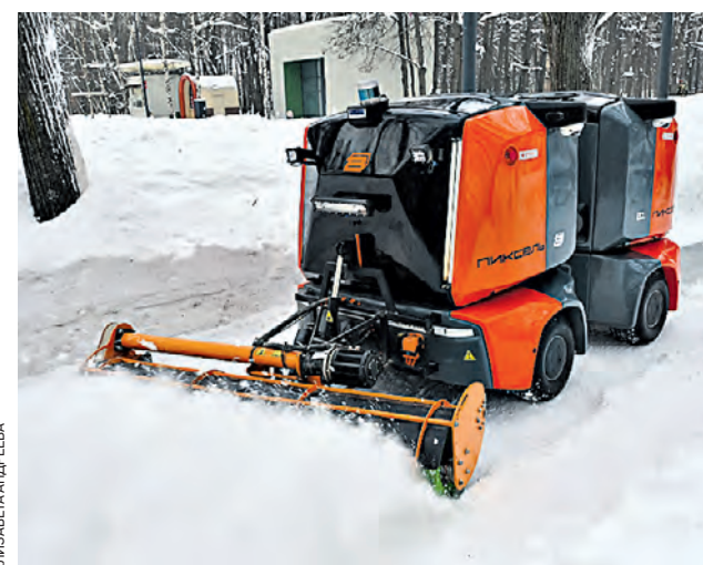
21 января. Робот «Пиксель» убирает снег в парке «Сокольники».