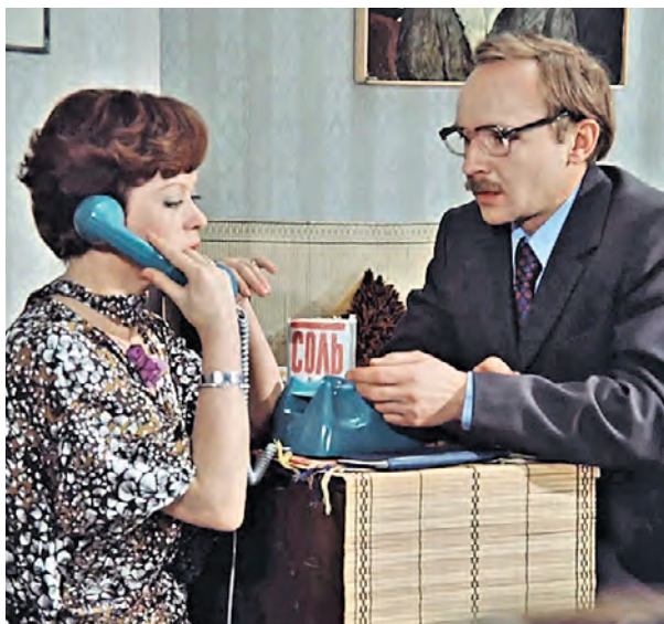
Кадр из фильма «Служебный роман» (1977): Алиса Фрейндлих в роли Людмилы Прокофьевны и Андрей Мягков в роли товарища Новосельцева

Вопреки устоявшемуся мнению мужчины по всему миру все чаще выбирают пару с учетом финансового положения партнерши. Стереотип о том, что «охотницами за деньгами» обычно являются женщины, оказался несостоятельным: представители сильного пола, оказываются более обеспеченными спутницами, если это повышает их социальный статус.