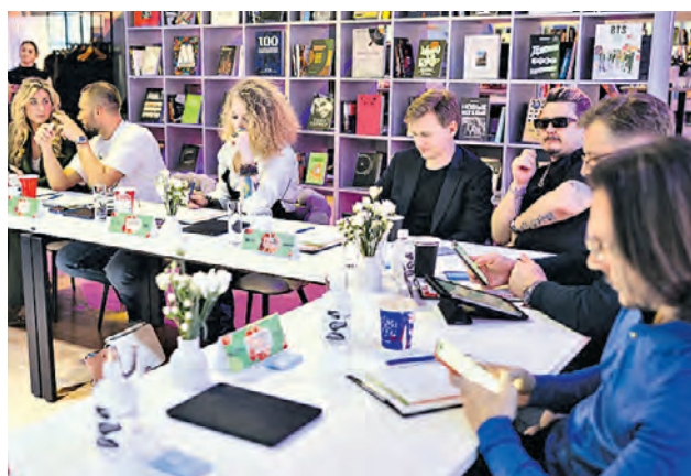
12 марта. Участники отборочного этапа проекта «Плейлист Моспродюсер | Музыка в парках»

Зимой и летом в парках, на катках и за городом можно услышать чудесные треки, однако немногие знают, как они попадают в сезонную подборку. В этом году в Измайловском парке, парке «Сокольники»,