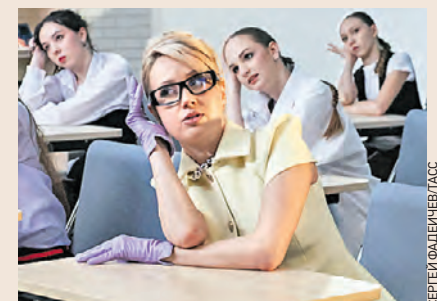
Певица Клава Кока во время съемок музыкального клипа в школе «Свиблово»