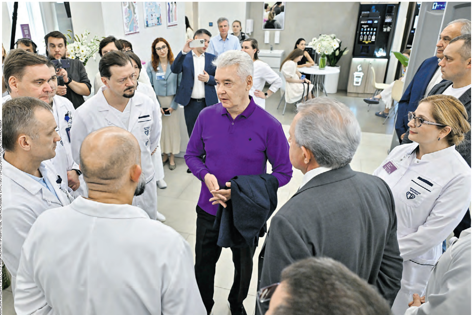
7 июля 2025 года. Мэр Москвы Сергей Собянин посетил центр женского здоровья больницы № 67 имени Ворохобова

35 ТЫСЯЧАМ МОСКВИЧЕК ОКАЗАЛИ ПОМОЩЬ В АМБУЛАТОРНОЙ ГИНЕКОЛОГИИ ЗА ПРОШЛЫЙ ГОД