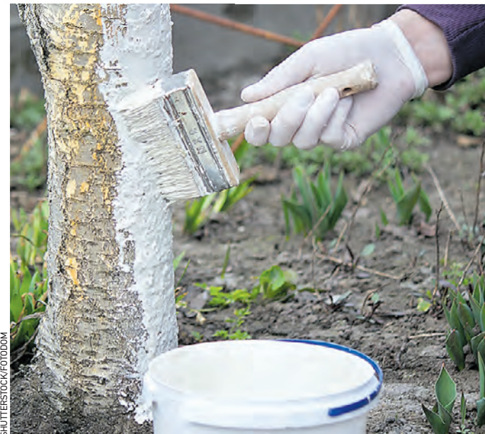
Побелка защищает плодовые деревья от солнечных ожогов, перепадов температур, вредителей и болезней